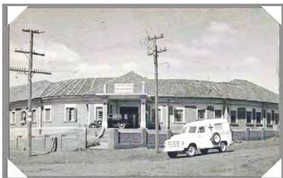
Casa de Saúde Rocha Loures, 1947. Museu Histórico de Londrina-UEL.