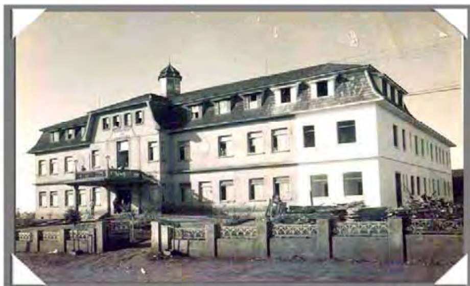
Santa Casa de Misericórdia, 1944.