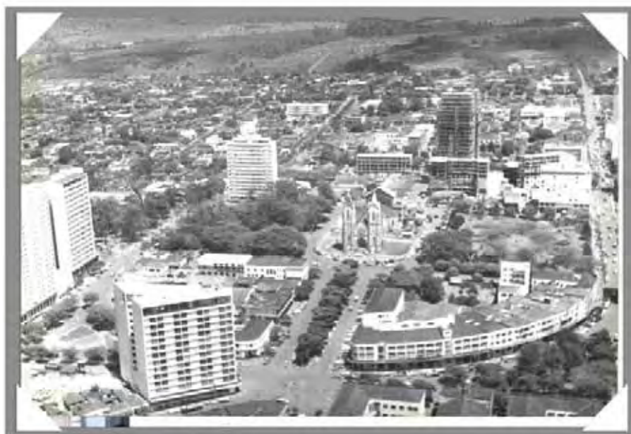
A cidade de Londrina em 1969.