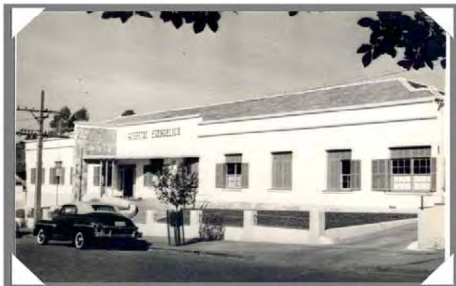
Hospital Evangélico década de 1950, Museu Histórico de Londrina-UEL.