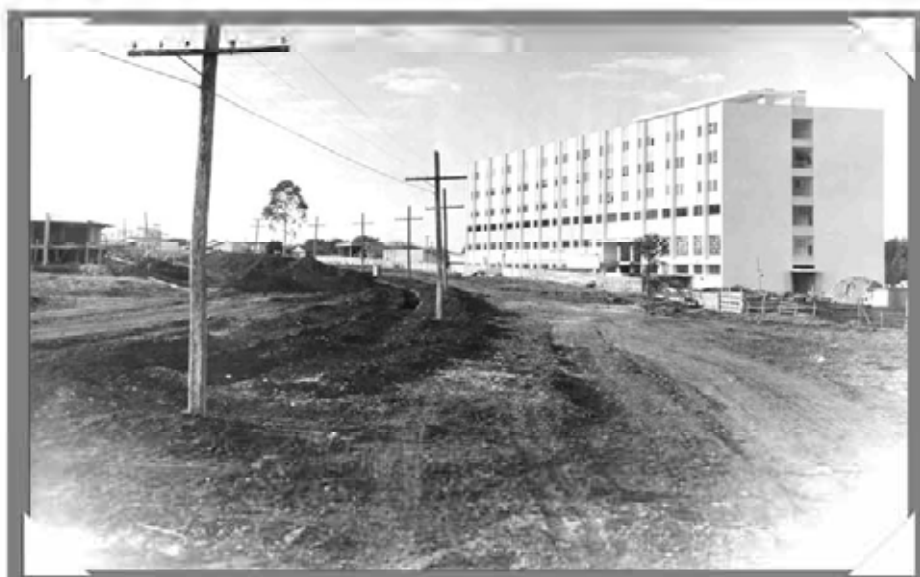
Hospital Evangélico, 1969.