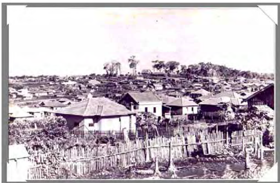
A cidade de Londrina em 1938.