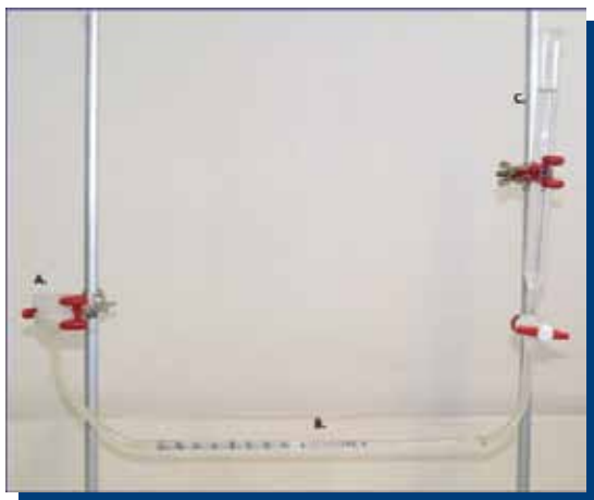
Figura 2. Máquina de difusión. A: Cámara de difusión; B: Capilar milimetrado; C: Columna de agua.