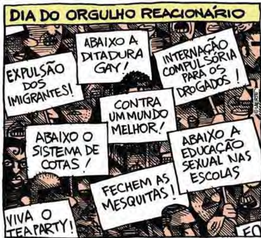
Figura 1 – Dia do Orgulho Reacionário

defesa da educação sexual na escola já faz parte do senso comum: ser contrário à educação sexual implica ser tachado imediatamente de reacionário, como ilustra a Figura 1 abaixo: