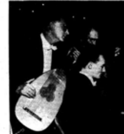
INTERPRETAÇÃO DA MUSICA DE MARABÁ — Foi finalizado recentemente, em Brasília, o trabalho de composição musical para o espetáculo "A Rainha e os Rebeldes".