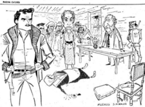
A peça de DBC com o "Salvador" de "A Rainha"