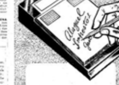
Curso de Fotografia