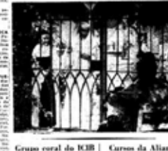
Grupo coral do ICB

BRITTO, 22 (F. P.) — Um grupo de artistas brasileiros viajou para Paris para participar de uma exposição. A exposição será realizada no Museu de Arte Moderna de Paris.