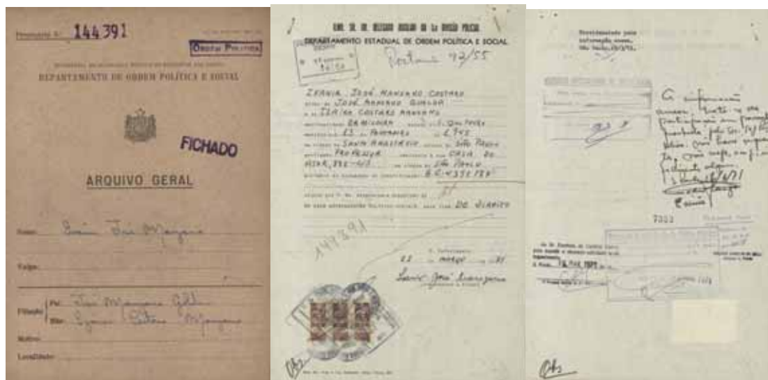
Foto 7 - Prontuário de Ivanir José Manzano, número 144.391, arquivo do DOPS