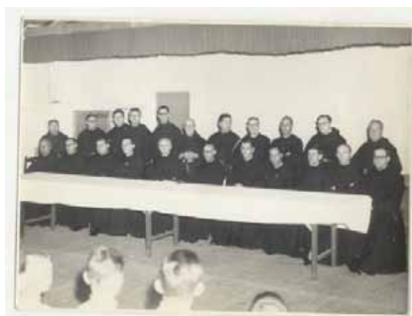
Foto 4 - A Criação da Província de Santa Rita de Cássia, 29 de junho de 1960, Residência São José, Ribeirão Preto/SP