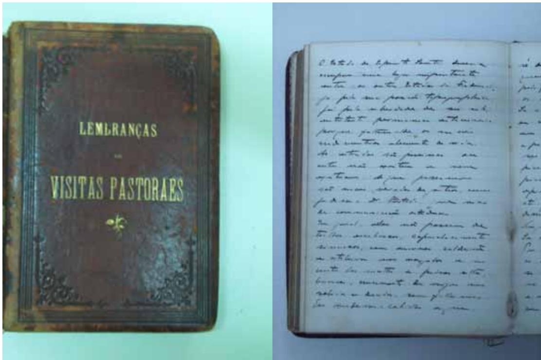
Foto 1 - Manuscrito de D. João Batista Corrêa Nery, primeiro bispo de Vitória