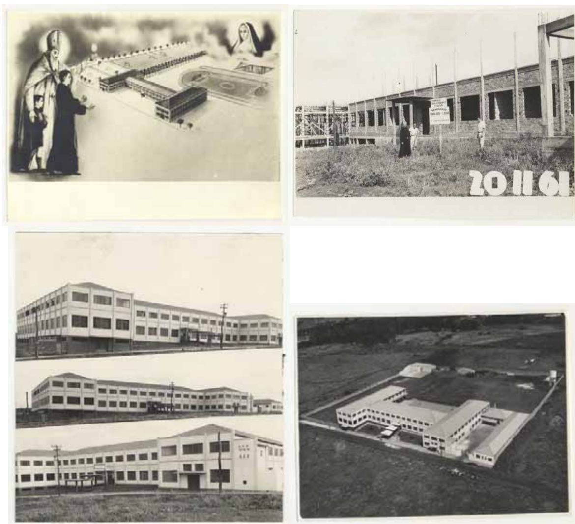
Foto 5 - Seminário Santa Rita, Ribeirão Preto/SP