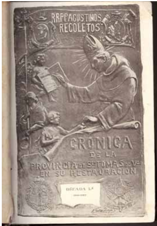
Ilustração 1 - Página de abertura do Livro de Crônicas