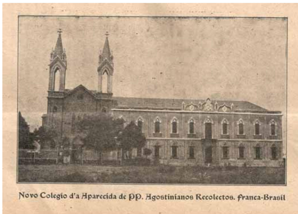
Foto 2 - Convento Nossa Senhora Aparecida, Capelinha, Franca, no início do século XX.