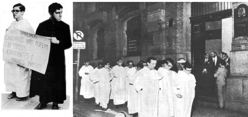
Foto 8 - Manifestações dos estudantes dominicanos em frente ao DOPS, em São Paulo