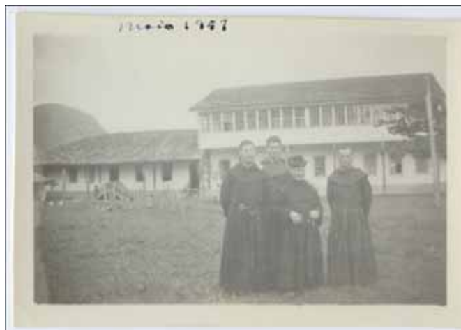
Foto 3 - Frades na Fazenda do Centro, Espírito Santo em meados do século XX.

Fonte: Arquivo da Província de Santa Rita de Cássia, Ribeirão Preto, SP