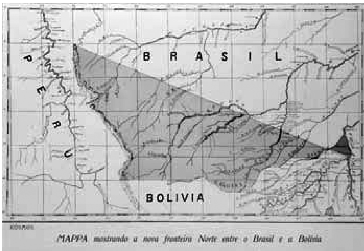
Figura 1: Mapa das fronteiras do Brasil, publicado na Revista Kosmos , em janeiro de 1904. Fonte: < http://www2.uol.com.br/historiaviva/estatica/acre.htm >. Acessado em <06/07/2007>

Durante as conversações diplomáticas entre brasileiros e bolivianos, ao longo do século XIX, para a resolução da “questão do Acre”, o governo peruano tentou participar das negociações, inclusive em 1903, na assinatura do Tratado de Petrópolis. O barão do Rio Branco recusava-se a realizar qualquer negociação tríplice, apontou Álvaro Lins, como parte de uma tática diplomática de isolar os adversários e negociar com cada um em particular. 34