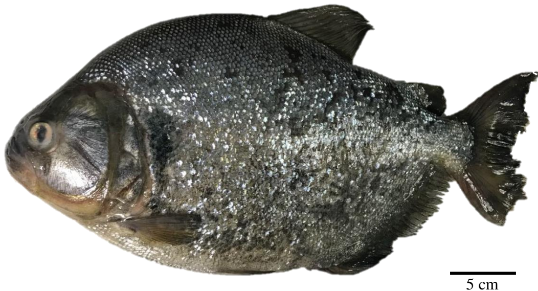
Figura 3: Serrasalmus maculatus Kner, 1856 (Characiformes: Serrasalminidae), coletada do rio Jacaré-Pepira, sub-bacia do Tietê-Jacaré, Estado de São Paulo, Brasil.

Na bacia do alto rio Paraná, a fauna parasitária de S. maculatus é composta por Monogenea, Digenea, Nematoda, Cestoda Acanthocephala e Copepoda, com pelo menos 17 espécies de parasitos registrados, a maioria pertencente ao filo Nematoda, com aproximadamente 7 espécies registradas (Takemoto et al., 2009; Lehun et al., 2020).