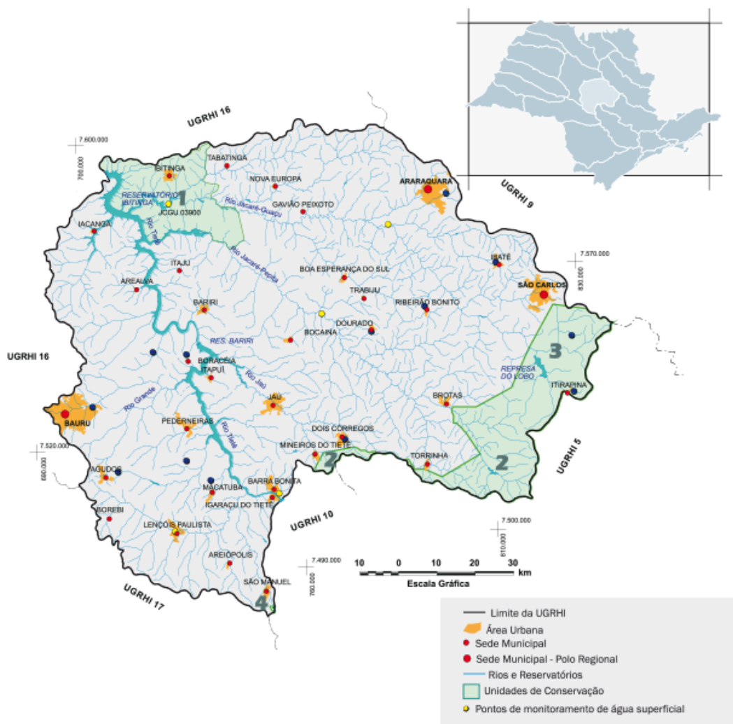
Figura 5: Bacia hidrográfica do Tietê-Jacaré, Estado de São Paulo, Brasil.

A BH-TJ possui apenas 26,5% de vegetação das Áreas de Preservação Permanente (APP) preservadas. Das seis sub-bacias que compõem a BH-TJ, as dos rios Jacaré-Guaçu e Jacaré-Pepira possuem os menores índices de degradação, correspondendo a 66,41% e 64,83% de APP degradada, respectivamente. As duas sub-bacias também apresentam os maiores percentuais de fragmentos de vegetação remanescente de toda BH-TJ, que corresponde a 37% do total de vegetação remanescente da bacia (Estado de São Paulo, 2015).