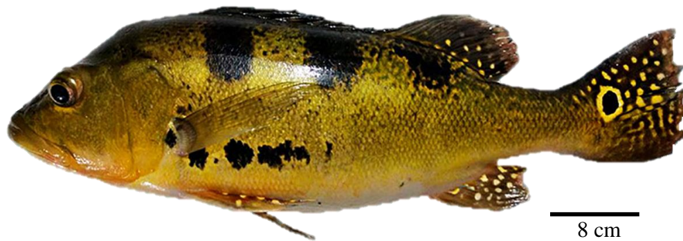
Figura 2: Cichla kelberi Kullander & Ferreira, 2006 (Cichliformes: Cichlidae).

Em áreas onde a espécie foi introduzida, a fauna parasitária de C. kelberi tende a possuir uma baixa riqueza de espécies, e é constituída basicamente de espécies generalistas (Yamada e Takemoto, 2013), com exceção de algumas que possuem especificidade parasito-hospedeiro, como Proteocephalus macrophallus (Diesing, 1850) (Scholz et al., 1996). Em ambientes introduzidos, os principais taxa registrados de parasitos são Monogenea, Digenea, Nematoda, Cestoda e, em alguns casos, Crustacea (Kohn et al., 2011; Santos- Clapp and Brasil-Sato, 2014; Yamada e Takemoto, 2013). Na bacia do Tietê-Jacaré, no rio Jacaré-Pepira, foram registradas 9 espécies, na maioria monogéticos do gênero Gussevia Kohn & Paperna, 1964 (Januário et al., 2019).