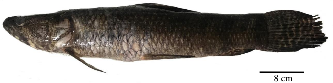
Figura 1: Hoplias malabaricus (Bloch, 1794) (Characiformes: Erythrinidae), coletada do rio Jacaré-Pepira, sub-bacia do Tietê-Jacaré, Estado de São Paulo, Brasil.

A fauna parasitológica de H. malabaricus já foi bastante estudada em diversas bacias da América do Sul. No Brasil, existem estudos nas bacias do rio Paraná, Amazônica, Uruguai, Atlântico Nordeste Ocidental e Oriental, São Francisco, Tocantins-Araguaia, Rio Paraguai e Atlântico Sudeste, com aproximadamente 50 espécies de parasitos já registrados, sendo Monogenea e Nematoda os grupos com mais espécies registradas (Gião et al. 2020), este último com registros de espécies de potencial zoonótico como as do gênero Contracaecum Railliet & Henry, 1912, Eustrongylides Jägersk, 1909 e Hysterothylacium Ward & Magath, 1917 (Gião et al., 2020; Leite et al., 2021).