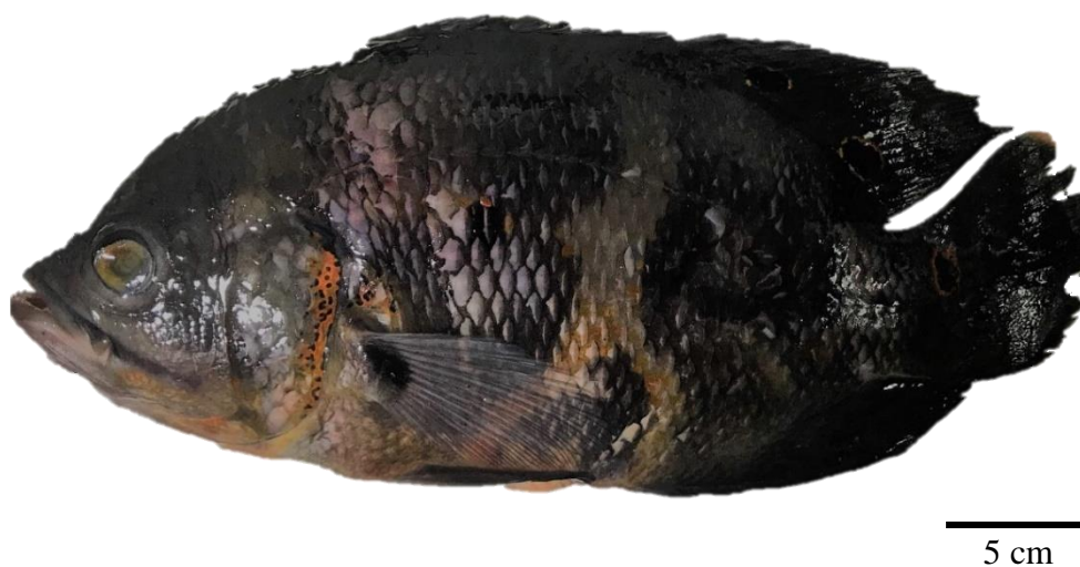
Figura 4: Astronotus crassipinnis (Heckel, 1840) (Cichliformes: Cichlidae), coletada do rio Jacaré-Pepira, sub-bacia do Tietê-Jacaré, Estado de São Paulo, Brasil.

A fauna parasitária de A. crassipinnis é relativamente pouco conhecida. Na Amazônia, foram registradas ao menos 15 espécies de metazoários parasitando peixes dessa espécie (Atroch, 2018; Santos et al., 2018). Na bacia do Tietê-Jacaré, um levantamento realizado nos rios Jacaré-Pepira e Jacaré-Guaçú por Januário et al. (2018) encontrou 15 espécies de metazoários, divididas em Monogenea, Digenea, Nematoda, Crustacea, Oligoqueta e Myxozoa.