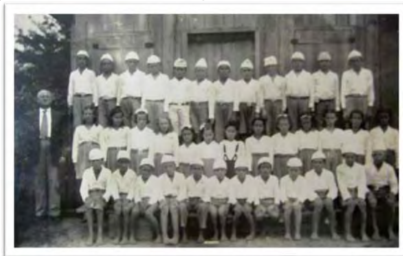
Imagem 13 - Escola Isolada Estadual Quebra Dentes. Bom Retiro - SC (1945)