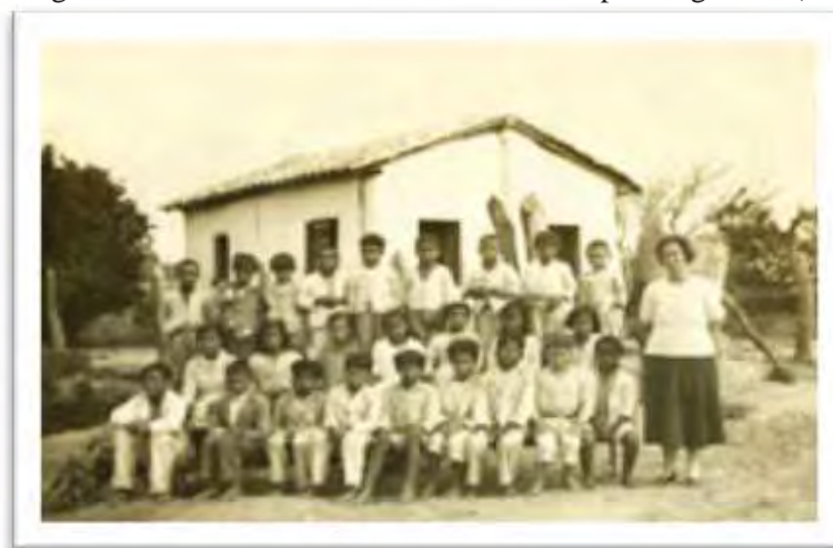
Imagem 3 - Escola do bairro da Boa Vista. Itapetininga - SP (1933)