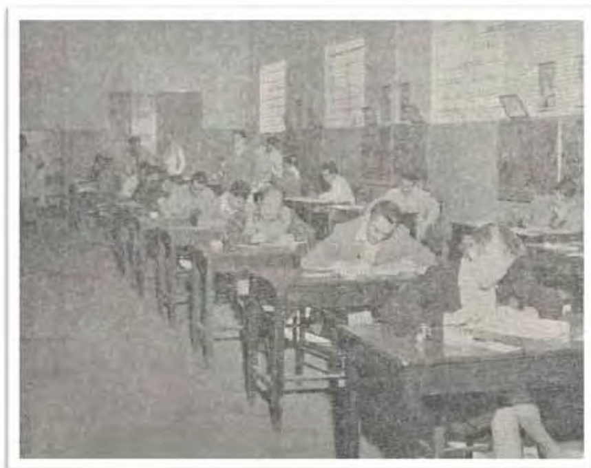
Imagem 22 - Curso de treinamento de educadores de base