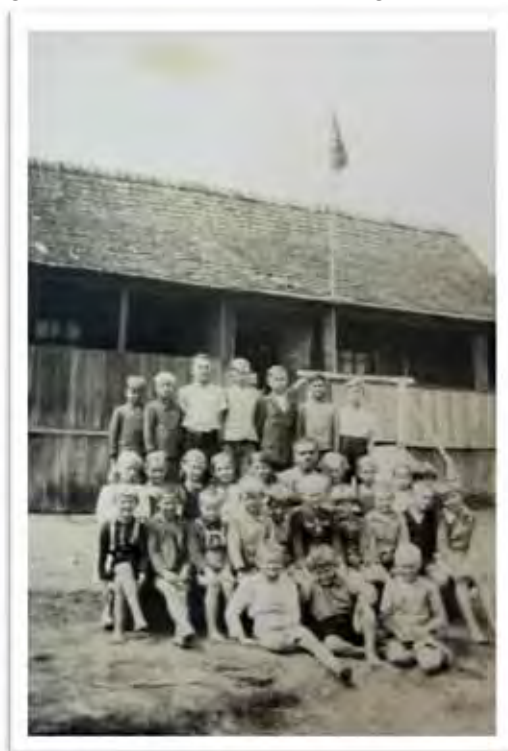
Imagem 8 - Escola Isolada. Araranguá - SC [1939]