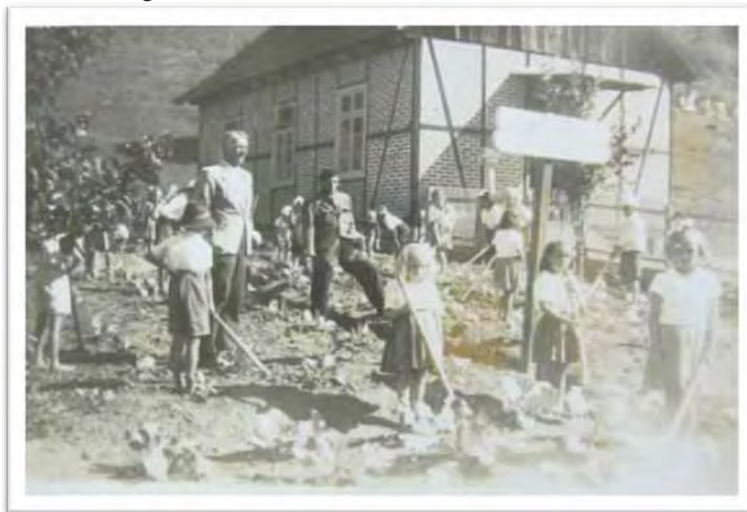
Imagem 19 - Escola Mista de Cedro Alto - SC [1947]