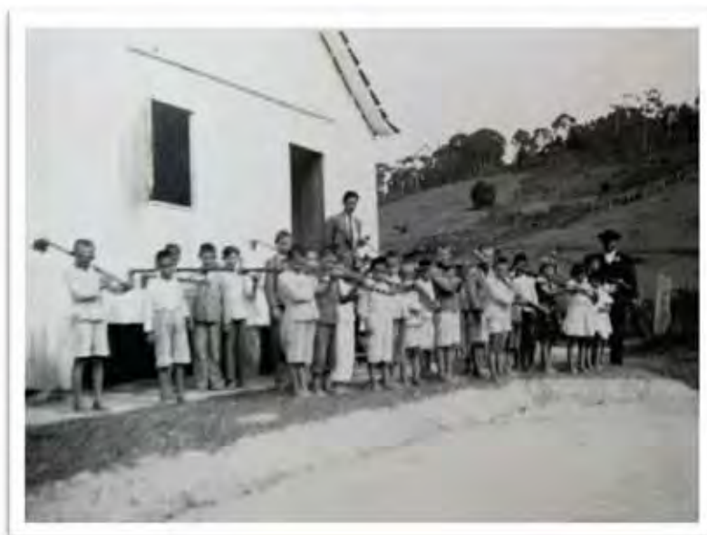
Imagem 14 - Escola Isolada sem identificação - SC [1945]