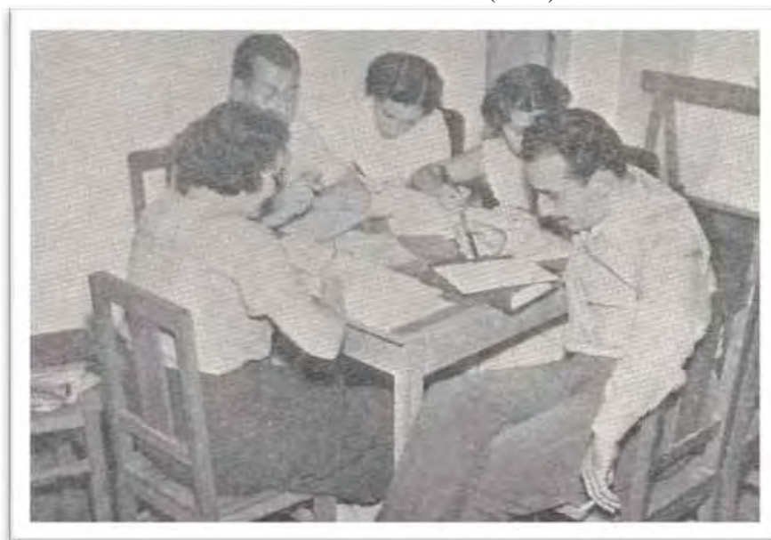
Imagem 21 - Uma equipe de técnicos-alunos discute os problemas encontrados em sua área de trabalho (1952)