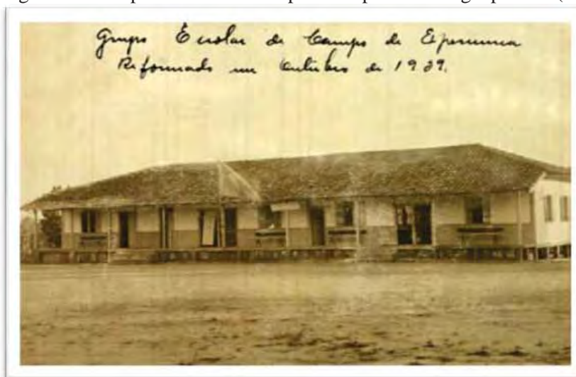
Imagem 10 - Grupo Escolar de Campo de Experiência. Iguape - SP (1941)