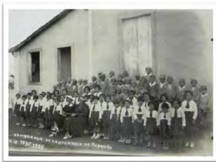
Imagem 4 - Escola de Tubarão - SC (1935-1936)