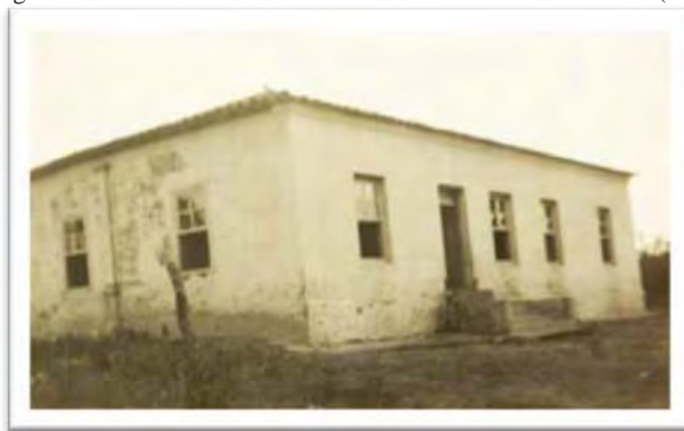
Imagem 2 - Escolas Reunidas de Bairrinhos. Rio das Pedras - SP (1923)