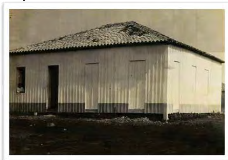
Imagem 7 - Prédio de escolas isoladas. São Carlos - SP (1942)