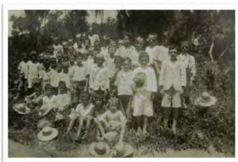
Imagem 15 - Alunos de Escola Isolada de Salto do Braço do Norte - SC [1945]