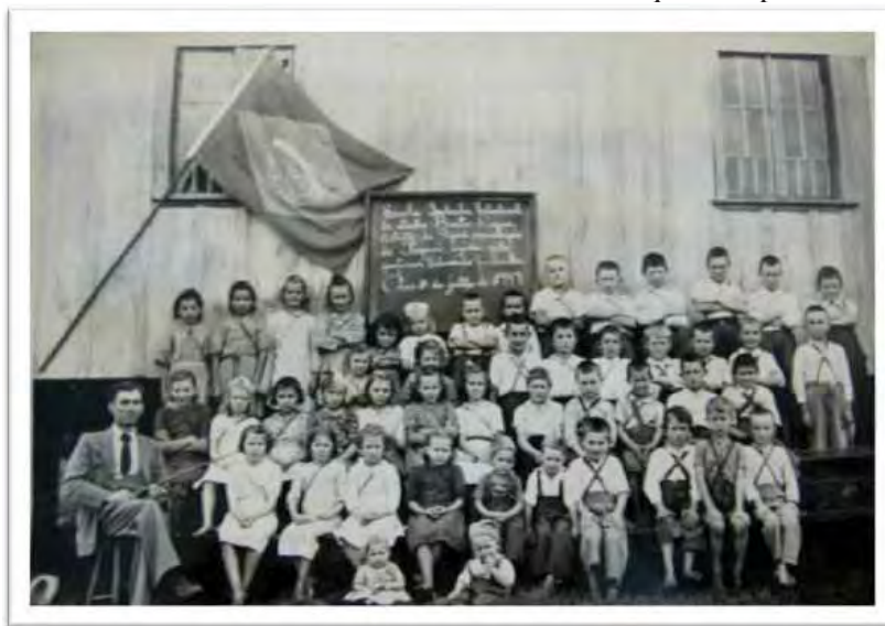
Imagem 16 - Escola Isolada Estadual de Linha Beato Roque. “Xapecó” - SC (1947)