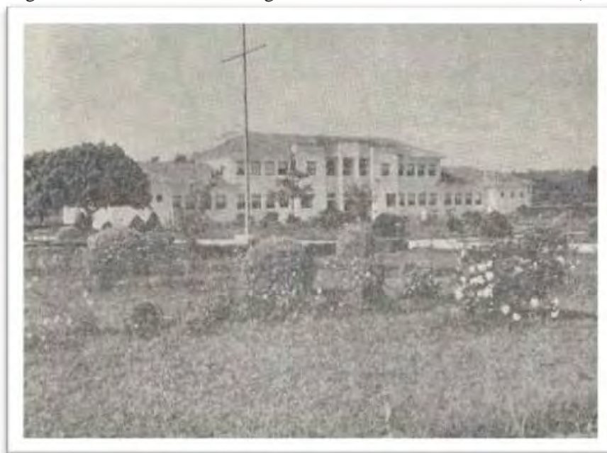
Imagem 23 - Escola Média de Agricultura de Florestal. Minas Gerais (1952)