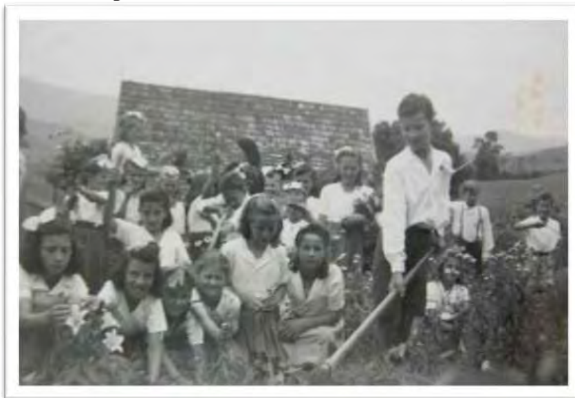
Imagem 18 - Escola Estadual de Ibirama - SC (1946)