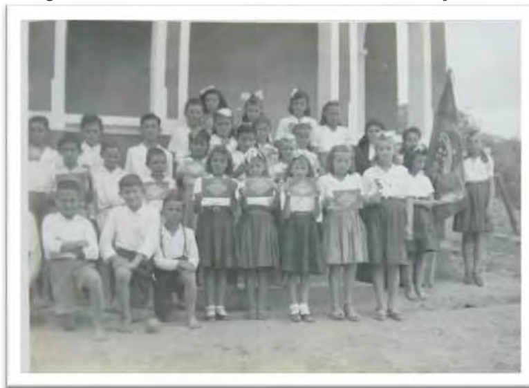
Imagem 12 - Escola Isolada Estadual sem identificação [1939]