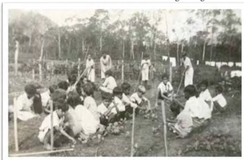
Imagem 11 - Escola de Mato Dentro Profa. Alice A. Camargo Rangel. Ubatuba - SP (1941)