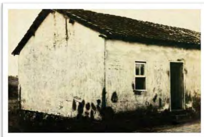
Imagem 5 - Prédio da Escola mista do bairro de Soturna. São Carlos - SP (1942)