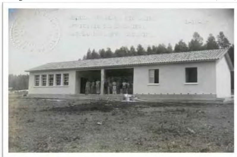
Imagem 20 - Escola Rural de Rio Maina. “Crisciuma” - SC (1947)