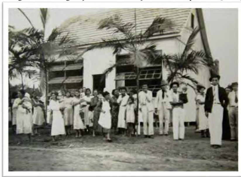
Imagem 17 - Inauguração Escola de Poço Fundo. Gaspar - SC [1947]