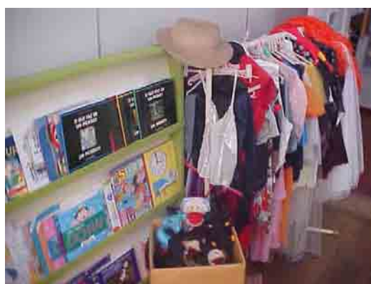
Figura 3: Fantoches e fantasias

Outro aspecto que merece destaque, na escolha do local, diz respeito ao fato de atuar como supervisora de estágio, na área de surdez, no CEES. Tal condição permitiu o bom andamento do trabalho, na medida em que conhecia toda a rotina administrativa do local, além de possuir uma estreita relação de confiança e amizade com os participantes deste estudo e seus respectivos familiares, construídas ao longo do desenvolvimento do trabalho de coleta. Gozando de uma maior autonomia para planejar as estratégias de leitura, sem que as crianças surdas, necessariamente, passassem pela apropriação da convenção grafo-fônica da língua portuguesa escrita, procurei valorizar a leitura como produção de sentidos, com base na modalidade escrita de linguagem dirigida para os olhos.