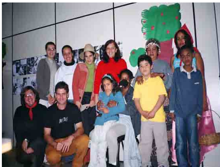
Figura 11: Promovendo trocas interlocutivas em Libras

Atualmente vem se destacando na educação dos surdos o desenvolvimento de programas bilíngües que enfatizam a apropriação da língua de sinais e a língua da comunidade majoritária (português), nas modalidades oral e