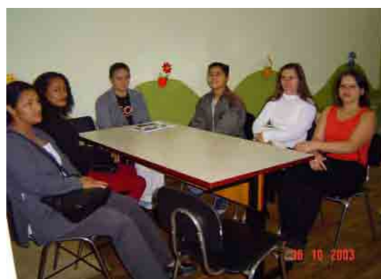
Figura 5: Reunião com os familiares dos participantes surdos