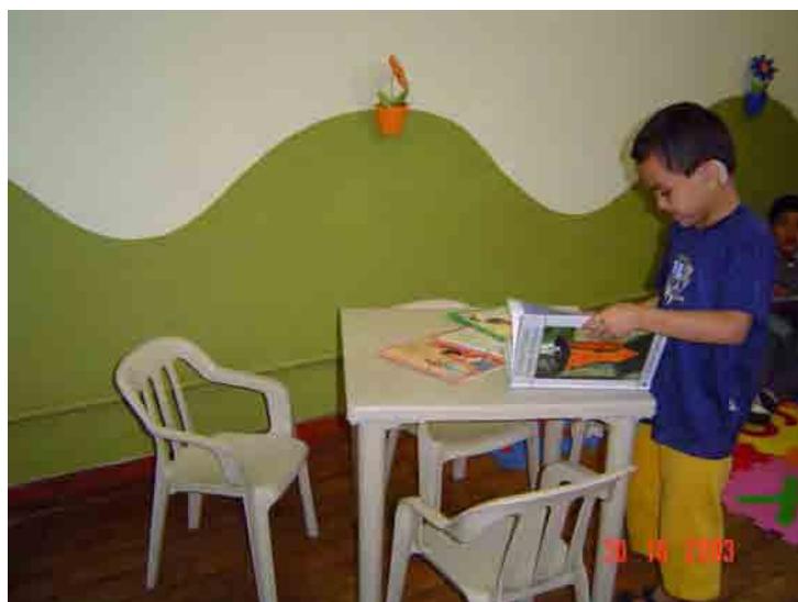
Figura 13. (Re)visitando uma história conhecida

Tais situações geralmente partiam do contexto de vida diária e do cotidiano escolar das crianças, envolvendo descobertas sobre o sentido do que estavam lendo. Para isso, as crianças foram motivadas a arriscarem-se na leitura de