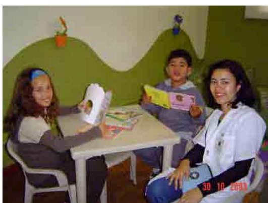
Figura 2. Lendo e se divertindo