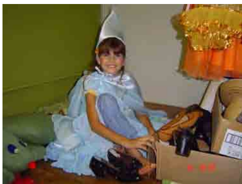
Figura 9: Preparando-se para dramatizar

Por conseguinte aos atendimentos dos participantes surdos, os familiares participavam de atividades interlocutivas em língua de sinais, compartilhando dos mesmos temas lingüísticos, trabalhados com as crianças. Assim, por meio da narrativa de histórias em LIBRAS, familiares e crianças vivenciaram fantasias, tensões e desejos, a partir de experiências e trocas interacionais em LIBRAS. Com base em atividades pedagógicas e lúdicas, exercitavam a criatividade e a imaginação, por intermédio de dramatizações, da manipulação de livros, de confecções de fantoches etc.