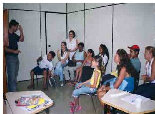
Figura 8: Vendo um filme no vídeo em Libras