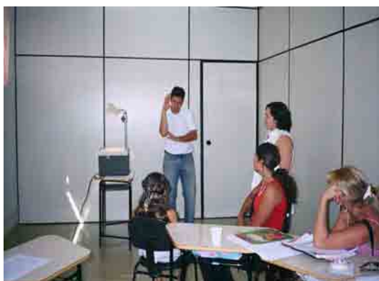
Figura 7: Dialogando em Libras