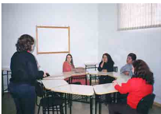
Figura 4: Orientação aos familiares na área da psicologia

Vale ressaltar que, na época, as expectativas dos familiares ainda recaíam sobre o desenvolvimento da oralidade, demonstrando uma forte resistência para a aceitação da Língua de Sinais, para seus filhos. Tal fato exigiu do projeto a organização de parcerias com os profissionais técnicos dos CEES, nas áreas do serviço social e da psicologia.