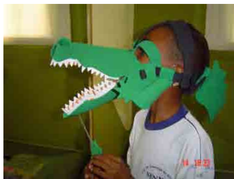
Figura 10: Interpretando uma história conhecida