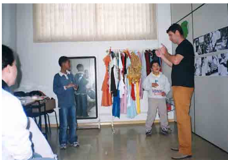
Figura 6: Instrutor surdo narrando uma história clássica da literatura infantil

Com a participação de um instrutor surdo de Libras, dois alunos bolsistas e duas professoras de classe especial, o projeto ofereceu oportunidades interlocutivas em Língua de Sinais aos participantes surdos deste estudo e seus respectivos familiares. Buscando criar um clima de descontração e aprendizagem, as narrativas versavam sobre as histórias infantis, narradas pelo instrutor surdo em língua de sinais, de maneira lúdica e criativa, a partir dos recursos dispostos na Biblioteca Interativa.