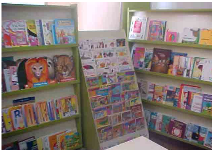
Figura 1. Estantes da Biblioteca Interativa

também disponibiliza uma arara com fantasias, adereços e fantoches, para desenvolvimento de atividades de dramatizações.