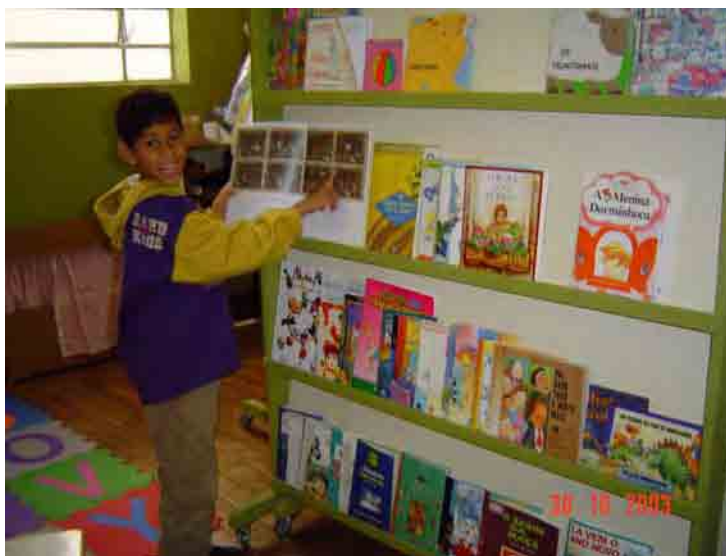
Figura 12: Procurando um material para ler

Assim sendo, explorando os recursos da Biblioteca Interativa, os encontros objetivaram envolver as crianças surdas em práticas de leitura discursivas.