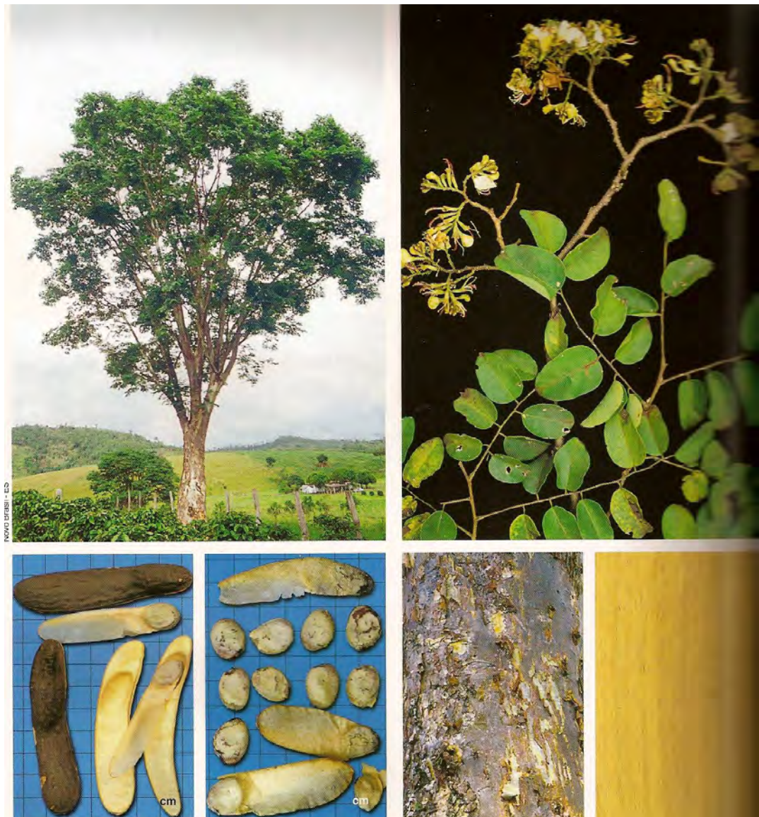
Figura 2. Amburana cearensis (Fr. All.) A.C. Smith popularmente conhecida como cumaru.

É uma árvore silvestre e sua vagem alada e quase preta, quando madura, contém uma semente achatada manchada de marrom e branca, oleaginosa, de cheiro forte cumarínico e agradável (Leal, 1995). A madeira é amplamente empregada em serviços de movelaria e marcenaria e as sementes, em função do odor agradável exalado, são utilizadas para perfumar roupas (Lorenzi, 1992). As sementes são utilizadas, ainda, na medicina caseira como antiespasmódicas, emenagogas e para o tratamento de doenças reumáticas (Tigre, 1968; Braga, 1976).