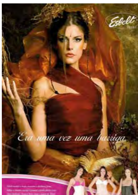
Figura 02: PP de cintas modeladoras

É certo que a estratégia valorizada na Peça Publicitária (PP) 1 não é regra para a maioria dos anúncios. Os apelos costumam se valer de astúcias, recursos linguísticos e imagéticos mais sutis; as tramas de significação são tecidas priorizando-se procedimentos que visam a despertar uma adesão mais positiva, menos impositiva. Numa formação discursiva como essa, permite-se o aparecimento de enunciados que incitam o prazer, o riso, a emoção e a surpresa no público rastreado. Quer dizer, buscam-se (re)estabelecer enunciados que não mais ordenam, mas tentam e seduzem. Os que não cumprem essa função são silenciados, até porque silenciamento e exposição são dois mecanismos que controlam os sentidos e as verdades. Comparemos a PP1 com a PP2 e a PP3.