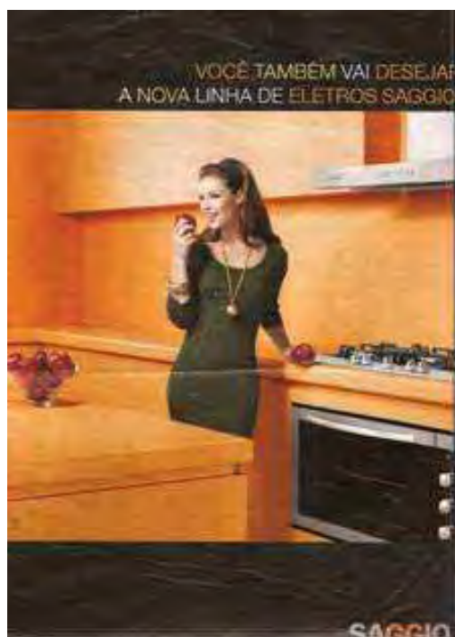
Figura 22: PP de eletrodoméstico

Todos reconhecem, quer dizer, a publicidade parte do princípio de que o público-alvo reconhece a maçã como o fruto proibido que, no drama relatado no Gênesis, deflagrou todo o circuito da sedução. É isso que justifica sua (re)aparição em um grande número de anúncios, possibilitando-me discutir os efeitos de sentido e de sujeito produzidos em peças que, ao (re)estabelecerem a maçã, cumprem as exigências dos estereótipos associados ao corpo feminino irresistível, porque sedutor como no começo . Para tanto, é necessário analisar o funcionamento em rede daquele enunciado, que circunscreve identidades de mulher tentadora. Tentação depreendida na regularidade das seguintes peças.