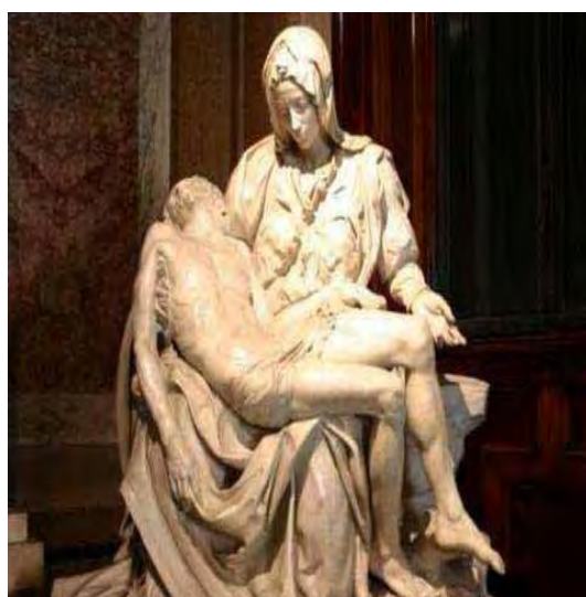
Figura 30: Pietà , de Michelângelo (1499).

Retomando e recriando esse momento de sofrimento da Nossa Senhora, particularmente o momento em que ela contempla o filho morto colocado no seu colo, Michelângelo esculpiu uma das obras mais famosas de todos os tempos, a Pietà (Piedade), em exposição na Basílica de São Pedro, no Vaticano.