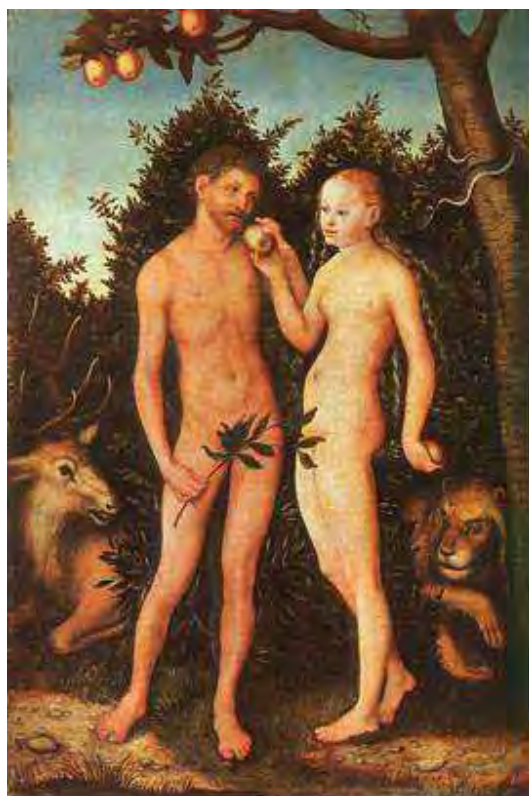
Figura 28: Adão e Eva, de Lucas Cranach (O velho) (1531). Fonte: < www.smb.spk-berlin.de >

Essa imagem, além de ajudar a rememorar a interpretação cristã a respeito da desobediência geradora de todo o mal, funciona discursivamente como efeito de imagem-matriz do movimento de intericonicidade que propiciou o acontecimento das peças publicitárias acolhidas. Mais do que isso: ao ser repetida, recitada em outras formulações, a imagem de Eva oferecendo o fruto a Adão funciona como uma memória visual, uma memória de uma imagem vista e lembrada. É dessa relação entre memória e imagem que se depreendem os movimentos de intericonicidade de que falam Courtine (apud MILANEZ, 2010), Gregolin (2008a) e Milanez (2006, 2010).