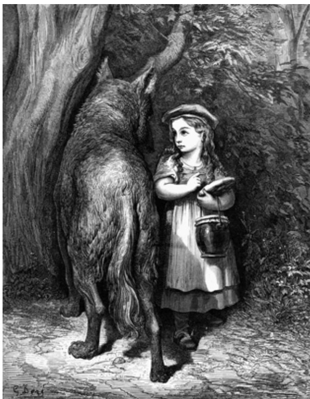
Figura 47: Chapeuzinho Vermelho, de Gustave Doré