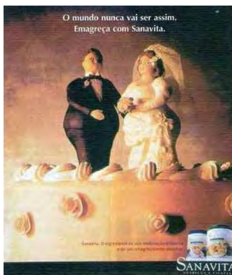
Figura 01: PP de produto para emagrecimento

emagreça com Sanavita , juntamente com a imagem centralizada de um casal gordo representando uma tradicional vela de bolo de casamento.