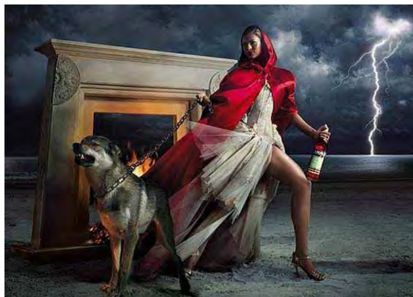
Figura 51: PP de bebida Fonte: < http://www.revistaquem.globo.com >. Acesso em 04/04/2008 57