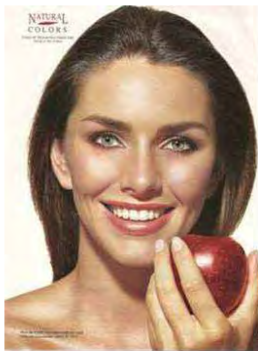
Figura 23: PP de tintura para cabelo