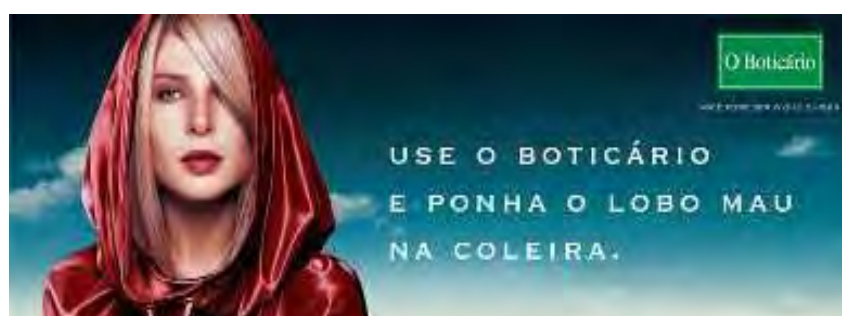
Figura 50: PP de cosméticos

Enfim, disciplinar os atos, traçar diretrizes para controlar os desejos e os comportamentos sexuais são, portanto, o alvo daquele discurso que se espalhou por toda parte e transformou-se em uma fonte inesgotável de inspiração para as publicidades que nos atingem hoje, a exemplo destas.