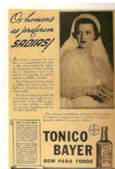
Figura 40: PP de medicamento 53

no papel que a sociedade [cristã] lhe reservou: a realização por meio do casamento” (MENDES, 2000, p.34). É evidente, igualmente, o fato de que isso pouco mudou aos olhos da publicidade.