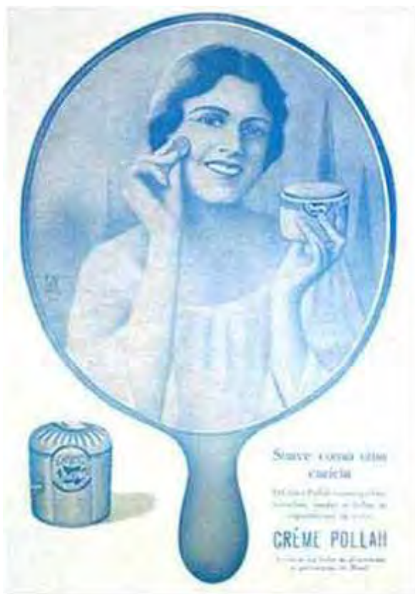
Figura 43: PP de creme para o rosto

Como disse acima, o espelho se inscreve numa rede de formulações que normatiza a posição da mulher desejante da eterna e insuperável beleza. Refletida nesse objeto mágico, há, na PP43, uma jovem, feliz, passando no rosto o produto anunciado. Trata-se de um creme cujas indicações estão explicitadas no texto verbal: Suave como uma carícia – o creme Pollah cura espinhas, manchas, sardas e todas as imperfeições da cutis. Seguramente, pouco mudou nos anúncios mais recentes, quando esses também visam a vender cremes para o rosto, ou mesmo quaisquer outros cosméticos e produtos que prometem eliminar imperfeições , para que, diante do espelho, a perfeição, incontornavelmente atrelada à juventude, seja reconhecida (admirada). Percebo nas ressonâncias desses anúncios um dos lugares comuns mais comuns do universo publicitário.