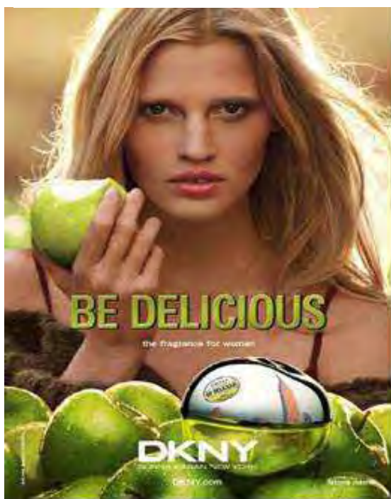
Figura 26: PP de perfume