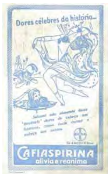
Figura 11: PP de medicamento

Na sequência, deparamo-nos com um terceiro e último modelo que ganha grande visibilidade e dizibilidade: a mulher sedutora e fatal.