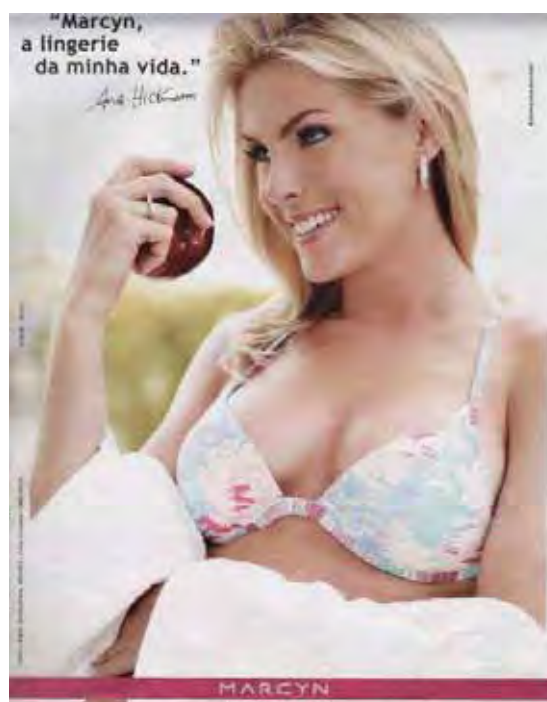
Figura 25: PP de lingerie