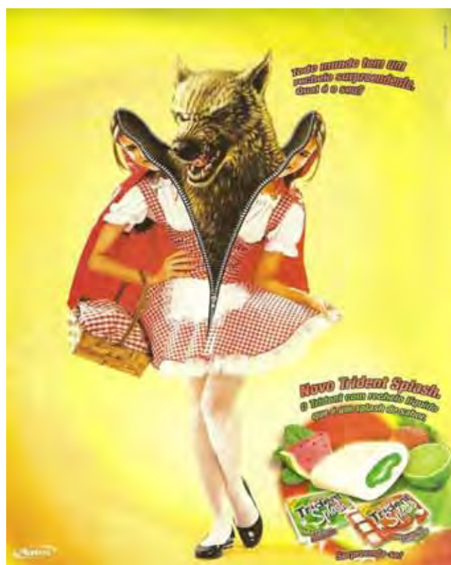
Figura 52: PP de goma de mascar

As formulações da peça seguinte propõem diferentes movimentações identitárias.