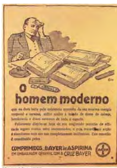
Figura 33: PP de medicamento 38

Essas considerações, no limite, corroboram as discussões que há algum tempo colocaram por terra a ideia de uma essência maternal. Mas há outro ponto sobre a questão da maternidade que merece aqui outras observações: é a relação desigual entre o sujeito-mãe e o sujeito-pai, reafirmando a normatividade dessa relação cuja força e veracidade atravessam o tempo e permanecem na atualidade dos acontecimentos das peças publicitárias. Digo isso, porque, o que é mais notável quando observadas as peças publicitárias que reatualizam a imagem e os implícitos da mãe devota, saturada de amor sublime, é a emergência de enunciados que repetem, numa nova retomada, a dialética segundo a qual os homens “pensam” e as mulheres “sentem”. É essa relação-separação que gostaria de destacar nas próximas peças.