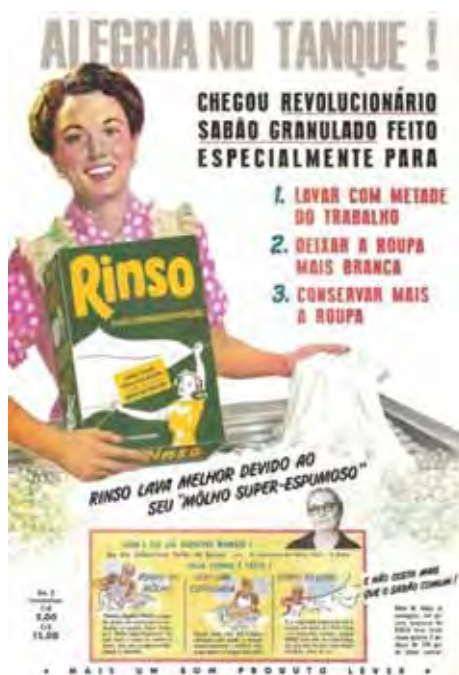
Figura 07: PP de sabão em pó