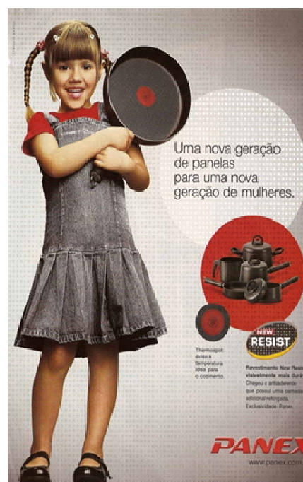
Figura 06: PP de panelas

A peça da Figura 5, com o objetivo de vender um carro para um público masculino, afirma: segurança, conforto, estabilidade. Tudo que uma mulher procura em um homem e um homem procura em um carro. Já a peça seguinte, interessada em vender panela para um público feminino assegura: uma nova geração de panelas para uma nova geração de mulheres. O que o desenvolvimento deste estudo tentará mostrar é que esses enunciados, muito longe de ser fruto de uma intenção do sujeito ou do acaso, só existem porque há uma relação indissociável entre discurso, sujeito e história. Quer dizer, sempre é bom reiterar o princípio teórico-metodológico basilar que sustenta todas as considerações a serem explanadas aqui: numa abordagem discursiva não se concebe um sujeito visto como fonte individual de um sentido que lhe seria transparente.