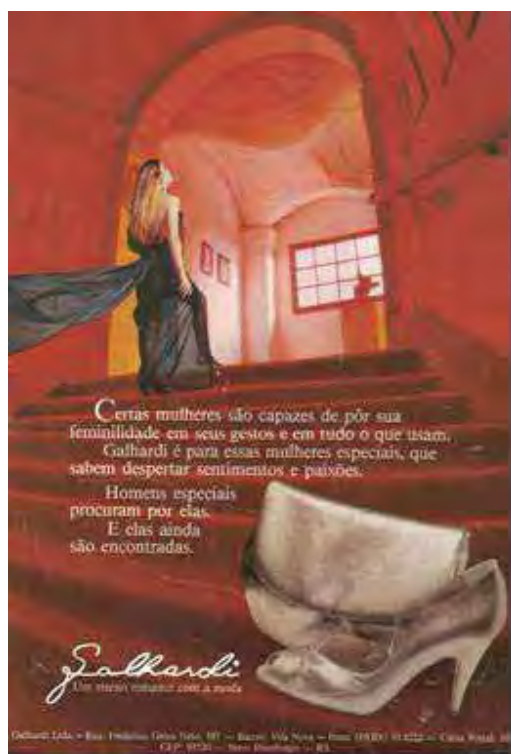
Figura 21: PP de sapato e bolsa

Milanez (2006, 2010) explica que os movimentos de intericonicidade dizem respeito ao fato de que as imagens carregam traços e memórias de outras imagens que se estabelecem por meio de repetições portadoras de novos acontecimentos imagéticos. É possível constatar como se dão esses movimentos, a partir das imagens que constituem a propaganda a seguir.