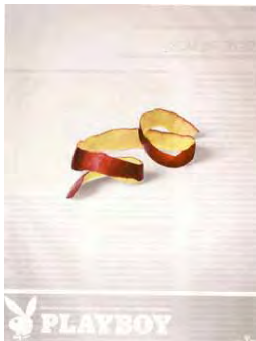
Figura 29: PP de revista

Mantendo-me na mesma linha de análise, quero apresentar outra peça que possibilitará aclarar ainda mais essa identificação.