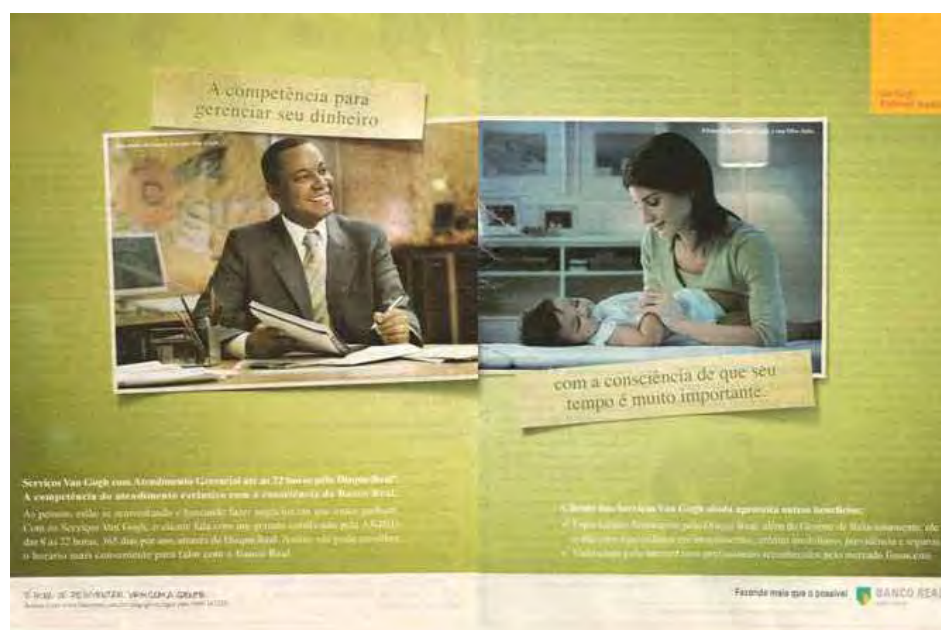
Figura 35: PP de banco