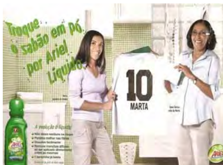
Figura 08: PP de sabão líquido

Se examinadas as peças em retrospecto, bem sabemos que lavar roupas, cozinhar, cuidar de filhos, marido, manter a casa organizada em todos os aspectos e ser feliz realizando todas essas atividades não corresponde exatamente às práticas cotidianas de uma dona de casa, quer na atualidade, quer nos tempos antigos. Entretanto, se atentarmos especificamente para as protagonistas das PP7 e PP8, percebemos que é nítida a alegria daquelas mulheres no tanque (ou na máquina de lavar, no caso da peça atual), alegria expressa na formulação linguística da PP antiga e nas expressões faciais de todas aquelas mulheres. Observe-se, também, que a alegria de que falam refere-se à mesma novidade, pois, na primeira, houve a substituição do sabão em pedra pelo sabão em pó, e, na segunda, a do sabão em pó pelo sabão líquido. Mais de quarenta anos separam essas peças, anos esses marcados por deslocamentos importantes e marcantes na história das mulheres, abrindo-lhes condições de construir novos espaços sociais e novas condições subjetivas. Entretanto, em peças como as destacadas, elas permanecem sedimentadas na lavanderia (ou na cozinha, sala, enfim, no espaço doméstico).