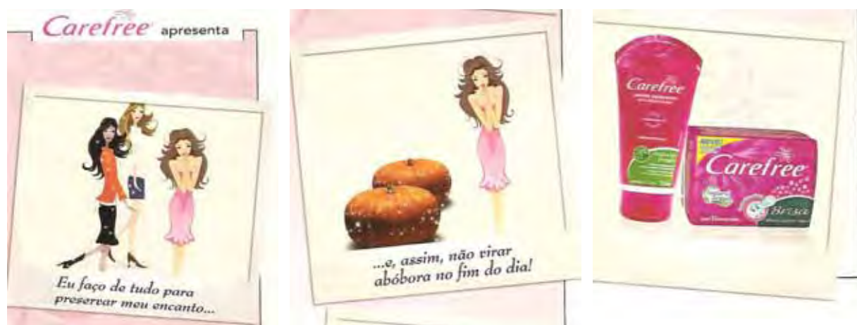
Figura 19: PP de absorvente íntimo e sabonete

Some-se a isso o fato de ser uma peça construída a partir de uma relação intertextual (de uma intericonicidade, na verdade 28 ) com os contos de fadas, requisitando a imagem de uma princesa com atitude meiga(?), delicada(?), angelical(?), dessexualizada, sem dúvidas, tal como se espera de uma Cinderela, por exemplo. Mais que isso, de uma Cinderela espera-se que ela seja loira, muito bonita, jovem, ingênua, tolerante, submissa, obediente, generosa, paciente, conformada com a situação de sofrimento a que era submetida. À menina/mulher, porque, assim como a princesa, possui tais características e coloca-as à disposição de um homem capaz de reconhecê-las, é concedido um final feliz. Estão aí enredados os discursos milenares da submissão da mulher, com os quais os sentidos da peça 18 se ajustam, reiterando um de maiores estigmas da identidade do feminino: a fragilidade. Relações semelhantes constituem a peça seguinte.