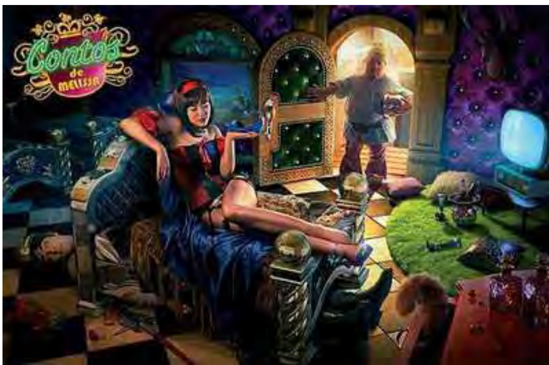
Figura 39: PP de sapato

São percursos e percalços que atualizam os desafios da mítica Psiquê e ambas, Branca de Neve e a amada do cupido, constituem parte importante da memória requisitada nas formulações e reformulações (parafrásticas e polissêmicas) dos discursos sobre o ser mulher na opacidade da peça 39. Antes de qualquer coisa, resalte-se que a persuasão dessa peça incita movimentos de leitura e compreensão, que precisam levar em conta a intericonicidade que faz trabalhar a memória daquelas princesas, provocando deslizamentos da tradição (GREGOLIN, 2008a) e rupturas com os sentidos fundantes, aqueles que constituem o espaço do repetível/legível.