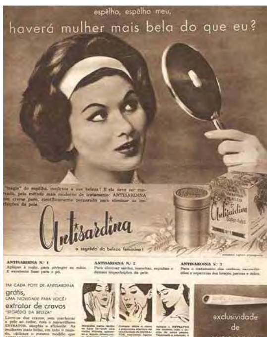
Figura 44: PP de creme para o rosto