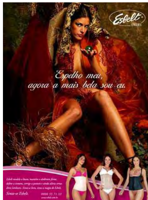
Figura 45: PP de cintas modeladoras

Ao bater o olho na antiga PP44, o leitor se depara de novo com a imagem de um rosto de mulher, contemplando um espelho ao qual dirige a clássica pergunta: espelho, espelho meu... haverá mulher mais bela do que eu. Logo abaixo, esclarecem-se as características do produto anunciado nos seguintes termos: A magia do espelho confirma sua beleza: e ela deve ser conservada com o método mais moderno de tratamento: ANTISARDINA é um creme puro, cientificamente preparado para eliminar as imperfeições da pele. [...] ANTISARDINA, o segredo da beleza feminina. Movimentando o olhar para a PP45, vê, mais uma vez, uma mulher jovem, em destaque no primeiro plano, mas agora ela está com uma postura diferente, não se mira no espelho, tampouco lhe faz aquela pergunta; ela, na verdade, já traz a constatação/resposta: espelho meu, agora a mais bela sou eu. Sobre o produto, anuncia-se: Esbelt modela o busto, mantém o abdômen firme, define a cintura, corrige a postura e ainda alivia certas dores lombares. Sinta-se bem, sinta a magia de Esbelt. Sinta-se Esbelt. No canto inferior, três outras imagens de mulheres são destacadas.