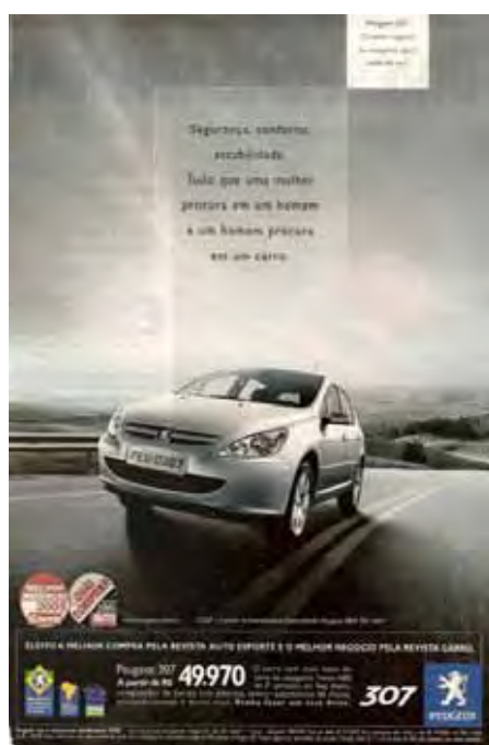
Figura 05: PP de carro

E na contemporaneidade, com o tempo já deslocado, como os sentidos concretos e explosivos dos movimentos de emancipação da mulher são (re)significados nas peças publicitárias que circulam na mídia de hoje? Mantendo-me no mesmo tema com relação à venda de carro e ao lugar social de ambos os sexos, trago dois exemplos para fechar esta discussão.