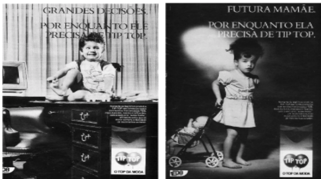
Figura 36: PP de roupas infantis

Novamente, escritaninha de um lado e bebê (boneca) de outro. Novamente, as grandes decisões são para o futuro (e feliz) homem, assim como os cuidados dos filhos são para a futura (e assustada) mamãe . Nenhuma válvula de escape é possível, na medida em que não há espaço nessas memórias de outros tempos, ainda vivas, para outras identificações.