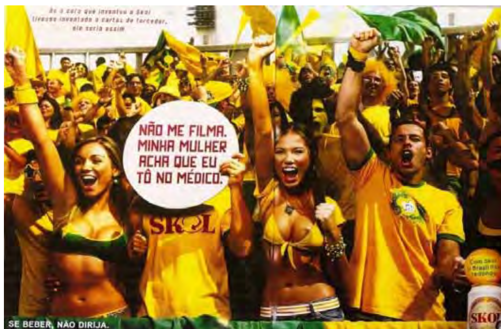
Figura 37: PP de cerveja

Essa propaganda de cerveja circulou por ocasião dos jogos de futebol da copa do mundo de 2006, simulando um momento de exaltação da torcida brasileira. De início, não dá para deixar de destacar dois pontos: primeiro, em se tratando de uma publicidade de cerveja, o público-alvo é constituído por homens adultos, pois são raras as propagandas que partem do princípio de que mulher também toma cerveja; segundo, essa propaganda apareceu na revista Playboy que, como já foi dito, destina-se a um público igualmente adulto e masculino. Os sentidos ali engendrados atendem, portanto, basicamente esse controle.