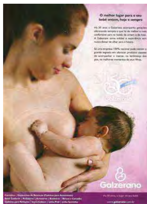
Figura 32: PP de produtos para bebê

Quando nasce um bebê, nasce uma mãe; O melhor lugar para o seu bebê ontem, hoje e sempre. Essas formulações linguísticas, juntamente com imagens de mulheres jovens acolhendo seus bebês, ora sobre o peito e o ventre, dando a entender que ele está dormindo tranquilamente, porque protegido; ora nos braços para amamentá-lo, posição que, hoje, é consagrada como um perfeito ato de amor, recuperam a imagem materna daquela Pietà , consagrada como símbolo cristão, que, igualmente, acolhe seu filho nos braços. No acontecimento discursivo das peças, portanto, atualiza-se uma imagem portadora de memórias de outra(s) imagem(s) (MILANEZ, 2006; 2010), e é nessa relação e na espessura histórica do