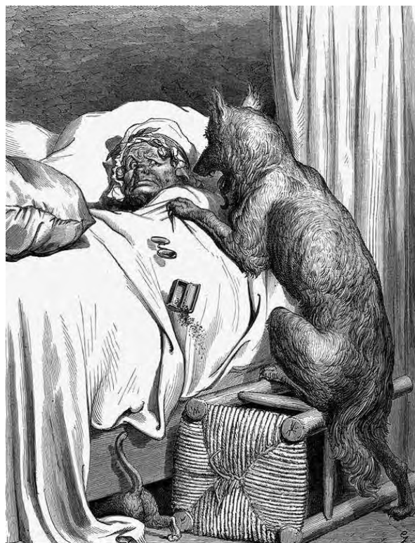
Figura 48: Chapeuzinho Vermelho, de Gustave Doré