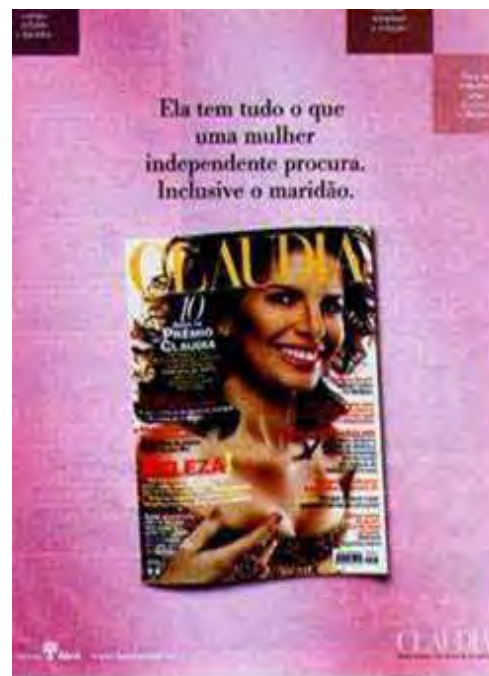
Figura 42: PP de revista