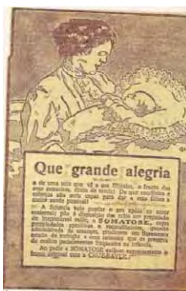
Figura 34: PP de medicamento 39

O homem moderno que na dura luta pela existência necessita as sua máxima energia corporal e nervosa, sofre muito a [ilegível] (...) Que grande alegria a de uma mãe que vê o seu filhinho, o fruto das suas entranhas, cheio de saúde! De que sacrifícios e esforços não seria capaz para dar a seus filhos a maior saúde possível! (...)