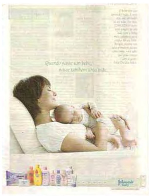
Figura 31: PP de produtos para bebê

Diferentemente de outras Pietás , a piedosa do pintor e escultor italiano é jovem e serena, revelando, ao que parece, a imagem de uma mãe escolhida por Deus, que entende e aceita o fato de que o sofrimento de seu filho era uma vontade de Deus e precisou morrer para poder salvar a todos nós. Nobre resignação que, pela via da memória, inscreve-se na ordem do imaginário, pelo simbólico, atualizando-se no funcionamento do interdiscurso e da intericonicidade conforme se observa nas materialidades destas peças.