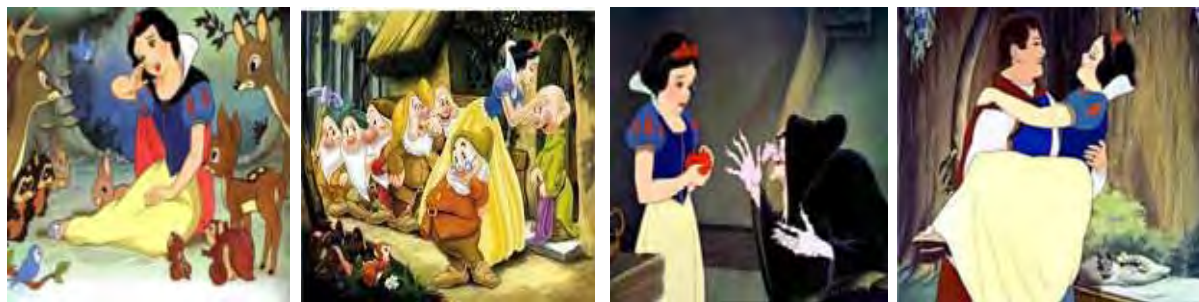
Figura 38: Branca de Neve e os sete anões

Para deixar mais claro de que imagem se trata, reproduzo algumas cenas do filme.