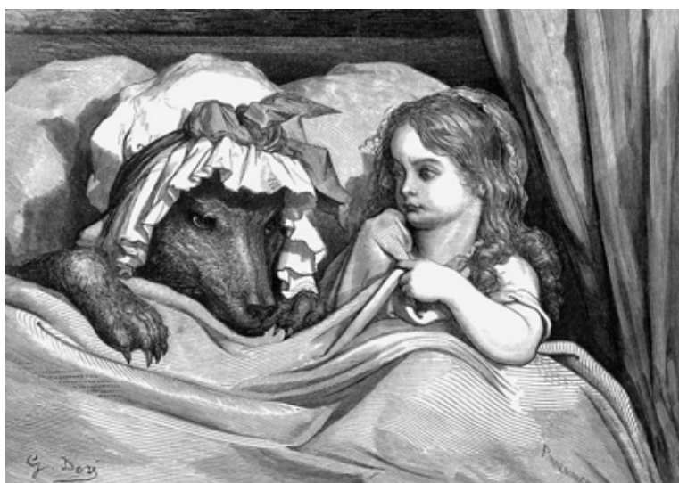
Figura 49: Chapeuzinho Vermelho, de Gustave Doré