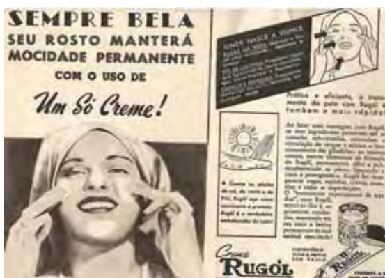
Figura 09: PP de creme para o rosto

Um segundo modelo a ser destacado é o de mulheres eternamente belas, porque jovens.