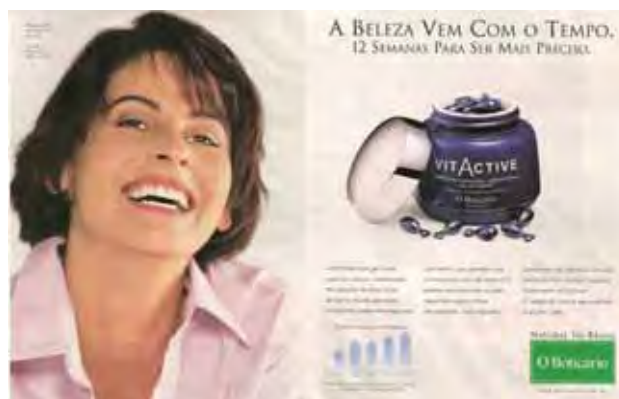
Figura 10: PP de creme para o rosto

Ligadas às normas e valores estéticos fixados no imaginário social, essas peças focalizam de forma muito semelhante o rosto jovem feminino inscrito num jogo discursivo que também reforça o mesmo: sempre bela; seu rosto manterá mocidade permanente (PP9); A beleza vem com o tempo [...] reduzindo rugas e linhas de expressão (PP10) . Diante dessas peças, deparamo-nos com um discurso que fala de uma “beleza imortal”, para usar a expressão de Vigarello (2005), cujos contornos marcam as exigências sociais, culturais e históricas da noção do ser belo na contemporaneidade. Nas palavras irônicas de Del Priore (2000) sobre tais exigências, lemos que o corpo da mulher de um modo geral, e o seu rosto de um modo particular, no decurso do século XX, precisou se cobrir de cremes (além de vitaminas, colágenos etc.), para conseguir ir ao encontro dos padrões que foram inventados. A ordem, pelo menos nos últimos 50 anos, é manter a pele sempre “tonificada, alisada, limpa”, apresentada idealmente, sobretudo pela publicidade como uma nova forma de vestimenta, “que não enruga e não ‘amassa’ jamais” (p.11).