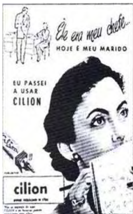
Figura 41: PP de creme para os olhos

Por isto as moças em edade de casar tratam com carinho da propria saude: se lhes falta o appetite, se estão pallidas e debilitadas recorrem immediatamente ao TONICO BAYER. [...]