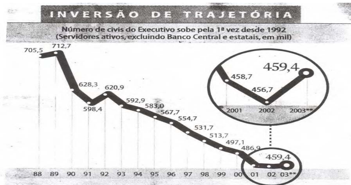
Figura 01 - Inversão de trajetória no número de servidores civis do Executivo