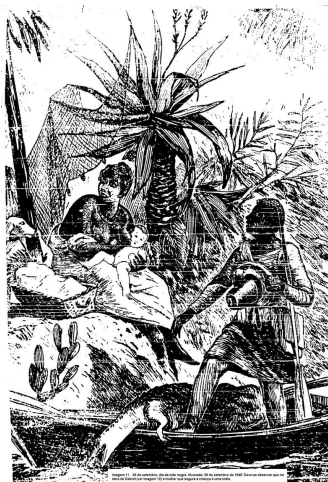
Imagem 2 – 28 de setembro, dia da mãe negra. Capa do jornal Alvorada , São Paulo, 28 de setembro de 1946

A figura que evocamos hoje nesta pequena consagração – a maior que lhe podemos dar, representa uma argamassa da formação histórica da nacionalidade brasileira , uma das suas maiores fontes inspiradoras do seu destino. Apesar de não haver ainda o povo brasileiro dado o testemunho público do reconhecimento à “Mãe Negra” – aquela que se eternizou no curvato de suas cantigas e na influência humilde de sua dolorosa procedência, nacionalmente falando – nós lhe reivindicamos toda a grandeza sentimental que é a razão poderosa de nossa maior afania. [...] Queremos e devemos erguê-la, por um monumento , do esquecimento injusto; e nós, os negros brasileiros, neste instante que passa, nesta hora aflitiva e de tanta incerteza, devemos elevar os nossos pensamentos e nossos olhos para bem alto, para que dessa veneração desçam sobre nós as bênçãos daquela a quem pedimos que ilumine o nosso caminho 16 .