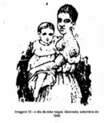
Imagem 10 - o dia da mãe negra. Alvorada, setembro de 1945.

foi duplamente sofredora pelas duas maternidades: a das entranhas que gerava o escravo e a do leite que amamentava o senhor”. Sofreu mais do que a simples mãe de filhos sem liberdade, confundida com o fruto da sua carne, amargura lenta e secreta dos senhores sem defesa. Sofreu porque amava também o opressor 12 .