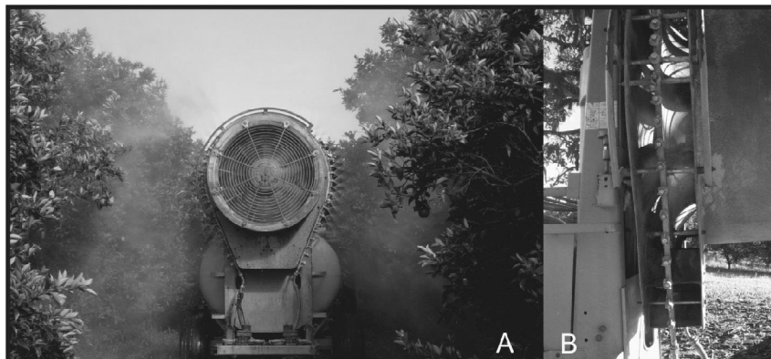
Figura 1. Pulverizador (Arbus 2000/Export – A) equipado com ramal especial de bicos (B) para as pulverizações visando o controle da MPC (Mogi Guaçu/SP).