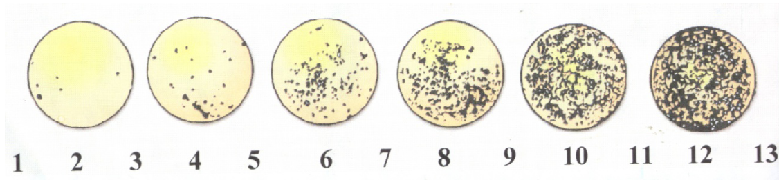
Figura 2. Escala diagramática adaptada de Spósito et al. (2004), para avaliação em campo da severidade da MPC ( Guignardia citricarpa ) em frutos cítricos ( Citrus spp.).