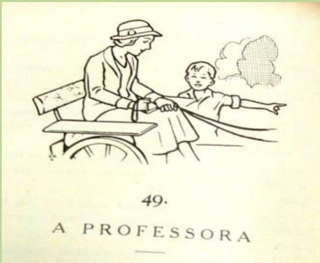
Gravura 1 - ANDRADE, Thales Castanho de. Vida na roça . São Paulo: Companhia Editora Nacional, 1933.

O acesso às escolas rurais não era bom. Apesar de haver uma estrada para chegar à escola situada num sítio, era difícil o caminho: “Na falta de veículo qualquer pessoa pode fazer esse percurso em 30 ou 40 minutos a pé” ( Revista de Educação , 1936, p. 190). Outro aspecto destacado é o trabalho coletivo: a professora ensinava o estudo e tratamento das abelhas e das colméias, enquanto os alunos, prazerosamente, a ajudavam. Além dos trabalhos na agricultura e na apicultura, há os trabalhos manuais com a preocupação da orientação utilitária do que é feito pelos alunos.