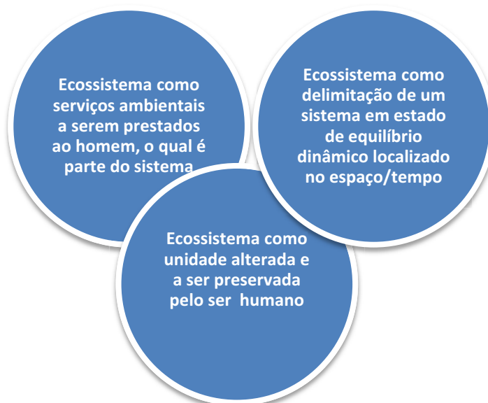
Figura 2 – Representação da articulação entre os núcleos de significação e a complementaridade das ideologias que os constituem.