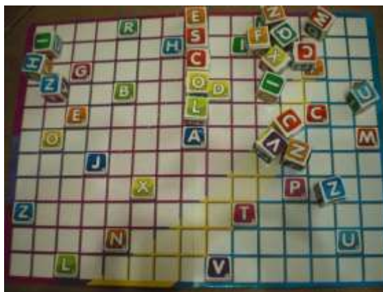
Imagem 1: Registro do tabuleiro e dados utilizados, escrito ilustrativamente a palavra escola.

Tanto em 2011 quanto em 2012 foram seguidos os mesmos procedimentos para agendar as entrevistas com os sujeitos. Sendo que todas foram gravadas em gravador digital e transcritas de forma integral, com o auxílio do software gratuito Express Scribe.