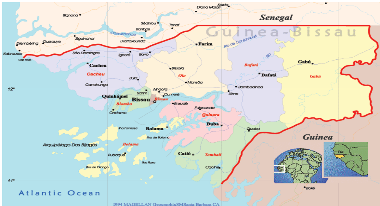
Figural-Mapa da Republica da Guiné-Bissau

A Guiné-Bissau fica situada na costa ocidental da África, com um território de 36.125km 2 , faz fronteira a norte com o Senegal, a este e sudeste com Guiné-Conacri, e a sul e oeste com o oceano Atlântico. Além do território continental, integra ainda mais de oitenta ilhas que constituem o Arquipélago dos Bijagos.