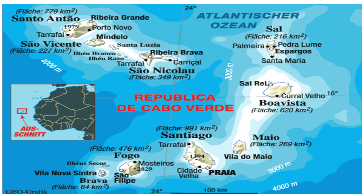
Figura 2 – Mapa da Republica de Cabo Verde

As ilhas do barlavento 1 são: Santo Antão, São Vicente, Santa Luzia, São Nicolau, Sal, Boavista e os Ilhéus Raso e Branco, e as ilhas do sotavento 2 , constituídas por Maio, Fogo, Brava, Santiago, e os ilhéus Luis Carreira, Grande e Cima.