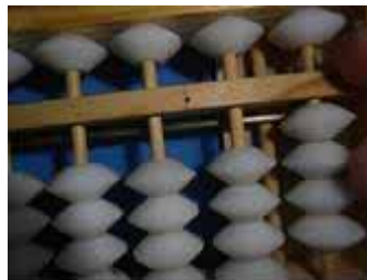
Figura 41: Subtrai-se 4, acrescentando 4 itidamas com o polegar e removendo a godama com o indicador. O resto é 4.