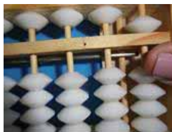
Figura 27: Acrescentar 5 com indicador e remover 1 com o mesmo dedo