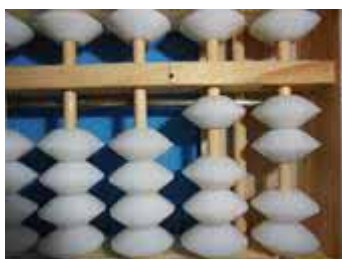
Figura 50: Número 12

Para o segundo membro da igualdade: 2.(3.4) = 2.12 = 24