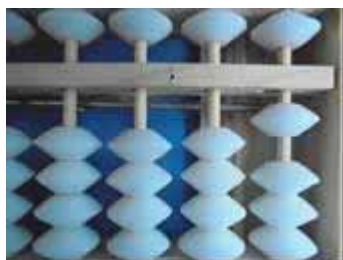
Figura 28: Número 1