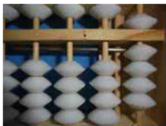
Figura 32: Número 9