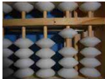
Figura 11: Número 10, sucessor de 9