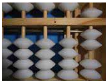
Figura 18: Soma 3+4