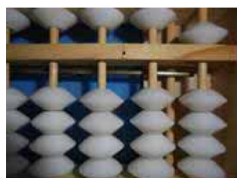
Figura 8: Número 5, sucessor de 4