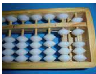
Figura 53: Número 16