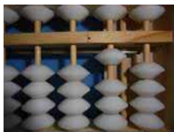
Figura 42: Número 10