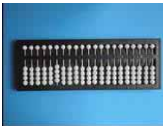
Figura 2: soroban para deficiente visual

Secretaria de Educação Especial do Estado de São Paulo - SEESP em parceria com o Ministério da Educação e Cultura - MEC é composto por 21 eixos e 7 classes conforme Figura 2.