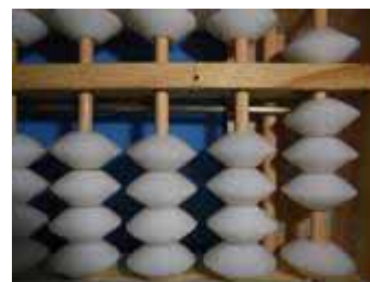
Figura 19: Soma 7+1

Exemplo da propriedade comutativa da adição.