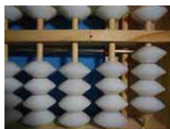
Figura 7: Número 4, sucessor de 3