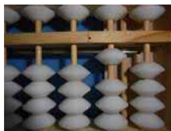
Figura 45: Número 10

Para o segundo membro da igualdade: 5 \cdot 2 = 10