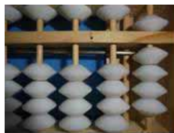
Figura 23: Número 9