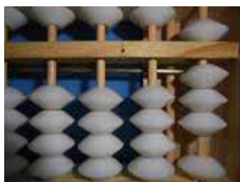
Figura 52: Número 8