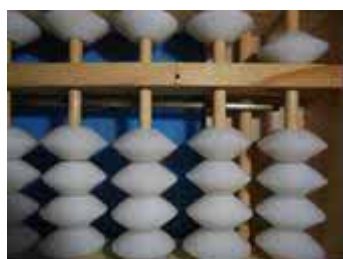
Figura 46: Número 5

Para o segundo membro da igualdade: 5 \cdot 2 = 10