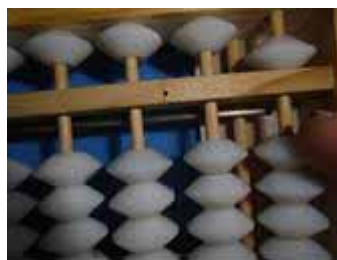
Figura 33: Subtrai-se 4 unidades, removendo o 4 com o indicador. O resto é 5

Considerando-se que o minuendo já se encontra no soroban, a subtração de godamas (contas de valor 5 do soroban) correspondentes ao valor do subtraendo efetua-se sempre com o indicador.