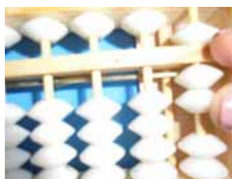
Figura 29: Acrescenta-se 5 com indicador e 1 com o polegar simultaneamente