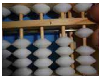
Figura 43: Subtrai-se 9 unidades, removendo a itidama (dezena) com o indicador e acrescentando uma itidama com o polegar. O resto é 1.