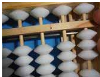
Figura 39: Acrescentam-se 2 itidamas com o polegar e remove-se a godama com o indicador. O resto é 3.

Considerando-se que o minuendo já se encontra no soroban, quando ocorrer: