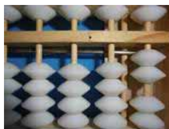
Figura 5: Número 2, sucessor de 1