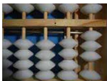
Figura 6: Número 3, sucessor de 2