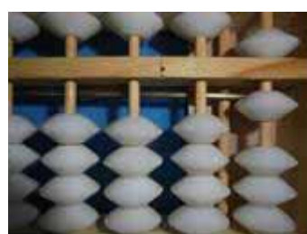
Figura 9: Número 6, sucessor de 5