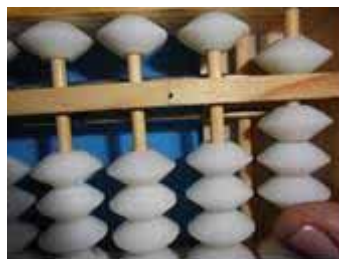
Figura 25: Somam-se 2 itidamas com o polegar