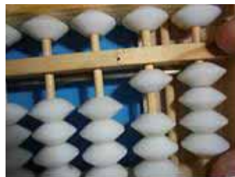
Figura 31: Para adicionar 6, acrescenta-se 1 com o polegar, remove-se imediatamente a godama com o indicador e em seguida coloca-se 1 na keta à esquerda com polegar

Para os casos em que não há contas suficientes para se acrescentar na mesma haste, recorre-se à tabuada completa do 10. Assim: