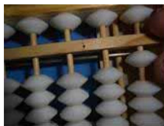
Figura 37: Subtrai-se 8, removendo primeiro três itidamas com o indicador e depois 1 godama com o mesmo dedo. O resto é 1.

Considerando-se que o minuendo já se encontra no soroban, todas as vezes que a godama (conta de valor 5) estiver próxima do hari (travessa que divide a parte superior da inferior) e desejar-se subtrair 4, 3, 2 ou 1, acrescenta-se com o polegar tantas itidamas (contas de valor 1) quantas forem necessárias (a quantidade que somada ao subtraendo complete 5), e em seguida remove-se com o indicador a godama.