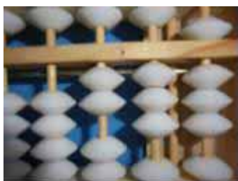
Figura 12: Número 238, sucessor de 237