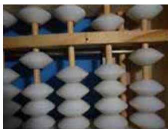
Figura 13: Número 1051, sucessor de 1050

No sistema decimal, todo número é representado por uma sequência formada pelos algarismos 1 até 9 acrescidos do símbolo 0 (zero). Esse sistema é também denominado posicional, pois cada algarismo possui um valor posicional ou também chamado de relativo. (HEFEZ, 2011, p.43)