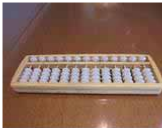
Figura 1: soroban

ainda, num terceiro momento: surpresa em comprovar conhecimentos prévios ao utilizar o soroban como material concreto (Figura 1).