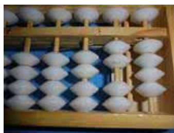
Figura 51: Número 24

Exemplo da propriedade distributiva da multiplicação, em relação da adição no Soroban.