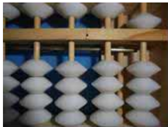
Figura 40: Número 5