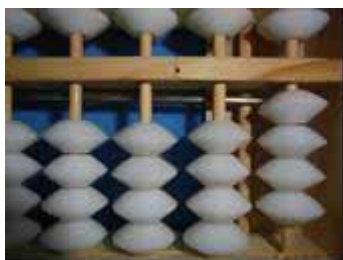
Figura 14: Número 4

Para o primeiro membro da igualdade: 3+(4+1) = 3+5 = 8