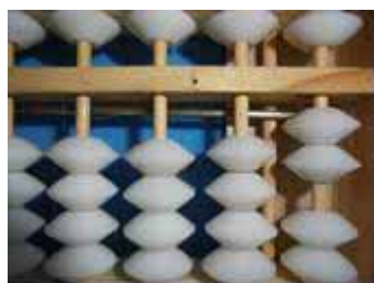
Figura 44: Número 2

Para o primeiro membro da igualdade: 2 \cdot 5 = 10