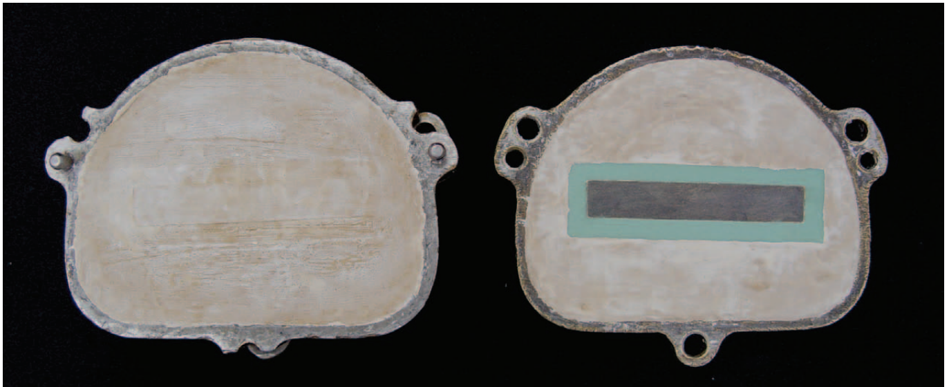
Figura 1. Conjunto silicone/padrão metálico incluído individualmente em mufla metálica.

colocada no interior do silicone previamente incluído em mufla metálica para posterior prensagem.