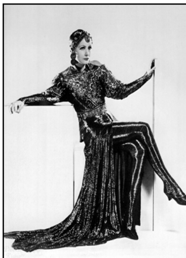
Figura 05 – Greta Garbo como Mata Hari (1931).