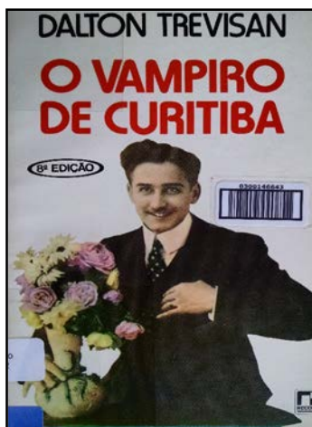
Figura 02 – Capa da oitava edição de O Vampiro de Curitiba . Desde a sua segunda edição, é a imagem deste distinto cavalheiro, um verdadeiro “homem de família”, que passa a estampar o livro. Rebaixado pela pena de Dalton Trevisan, o vampiro abandona a capa e assume o terno e a gravata.