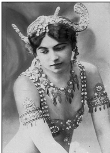
Figura 04 – A dançarina Mata Hari.