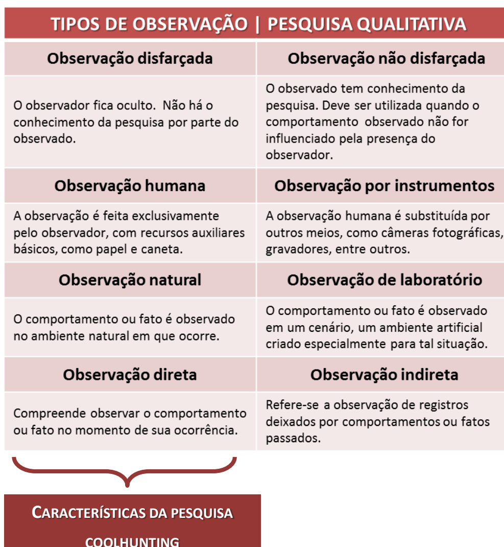
Figura 1 - Quadro esquemático sobre a tipologia da observação