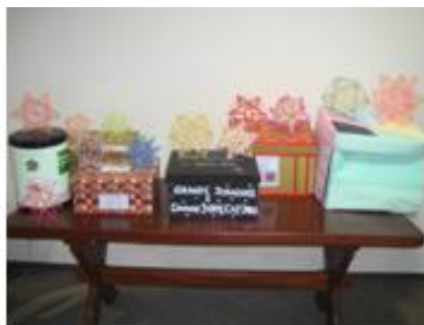
Figura 11: Trabalhos de 2011