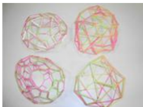
Figura 9: Parte dos trabalhos de 2012