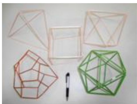
Figura 2: Trabalho de 2007

Na avaliação dos trabalhos, após a análise crítica e conjunta, realizada ao final de todas as atividades do semestre, observou-se a necessidade de que esses critérios estivessem explícitos no enunciado da tarefa, de modo claro. Considerando a discrepância na quantidade de alunos por grupo vivenciada nesta turma, para o ano seguinte, foi decidido fixar o número mínimo e máximo de elementos por grupo. A Figura 3 exemplifica dois trabalhos desta turma.