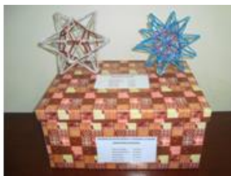
Figura 7: Trabalho de 2011

Em 2012, 28 alunos distribuídos em 5 grupos, receberam a tarefa descrita a seguir.