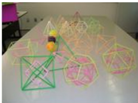
Figura 10: Parte dos trabalhos de 2008-2009

Os grupos colaborativos se mostraram muito adequados às tarefas propostas, a participação muito ativa dos alunos da disciplina, tanto em sala de aula, quanto nas reuniões para desenvolvimento dos trabalhos se evidenciou fortemente. Os alunos aprenderam efetivamente a utilizar um software para construção de figuras geométricas e treinaram o desenvolvimento de raciocínio colaborativo em grupo, utilizando o material concreto na dedução algébrica dos resultados e vice-versa. Aprenderam efetivamente a produzir um texto científico e didático, planejaram e construíram material didático concreto de apoio ao texto para uso no Laboratório Didático de Matemática do curso, como exemplificado nas Figuras 10 e 11, e obtiveram, alguns pela primeira vez, a experiência de realizar uma apresentação oral de trabalho. As últimas turmas mostraram um grande amadurecimento no processo de aquisição dos conteúdos. Percebeu-se então que a consolidação da proposta de tarefas desafiadoras proporcionou grande amadurecimento dos estudantes.