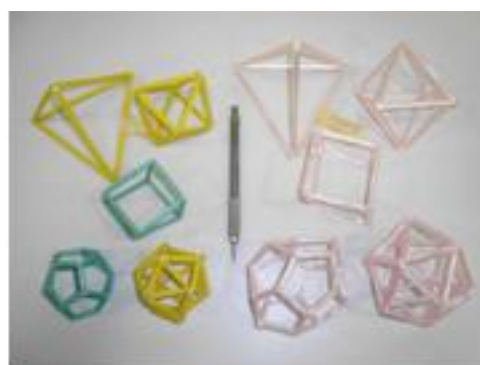
Figura 3: Parte dos trabalhos de 2008

Em 2009, os 36 alunos foram distribuídos em 6 grupos de 6 ou 7 alunos cada e realizaram a tarefa seguinte. Construir os sólidos (“esqueletos”) especificados abaixo com canudinhos e fitilho (ou cordão), tendo a maior aresta (canudinho) comprimento igual a 20 cm (opção de 16 cm também), de acordo com o que se pede para cada grupo: