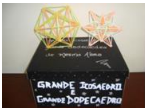
Figura 6: Trabalho de 2011

Com a inovação do tema, devido à maior complexidade do assunto e ao maior número de alunos e grupos, as apresentações foram realizadas em dois dias. Apesar da maior dificuldade na confecção dos sólidos, estes ficaram muito bem montados e acabados, como exemplificado nas Figuras 6 e 7.