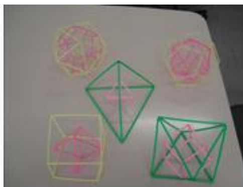
Figura 4: Trabalho de 2009

Os cinco grupos apresentaram propostas inovadoras, sendo duas bem fundamentadas e estruturadas, uma sem detalhamentos, uma inadequada ao contexto e outra inconsistente. A Figura 5 apresenta alguns dos sólidos produzidos pelos estudantes dessa turma.