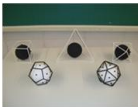
Figura 5: Trabalho de 2010

No ano de 2011, o trabalho estava consolidado e as turmas se mostravam motivadas desde a inscrição na disciplina, o que ficou comprovado pelo aumento significativo de alunos inscritos (33 alunos distribuídos em 6 grupos). O novo tema proposto, adequado de propostas das turmas anteriores, era inovador, mais desafiador e de confecção muito mais trabalhosa. Desta forma cada grupo passou a abordar apenas dois poliedros.