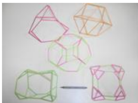
Figura 8: Trabalho de 2012

Novamente, pelos mesmos motivos anteriores, as apresentações foram realizadas em dois dias. Da mesma forma, apesar da dificuldade de confecção dos sólidos propostos, os trabalhos ficaram muito bem montados e acabados, conforme exemplificado nas Figuras 8 e 9. Desta vez todos os grupos apresentaram propostas de trabalho adequadas e consistentes.