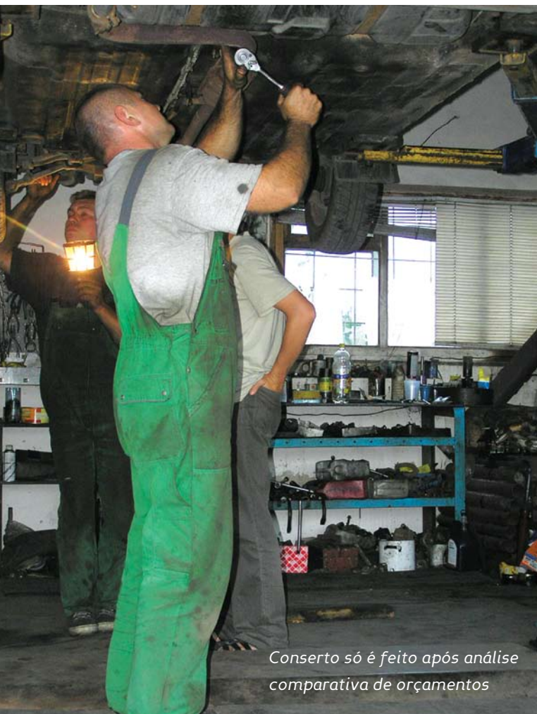
Conserto só é feito após análise comparativa de orçamentos

A Prad destaca outra vantagem do sistema de manutenção de frota: a emissão de relatórios gerenciais que permitem um maior controle do fluxo de operação ao informar, por exemplo, o histórico das manutenções realizadas no veículo.