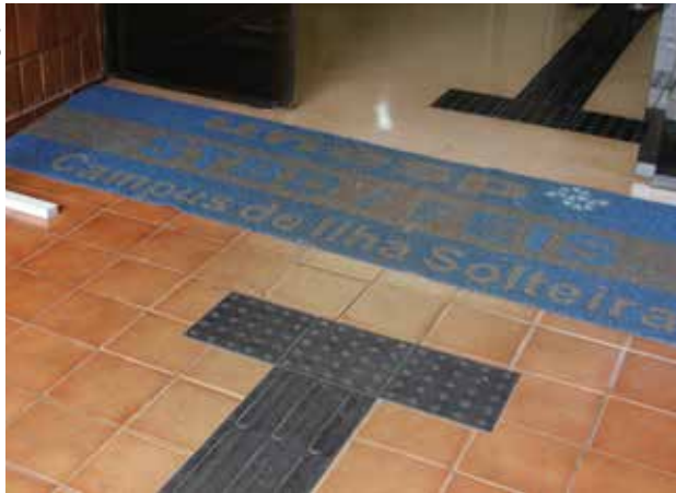
Piso tátil para pessoas com deficiência visual

A Biblioteca da Faculdade de Engenharia da Unesp de Ilha Solteira conta com novo serviço de inclusão e acessibilidade à informação. Recentemente, recebeu diversos equipamentos capazes de facilitar a vida de quem enfrenta várias barreiras no dia a dia.