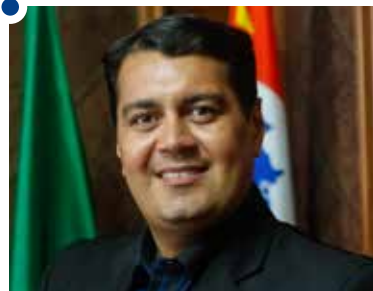
Jean Madeira, secretário estadual de Esporte, Lazer e Juventude do Estado de São Paulo

ensino superior. Como professor, tenho muito orgulho de o Estado de São Paulo poder contar com essa importante instituição.