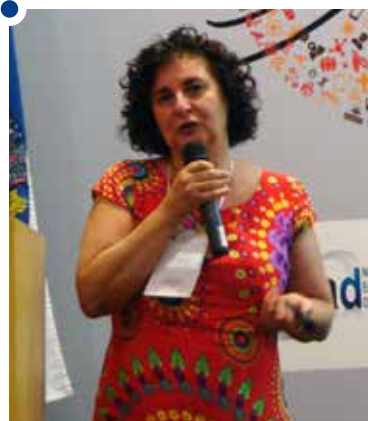
Gizelda: rápida disseminação do vírus

piores epidemias da história da cidade. Em 2010, tendo em vista o aumento dos casos de dengue na cidade, o hospital ampliou a capacidade de atendimento de 5 mil para 12 mil pacientes. De janeiro a junho de 2011, contudo, o número de atendimentos a pacientes relacionados com a dengue foi superior a 29 mil, sendo 22% de casos confirmados da doença e 100 hospitalizações.