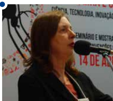
Silvia: adaptações para receber pacientes

As medidas implementadas no centro evitaram óbitos, mesmo diante de um cenário pior que o planejado inicialmente. Além disso, elas prepararam o hospital para uma epidemia ainda maior, que atingiu Ribeirão Preto no início de 2016.