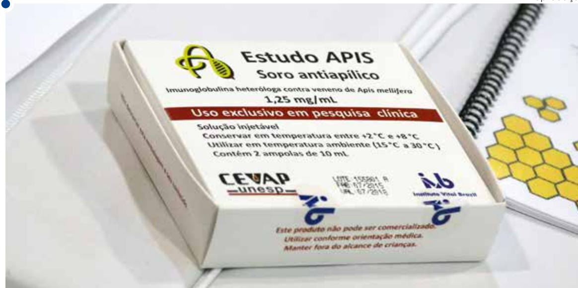
Soro pode aumentar as chances de uma pessoa sobreviver a um ataque de abelhas africanizadas