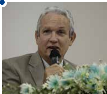
Congressos influenciam políticas públicas, garantiu Laurence

rou: participação nas decisões da escola; domínio sobre a gestão e clima da classe; compreensão de sua prática; cooperação com colegas; envolvimento dos estudantes no processo ensino-aprendizagem; satisfação com a escola.