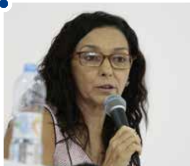
Dalila assinalou piora nas condições de trabalho do educador