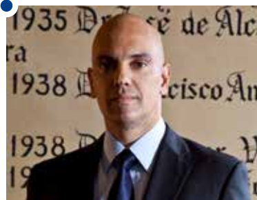
Alexandre de Moraes, secretário estadual de Segurança Pública do Estado de São Paulo

É com grande satisfação que, em nome da população de São Paulo, endereço os parabéns à Unesp pelos seus 40 anos de existência. A consolidação e a disseminação da oferta de ensino superior em São Paulo é a marca dessa jovem, porém já renomada instituição. A educação superior pública é um bem de fundamental importância para o desenvolvimento de São Paulo e do Brasil e a Prefeitura de São Paulo, para além de homenagear a Unesp , reconhece a grandeza e a relevância das parcerias existentes, como a que permite uma melhor formação de inúmeros profissionais de educação da rede municipal de ensino.