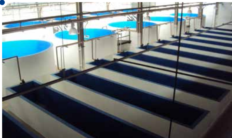
Nova destinação à infraestrutura de importante espaço

Situado na área do Boqueirão Sul de Ilha Comprida, a cerca de 75 km de Registro, o Complexo soma 1.872 m 2 de área construída, reunindo 4 tanques circulares de