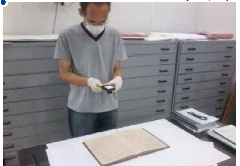
Lacerda: ampla pesquisa documental e bibliográfica