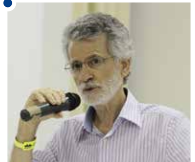
Freitas criticou ênfase na lógica da produtividade no ensino