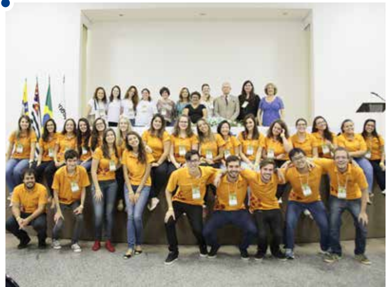
Estudantes envolvidos na organização do evento: aprendizado

Já a recepção dos participantes, organização e distribuição de materiais, organização dos espaços e acompanhamento das atividades foram realizados por 30 estudantes de Relações