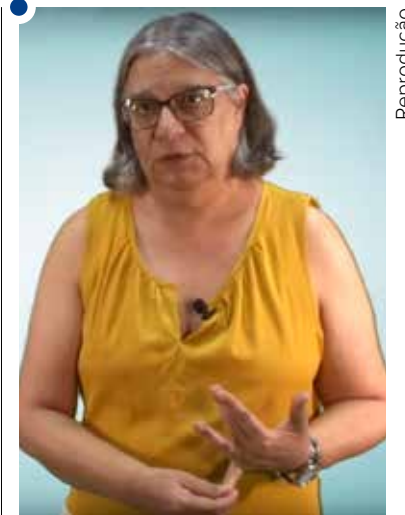
Teresa: gestão mais eficiente e focada na atividade-fim

a gestão de cada um desses processos e não dos órgãos. E um gerente é responsável por um processo do início ao fim, mesmo que isso passe por cima de departamentos e suas chefias. O que manda é o processo e não a estrutura organizacional. Essa revolução a universidade precisa aprender a fazer. A universidade pública ainda não aprendeu a olhar o processo ao invés das caixas onde estão organizadas as estruturas, que são normalmente hierárquicas, e não matriciais. Diria que esse é o grande desafio da gestão. Para fazer frente a um problema que vem de fora para dentro, ou seja, o fraco crescimento do País, que impacta sobre o orçamento, temos de encontrar uma resposta que não seja de buscar mais dinheiro de orçamento. Isso tem se demonstrado infrutífero ao longo do tempo. Então, precisamos fazer uma gestão mais eficiente e focada na atividade-fim. Para isso, a atividade-meio precisa ser mais eficiente e transversal, facilitando a tramitação dos processos administrativos para redução de custo.