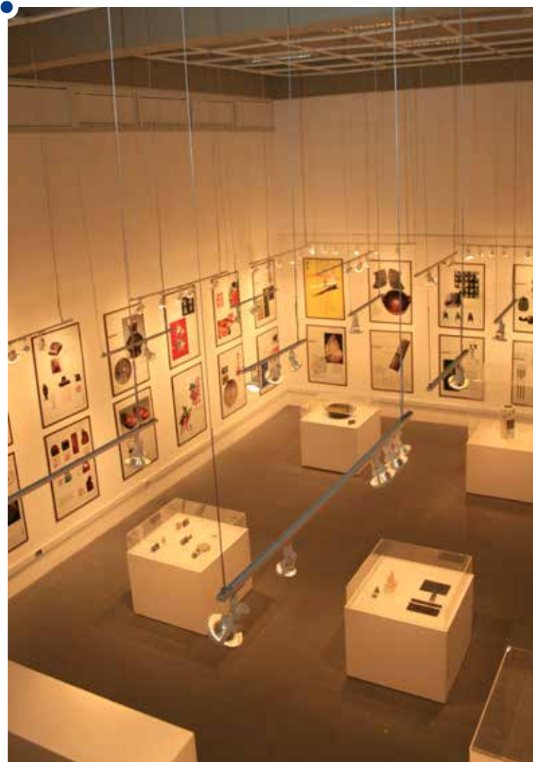
Espaço mede 14 x 10 m, com pé-direito duplo e mezanino

Hoje, aos 40 anos da Unesp , o IA tem desde 2009 sua galeria de arte medindo 14 x 10 m, com pé-direito duplo,