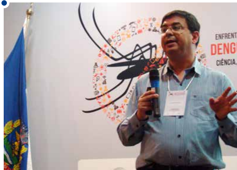
Fortaleza: quadros clínicos, diagnósticos e tratamento