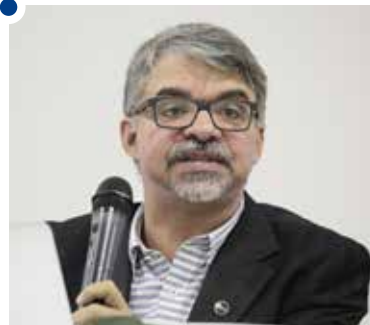
Plano Nacional de Educação amplia acesso à área, diz Dourado