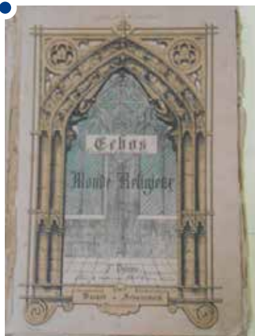
Coletânea de música sacra Echos du Monde Religieux , publicada em Paris

Uma questão atual é a assimilação de características nacionais. "É fruto de um processo gradativo de reconhecimento das culturas não-europeias, que já vem desde Pio XII (papa de 1939 a 1958), com a ampliação do uso do canto religioso popular." Outra é a valorização das raízes populares do catolicismo, sobretudo graças à Teologia da Libertação. "O processo ligado a essa vertente parece ter sido mantido, por exemplo, no pontificado