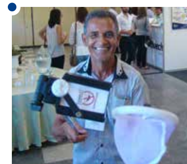
Anunciação: inovação e engenhosidade