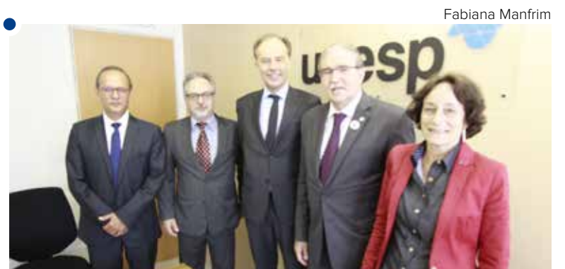
Acordo: apoio científico e cultural

Fundada em 1575, a Leiden University possui 24,5 mil alunos de pós-graduação oriundos de 110 países. Realiza pesquisa em 11 áreas do conhecimento, com destaque para Legitimidade Política e Interação entre Sistemas Legais.