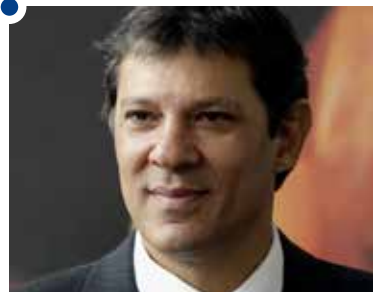
Fernando Haddad, prefeito de São Paulo

Aplicada e Computacional –, que ainda tem alguns poucos anos pela frente antes de ser, também, uma quarentona, cabe reafirmar a importância da Unesp e de seus pesquisadores e docentes na vida da SBMAC desde os seus primeiros momentos, já que docentes da Unesp estavam, como eu, na lista dos fundadores de nossa Sociedade. Não há como pensar na SBMAC sem considerar a Unesp , de tal modo a história de ambas é entrelaçada de um modo tão positivo, sinérgico e feliz. Parabéns, Unesp !