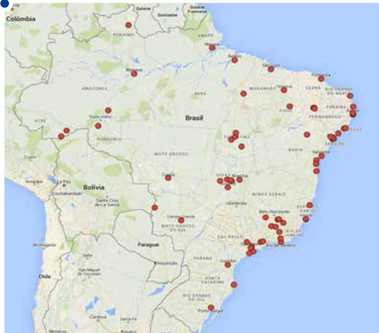
O mapa do doutorado: pesquisador visitou 70 cidades em 26 Estados e o Distrito Federal

O pesquisador apresenta um modelo de funcionamento das práticas musicais ao longo do século XX a partir dos referenciais