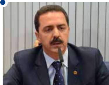
Itamar Borges, deputado estadual e presidente da Frente Parlamentar do Empreendedorismo da Assembleia Legislativa

Quero aqui, em poucas palavras, deixar minhas felicitações à Unesp pelos seus 40 anos, formando pessoas e tornando-as capazes para uma carreira promissora e de sucesso. Os ensinamentos que adquirimos ninguém pode tirar de nós; e a Unesp faz isso com maestria e muita dedicação. Parabéns aos funcionários, que tanto contribuíram para que a Universidade seja hoje respeitada, constituindo-se numa referência em nosso País.