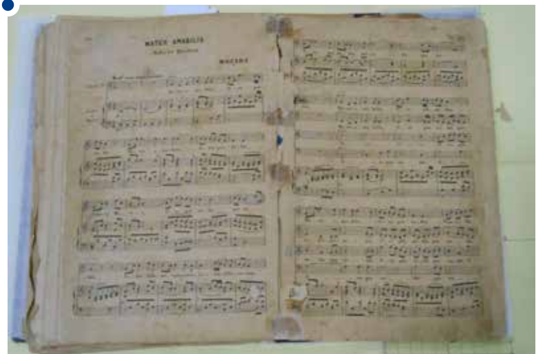
Partitura de Mater Amabilis , de Mozart, encontrada em Juazeiro do Norte, CE