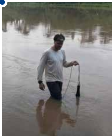
Material coletado pelos pesquisadores passa por triagem e análise molecular

“Já realizamos quatro coletas, entre os meses de novembro e fe-