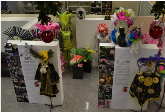
Figura 21 Mostra LabSol Coroa Imperial na Reitoria da Unesp, na cidade de São Paulo

PROEX PROFESSORIA DE EXTENSÃO UNIVERSITÁRIA