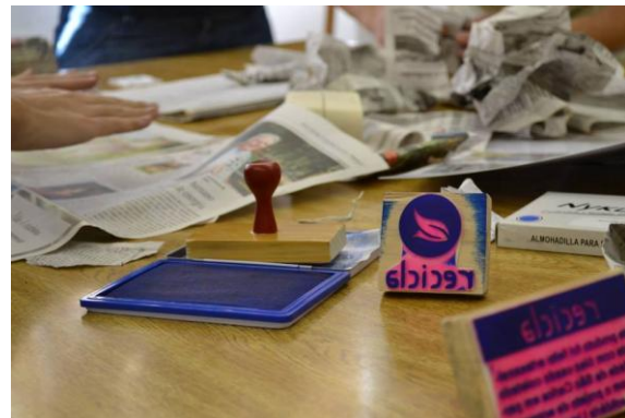
Figura 11. Oficina de apresentação da embalagem proposta pelo Labsol ao grupo Sabão Recicla.