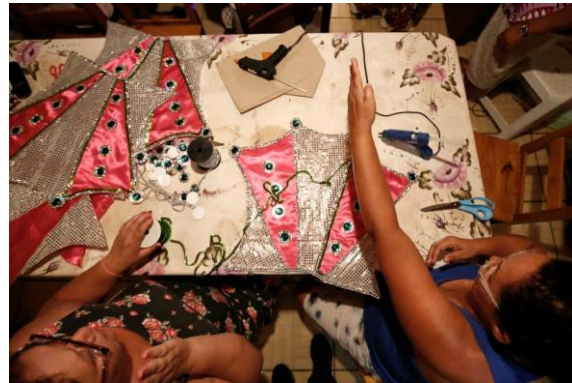
Figura 3 Produção das fantasias na comunidade.

Porém após o recesso acadêmico, o projeto voltou a procurar a escola para avaliar o andamento do trabalho. Descobriu que o trabalho ainda não havia sido iniciado, faltando pouco mais de um mês para o carnaval. A partir dessa constatação, o que poderia ser feito, senão acompanhar de perto a confecção das fantasias? E assim aconteceu, durante todo o período de preparação, com assistência direta dos membros do LabSol. Em meio às dificuldades encontradas, pode-se superar o envolvimento que o projeto já prevê com as comunidades atendidas. A troca de conhecimentos se intensificou e foi possível aos alunos conhecer ainda mais de perto outra realidade. A convivência passou a ser diária, criando laços entre as pessoas da comunidade e foi com muito afinho que todas as fantasias foram terminadas. O resultado que o projeto comemora foi sua relação mais intensa com uma comunidade e o aprendizado dos alunos, que puderam fazer uso de materiais e técnicas distintas, próprias do carnaval.