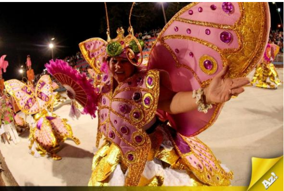
Figura 6. Desfile da Coroa imperial 2014, ala das baianas, feita a partir do reaproveitamento de materiais de carnavais anteriores