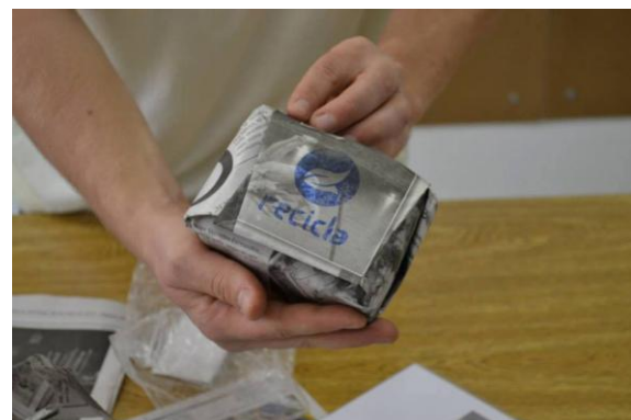
Figura 1. Embalagem apresentada ao grupo Sabão recicla.

E finalmente, apesar de não ser o foco central de trabalho do Labsol, foi feito um projeto de Ergonomia de Correção junto a Costurart, grupo de costura, procurando adequar ergonomicamente as cadeiras utilizadas pelas costureiras em seu trabalho. Esta ação do Labsol só foi possível por ser um trabalho de Iniciação Científica orientado pelo coordenador do projeto.