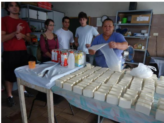
Figura 10. Visita do Labsol a produção do grupo Sabão Recicla.

O Sabão Recicla desenvolve dois produtos de limpeza na linha de sólidos: o sabão em barra e o sabão ralado, a partir de resíduos de óleo de cozinha usado (fig. 10). A proposta do LabSol para o empreendimento Sabão Recicla foi uma embalagem feita somente com jornal, sem o uso de cola, ao invés de plástico. Na embalagem de jornal, seriam colocadas informações a respeito da forma como o sabão é feito, assim como o logo do Sabão Recicla, através de carimbos. (fig.11 e 12)