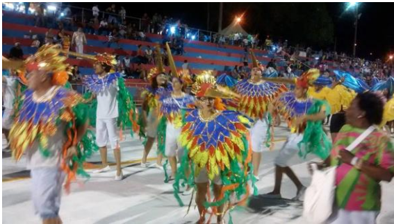
Figura 5. Desfile da Coroa imperial 2014, ala dos pássaros, feita a partir do reaproveitamento de fantasias de carnavais anteriores