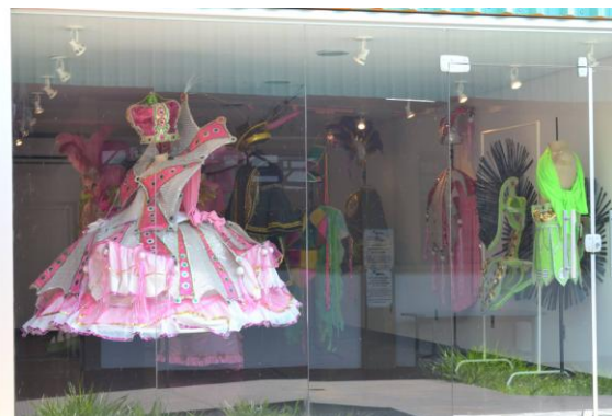
Figura 9. Mostra Labsol Coroa Imperial na Galeria de Artes da Faac. Unesp Bauru.

A parceria entre um projeto de extensão e uma escola de samba foi inédita para a UNESP e fez com que os olhares se voltassem para a gama enorme de possibilidades inerentes a esse tipo de ação. Um dos frutos desse trabalho foi a concretização de exposições das fantasias criadas em dois locais. A primeira aconteceu no campus de Bauru, na Galeria de Artes da FAAC. A exposição esteve aberta ao público entre 20 de novembro a 8 de dezembro de 2014. Foram expostas fantasias de alas, destaques, comissão de frente, baiana e mestre-sala e porta-bandeira. (fig. 20)