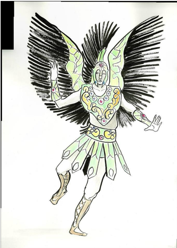
Figura 2. Projeto da Comissão de Frente da Escola de Samba Coroa Imperial utilizando materiais reciclados .

PROEX PROGrama de Extensão Universitária