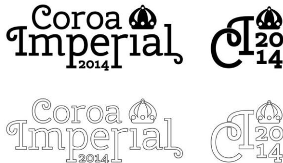
Figura 4 Identidade Visual – logomarca criada para a Coroa Imperial

Junto a isto, foi criada uma identidade visual (fig. 04) para a Coroa Imperial, foi realizada a publicação de um Art Book, tratando do trabalho da Neo-criativa e do Labsol junto a Coroa Imperial e apresentando o enredo, fantasias e alegorias do desfile de carnaval do GRES Coroa Imperial para o ano de 2014 (fig. 07). O LabSol ainda participou da organização de festas para arrecadar recursos para a escola, com um projeto gráfico de convites e material de divulgação. (fig. 08)