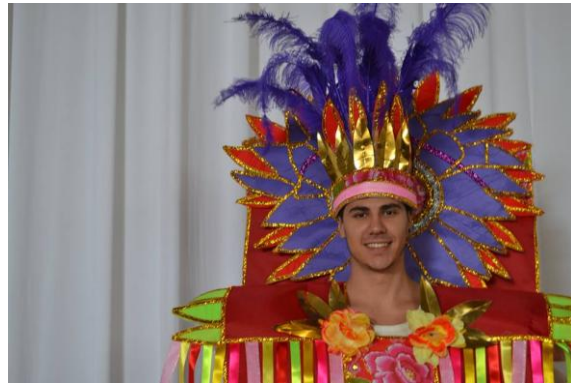
Figura 7. Protótipo – peça piloto para o Desfile de Carnaval de 2015 da GRES Coroa Imperial. Ala dos Caboclinhos. Construída a partir da reciclagem do material da ala dos pássaros de 2014.