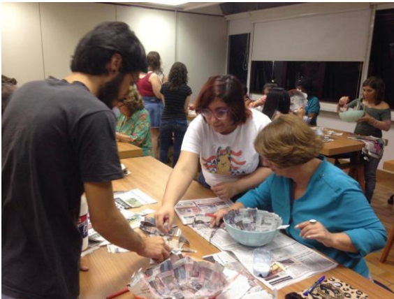
Figura 67. Oficina SESC Bauru 2014.

Em novembro de 2014, foi realizado em Bauru o 8º Encontro Regional de Estudantes de Design de São Paulo, o R Misto. O evento contou com a participação de grandes nomes do Design, além de oferecer oficinas, palestras, atividades e bazares. O LabSol ficou responsável oficina de luminárias, feitas com banners reutilizados e resíduos de e.v.a. Os participantes do projeto apresentaram o projeto LabSol e, logo em seguida, ministraram a oficina de luminárias (Fiat Lux) auxiliando na construção e montagem. (fig. 18).