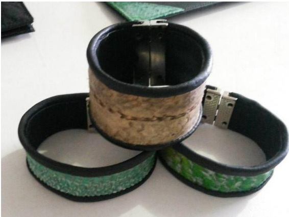
Figura 2. Pulseira apresentada à Coopeg.