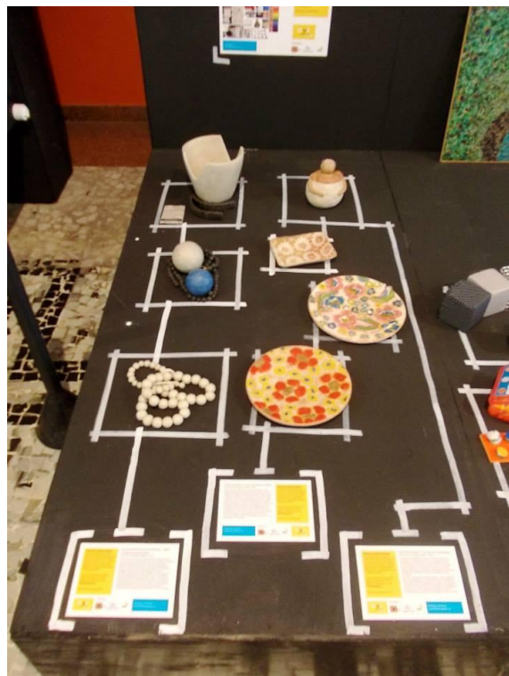
Figura 5. Produtos do Labsol apresentados na Mostra Viva Design Social, Conjunto Nacional, SP.