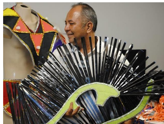
Figura 1. Produção da peça piloto da fantasia da comissão de frente da Coroa Imperial

O enredo escolhido, no início do mês de setembro, coube aos participantes do projeto criar as fantasias e alegorias para o desfile (fig. 01, 02 e 03). Em 23 de outubro de 2013, todos os protótipos haviam sido entregues, com seus respectivos moldes e demais informações técnicas necessárias à confecção das fantasias em escala.