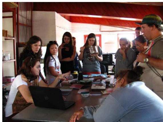
Figura 8. Apresentação dos produtos desenvolvidos à Recriat.

O Recriat é um empreendimento econômico solidário formado por usuários do Centro de Atenção Psicossocial (CAPS) de São Carlos. A atividade principal é a reciclagem e a confecção de papel para o desenvolvimento de produtos como cartões, pastas, blocos para rascunho, marcadores de livros, cadernos, álbuns de fotografia, retratos e embalagens. As integrantes do LabSol produziram novos caderninhos e caixas de papel, com intensa pesquisa para um melhor acabamento de ambos.