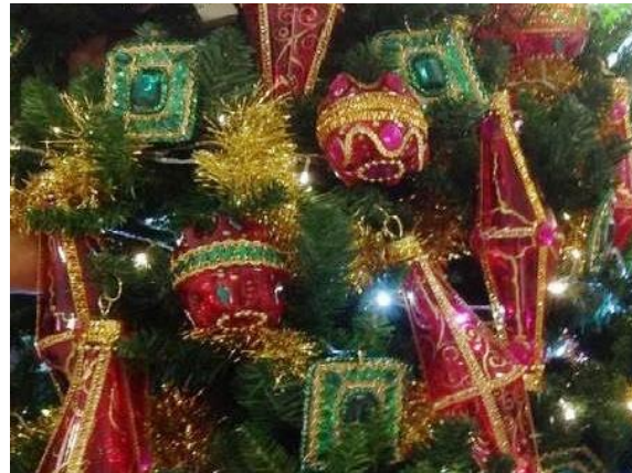
Figura 8. Detalhe da árvore de natal da FAAC UNESP Bauru para 2014-2015.

Todo final de ano, o laboratório é responsável por fazer a árvore de Natal da Graduação da Faculdade de Artes, Arquitetura e Comunicação - FAAC, da UNESP Bauru (fig. 19). E em 2014 não foi diferente. O LabSol desenvolveu uma árvore com garrafas PET e material de carnaval. A árvore ficou exposta entre 17 de novembro a 6 de janeiro e, após a exposição, seus enfeites foram utilizados para compor alegorias para o carnaval da Coroa Imperial.