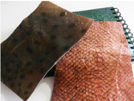
Figura 3. Caderno de anotações apresentada à Coopeg.

Para o grupo que trabalha com papel mache (fig 30) foram desenvolvidas técnicas de conservação, aprimoramento da massa de papel e um conjunto de objetos produzidos através de formas para atender o comércio de produtos sazonais: natal, carnaval, dia das mães, dia das crianças e um conjunto de imãs de geladeira com temática local.