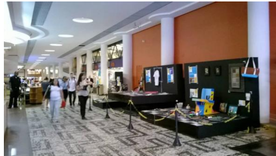
Figura 4. Mostra Viva Design Social, Conjunto Nacional, SP

Ainda no mês de dezembro de 2013, fomos convidados a expor nossos trabalhos na Mostra Viva Design Social, evento que foi realizado no Conjunto Nacional (fig. 15), em SP onde foram expostas algumas peças do acervo de projetos do LabSol (fig. 16). Este convite demonstra o alto grau de visibilidade do Labsol na área do Design.