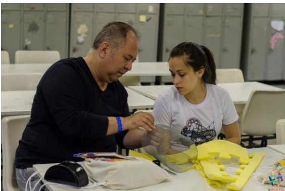
Figura 7. Oficina de luminárias (Fiat Lux) no 8º Encontro Regional de Estudantes de Design de São Paulo, Unesp Bauru

Em novembro de 2014, foi realizado em Bauru o 8º Encontro Regional de Estudantes de Design de São Paulo, o R Misto. O evento contou com a participação de grandes nomes do Design, além de oferecer oficinas, palestras, atividades e bazares. O LabSol ficou responsável oficina de luminárias, feitas com banners reutilizados e resíduos de e.v.a. Os participantes do projeto apresentaram o projeto LabSol e, logo em seguida, ministraram a oficina de luminárias (Fiat Lux) auxiliando na construção e montagem. (fig. 18).