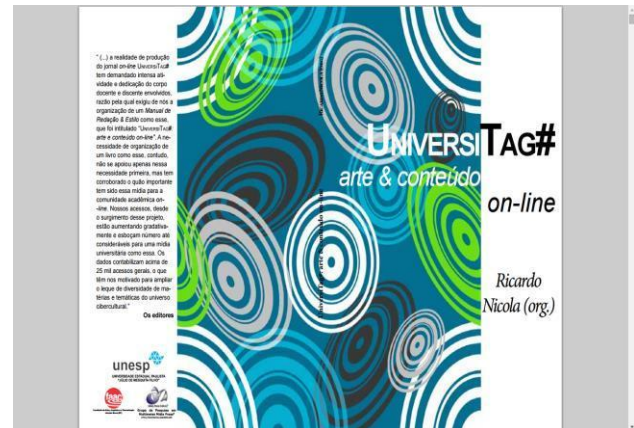
Figura 2 – Manual de Redação do Jornalismo Digital "UniversiTag#".

Vale destacar, também, a disponibilização dos livros da Série "Poéticas Visuais" – Arte & Linguagem e Arte & Tecnologia, que está em seu quarto volume.