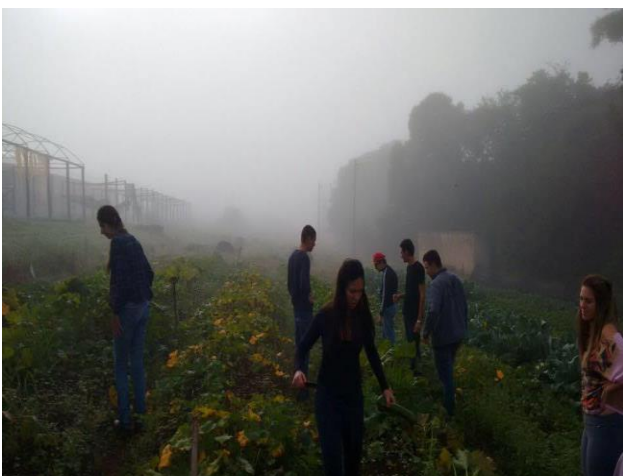
Figura 2. Alunos do curso de Agronomia da FCAV acompanhando as culturas.

Todas as atividades de produção das hortaliças são realizadas pelos estudantes, como: produção de mudas, transplante de mudas para o canteiro, semeadura diretamente no canteiro, desbaste, desbrota, capina, tutoramento, adubação, preparo de solução nutritiva, assepsia de estrutura hidropônica, colheita, lavagem e entrega das hortaliças.