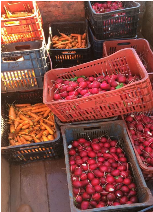
Figura 5. Pós-colheita.