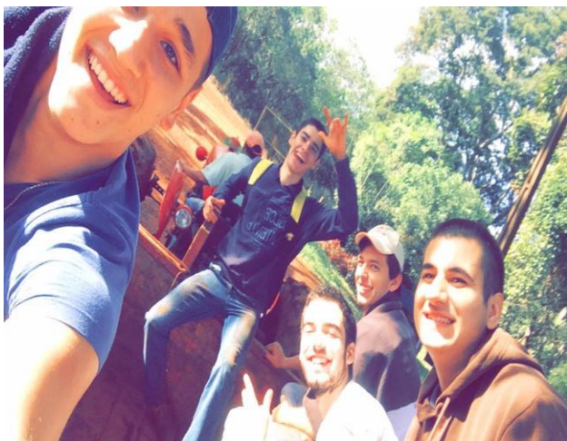
Figura 6. Alunos participando do projeto.

Até o final do ano de 2014, participaram do projeto 293 alunos do curso de Engenharia Agrônômica da Unesp, e alguns voluntários dos cursos de Biologia e Zootecnia, além de estagiários de outras universidades.