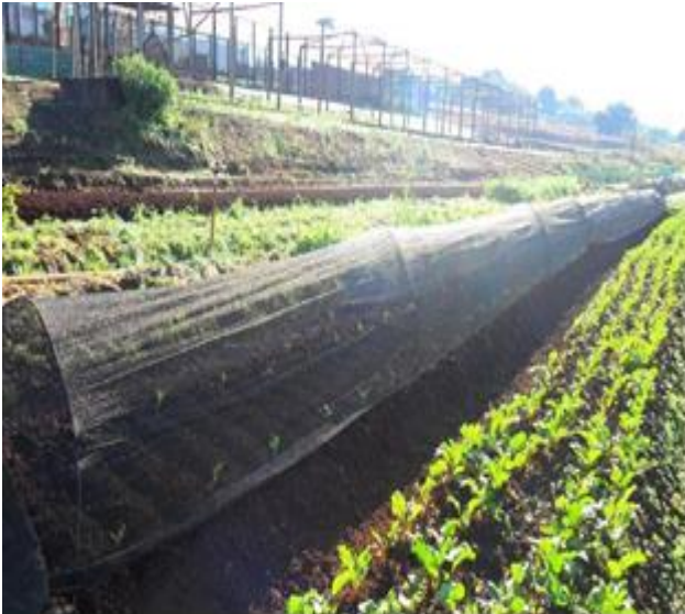
Figura 1. Cultivo de beterraba (aberto) e couve (fechado).

energia, água, máquinas, implementos, além do auxílio na entrega das hortaliças.