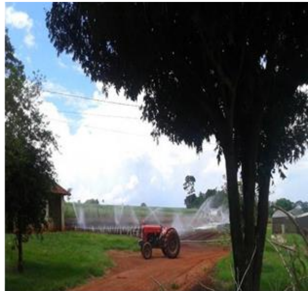
Figura 3. Irrigação das culturas.

Os servidores da Unesp cuidam do preparo do solo, da construção dos canteiros, da irrigação e do controle fitossanitário, além de disponibilizar o caminhão e o motorista para a entrega das hortaliças nas instituições beneficiadas.