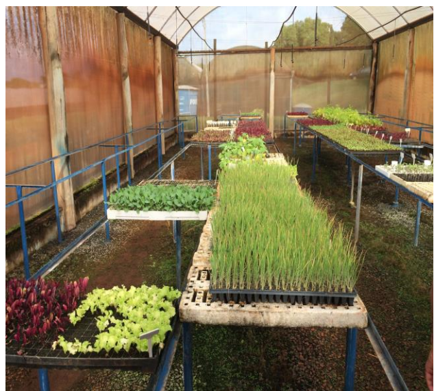
Figura 4. Cultivo em casa vegetativa.

Na área disponibilizada, são cultivadas principalmente: alface, cenoura, beterraba, cebolinha, repolho, couve, abobrinha, tomate, batata-doce e brócolis.