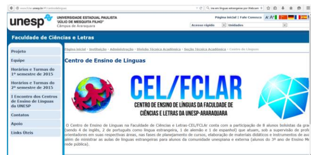
Figura 1. Página do Centro de Ensino de Línguas da FCLAr.. Disponível em http://www.fclar.unesp.br/#!/centrodolinguas

O projeto apresenta como metodologia a realização das seguintes atividades: divulgação, inscrição e oferecimento dos cursos de línguas estrangeiras para a comunidade interna e externa, leituras e fichamentos de textos de cunho teórico-metodológico acerca dos processos de ensino e aprendizagem de línguas, reuniões periódicas para planejamento de aulas, análise, adaptação e elaboração de material didático, orientações pedagógicas e científicas aos alunos-professores, análise de desempenho e acompanhamento pedagógico dos alunos inscritos, orientação de pesquisas sobre o processo de ensino e aprendizagem de línguas estrangeiras, participação de alunos-professores e supervisores em eventos acadêmicos da área, e elaboração de relatórios finais.