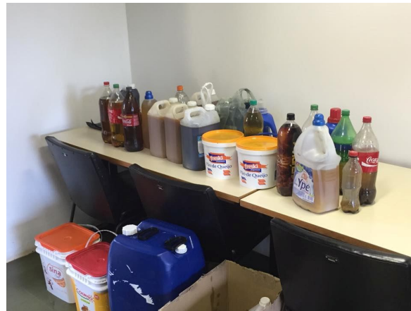
Figura 2. Divulgação - A arte da Gincóleo.

https://www.facebook.com/pages/Gincana-de-coleta-de-%C3%B3leo-Ginc%C3%B3leo/1600777476839947?fref=ts