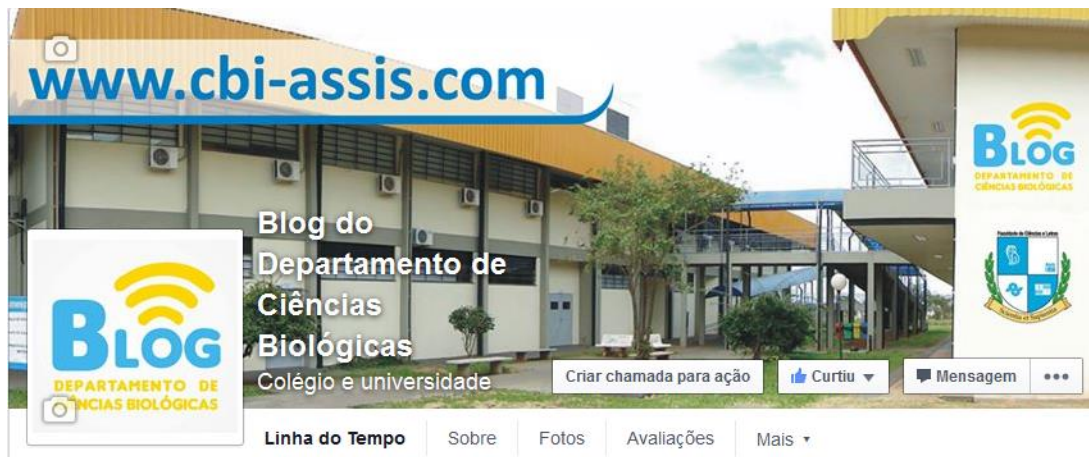
Figura 2. Página do Blog do Departamento no Facebook

https://www.facebook.com/pages/Blog-do-Departamento-de-Ci%C3%A2ncias-Biol%C3%B3gicas/1459397680949569