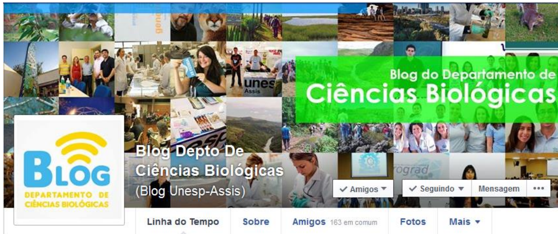
Figura 3. Perfil do Blog do Departamento no Facebook https://www.facebook.com/profile.php?id=100008169255491