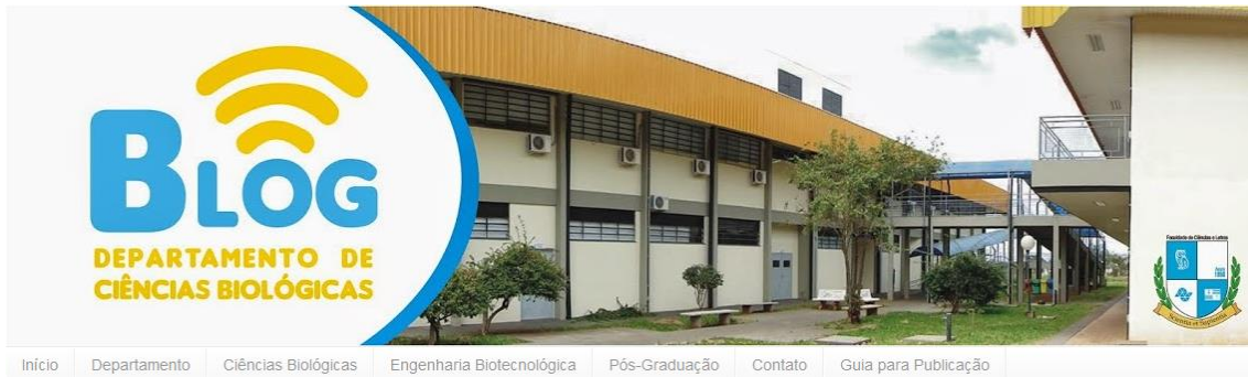
Figura 1. Cabeçalho do Blog do Departamento