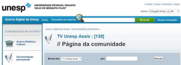
Fig. 2 – Site do acervo digital da UNESP

Os dados estatísticos do repositório inicial da TV UNESP Assis registraram mais de 11.461 visualizações dos programas disponibilizados. A estatística de acesso à página da TVUNESP (Google analytics) mostra que desde outubro de 2009 até o dia 16/08/2015, o site recebeu 11.858 visitas de 7.549 visitantes únicos. No acervo digital os 138 vídeos disponíveis foram visualizados 14696 vezes.