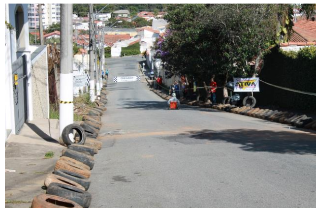
Figura 1. Vista da ladeira utilizada para o evento em 2015.

Na competição de 2015 houve a participação de 7 equipes e 9 empresas patrocinadoras/parceiras. O apoio cedido foi revertido para a infra-estrutura e divulgação. No evento criado em uma rede social para a disseminação do GP houve 208 confirmações de presença ( https://www.facebook.com/events/461744543974834/ ), e no dia foram aproximadamente 100 pessoas que realmente compareceram entre competidores, seus familiares e a população da cidade de Guaratinguetá em geral. No final houve premiação para as três equipes melhores colocadas e para o carrinho de rolimã com melhor design (figura 3), além de uma homenagem em memória ao ex-membro do Grupo PET, Anderson Sena, falecido em 2011, destinada à família dele (figura 4). Além da corrida, o evento também proporcionou uma importante ajuda de cunho social com a arrecadação de 56 kg de alimentos das equipes que foram doados à Casa do Puríssimo Coração de Maria, localizada na cidade de Guaratinguetá, destinados à alimentação das crianças integrantes do projeto.