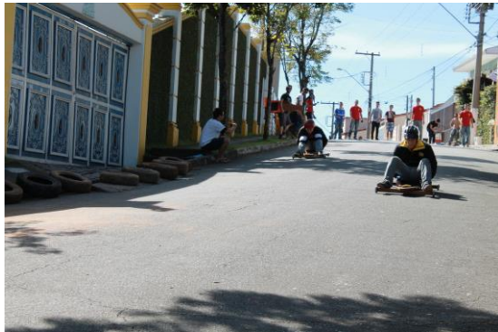
Figura 2. Competidores durante o evento em 2015.