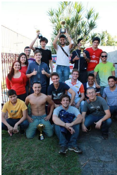
Figura 3. Premiação dos competidores do GP de 2015.