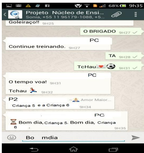
Figura 1. Primeira escrita de bom dia .

por ser a primeira vez que assume sozinha a responsabilidade de escrever diz não saber o poderia escrever para se inserir no diálogo. Neste momento o papel da P1 como mediadora foi essencial, pois ofereceu pistas para que Sabrina iniciasse sua escrita. Apesar dos dispositivos móveis oferecerem diversos aplicativos com funções para escrever, a criança não se apropria da linguagem escrita apenas manuseando esse instrumento. Ela necessita das interações, pois a apropriação da linguagem escrita não se dá de forma natural. A criança se "[...] apropria [do] sistema lingüístico, no sentido de que constrói, com os outros, os objetos lingüísticos de que se vai utilizar, na medida em que se constitui a si próprio como locutor e os outros como interlocutores." (FRANCHI, 1987, p. 12 apud Abaurre, 1997, p. 82). O homem não apenas se apropria do sistema lingüístico, mas conforme destaca a autora, ele o constrói na relação com o outro . Vigotski (2009) aponta que a comunicação é uma função da linguagem e essa é uma forma de comunicação social, de enunciação e de compreensão. As imagens a seguir destacam as tentativas de escrita da palavra bom dia , descrita no diálogo acima. (Figuras 1 e 2).