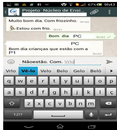
Figura 4- Segunda escrita de não estou Com frio.