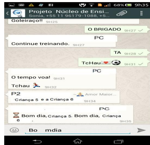
Figura 2. Segunda escrita de bom dia .

No início da pesquisa, como pode ser observado no primeiro diálogo, Sabrina escreveu com ajuda dos amigos do grupo. Durante a escrita eles soletraram as letras para que ela pudesse marcá-las. No entanto, na escrita individual, faz suas tentativas e busca o auxílio no teclado virtual para fazer suas escolhas. Após sua escolha, P1 a orienta sobre o uso do espaço para separar as palavras bom e dia . O espaço em branco é considerado por Arena (2015) como algo necessário na construção do discurso. Segundo ele,