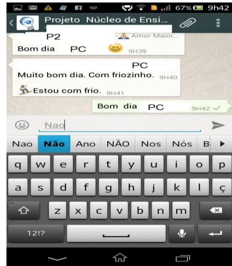
Figura 3- Primeira escrita de não estou Com frio.