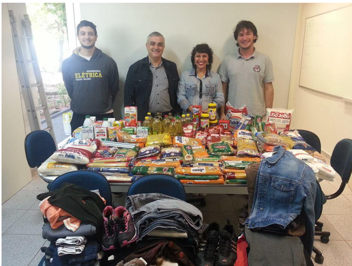
Figura 2. Agasalhos e alimentos arrecadados da doação dos alunos do Cursinho Pré-Vestibular Principia. O material foi encaminhado para as Entidades Espíritas SEAC e Centro Espírita Bezerra de Menezes, para que pudessem ser entregues a população carente.

Realização: unesp UNIVERSIDADE ESTADUAL PAULISTA "JULIO DE MESQUITA FILHO" PROEX PROGRAMA DE EXTENSÃO UNIVERSITÁRIA