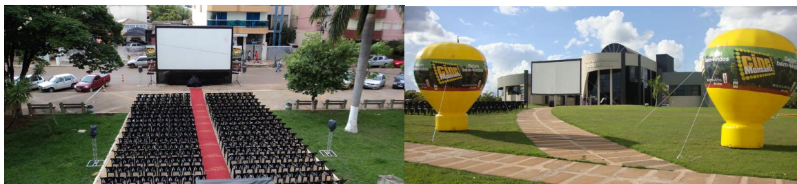
Fig. 7 – Espaços de exibição ao ar livre do projeto CineMonsanto