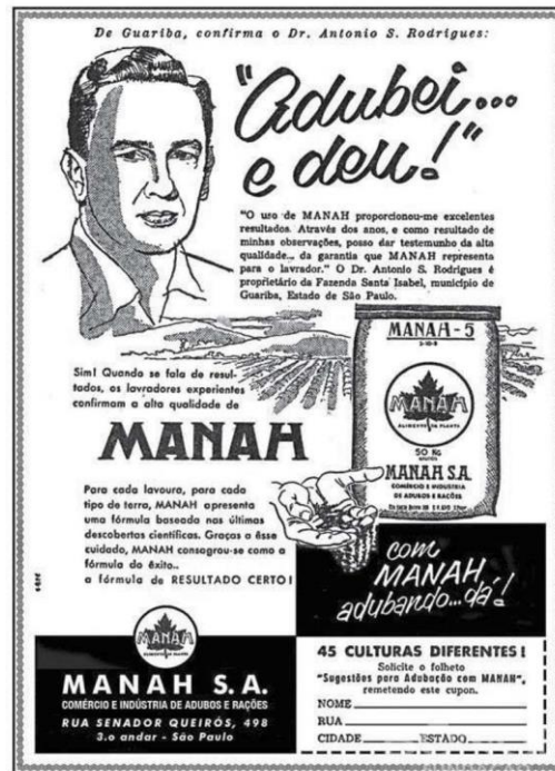
Fig. 1 – Panfleto de propaganda da Manah

A Manah, que havia sido fundada em 1947, vendeu no ano de 2000 o controle acionário da empresa para o Grupo Bunge, uma das maiores empresas do agronegócio no Brasil atualmente.