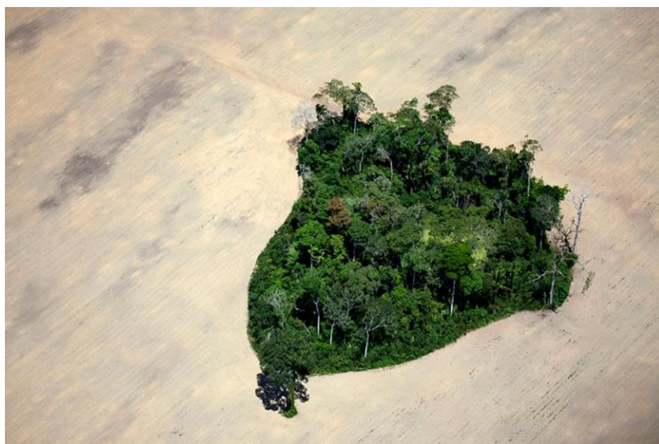
Fig. 12 - Pedaco “poupado” de floresta rodeado de campos de soja no sul de Itaituba, Pará, Brasil.