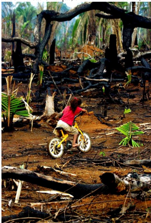
Fig. 9 - Menina andando de bicicleta no meio da floresta queimada numa área de assentamento rural. Na tarde do Dia das Crianças, em Buritis Rondônia, Brasil.