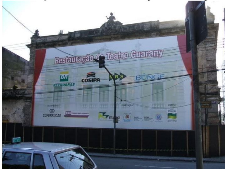
Fig. 5 – Cobertura do Teatro Guarany durante o restauro, com as logomarcas das empresas incentivadoras.

Mas isso não quer dizer que as empresas do agronegócio não invistam em patrimônio e, sim, que esse investimento apenas é feito em lugares que lhes garantam bastante visibilidade da marca e uma boa política de relações públicas, em geral, em grandes cidades, como a já referida revitalização do Teatro Guarany em Santos, que contou com o patrocínio da Bunge e da Copersucar, entre outras.