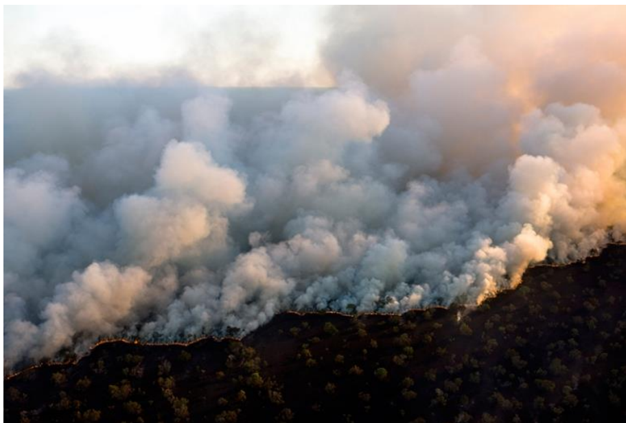
Fig. 11 – Queimada no “cerrado” próximo ao Rio Araguaia do lado de fora do Parque Nacional do Araguaia, Mato Grosso, Brasil.