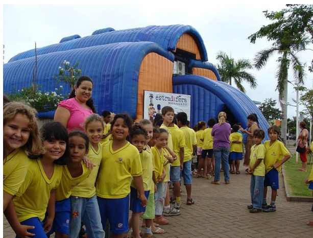
Fig. 4 - Circuito Estradafora da Monsanto

O Circuito Estradafora Monsanto, [é um] projeto cultural itinerante que tem como objetivo democratizar o acesso à cultura e à arte, com apresentações teatrais, sessões de cinema, saraus e culturais e educativas. Os ingressos estão sendo distribuídos na Secretaria Municipal de Educação e Cultura. [...] é realizado em uma carreta-teatro, que se transforma em uma sala de espetáculos, coberta e climatizada, com capacidade para 150 espectadores, onde são realizadas apresentações de teatro, cinema, oficinas culturais e espetáculos regionais. O veículo conta com todos os recursos técnicos necessários às apresentações, como blackout, som, luz e ar-condicionado. A estrutura pode ser montada em lugares de fácil acesso, como praças, ruas, avenidas e quadras. [...] com apresentações do espetáculo teatral infantil Trilhos que eu mesmo fiz, dos filmes Saneamento Básico, Wall-e, Meu nome não é Johnny, Uma verdade inconveniente e Os Thornberrys, além de sarau cultural, com artistas locais. (CIRCUITO..., 2008).