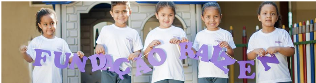
Figura 2 - Imagem de divulgação da Fundação Raízen

Santa Cruz (2006) refere que “nesse sentido, responsabilidade social, e seus diversos sinônimos (marketing social, cidadania corporativa e filantropia empresarial, entre outros), tem se instalado como um discurso [...] que sugere a rearticulação do papel das empresas na sociedade.” Estas seriam agora imbuídas de realizar a formação político-cultural das comunidades, em especial das crianças e jovens, através do desenvolvimento de ações educativas, culturais, esportivas realizadas por meio de parcerias público-privadas. No fundo, cumpririam dois grandes objetivos ao mesmo tempo: executar o papel a elas destinado pelo estado na implementação das políticas públicas sociais e, ao mesmo tempo, agregar valor às empresas e às suas marcas.