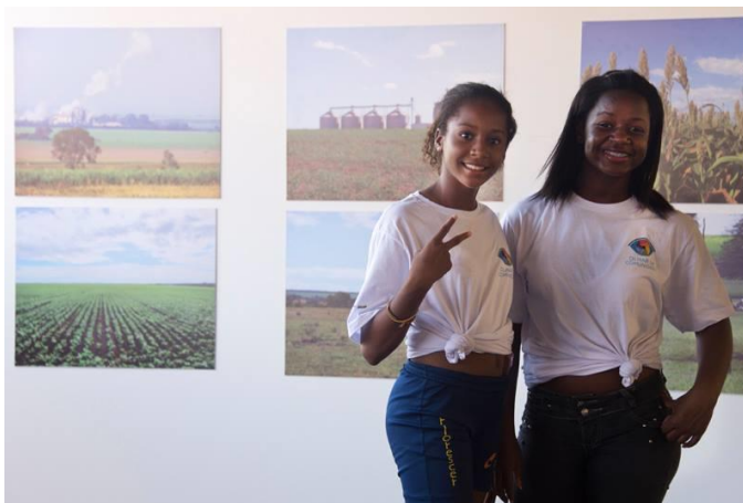
Fig. 8 – Jovens participantes do projeto Olhar da Comunidade posam em frente à exposição de fotografias de sua autoria com a temática do agronegócio.