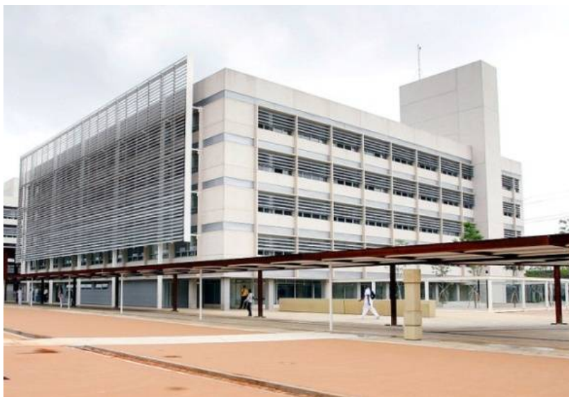
Fig.2 - Prédio da ETEC/Parque da Juventude.

Atualmente, a ETEC/PJ oferece os seguintes cursos: Administração - (EaD – Semipresencial); Administração - Integrado ao Ensino Médio; Biblioteconomia; Enfermagem; Informática para Internet - Integrado ao Ensino Médio; Logística; Marketing; Marketing - Integrado ao Ensino Médio; Meio Ambiente - Integrado ao Ensino Médio; Secretariado - (EaD – Semipresencial) e Museologia.