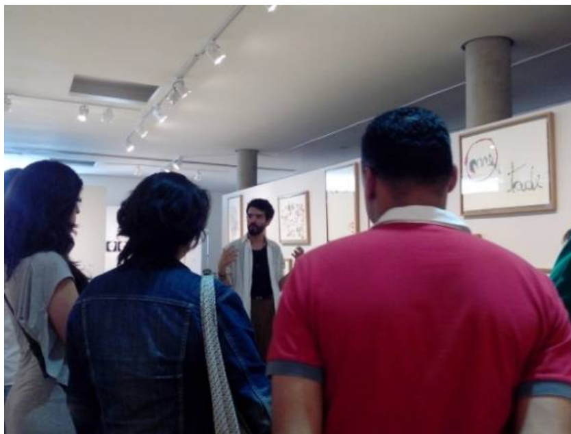
Fig. 6 - Visita Educativa no Espaço Cultural Correios, 2.º semestre 2015.