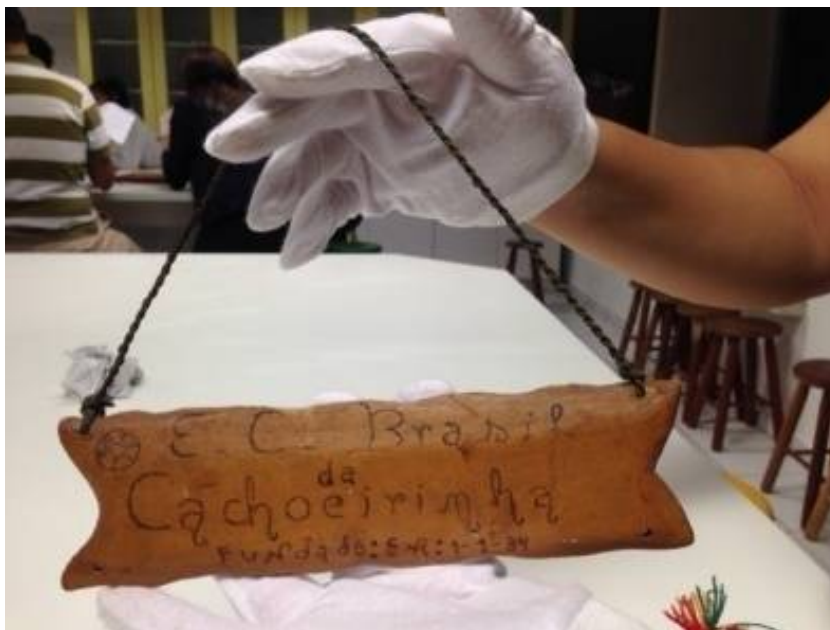
Fig. 7 - Exercício leitura de objetos com peças do acervo do EMC no laboratório da ETEC, 20/março/2015.