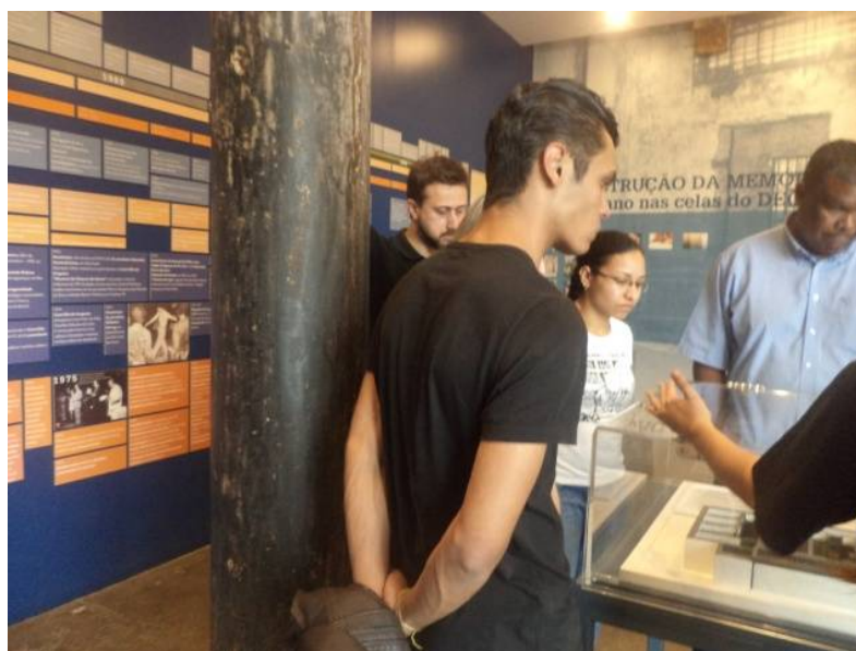
Fig. 3 - Visita Memorial da Resistência, 26/setembro/2015.

Como parte prática do curso havia o acompanhamento de visitas que nós, professores, fazíamos juntamente com os alunos. No caso dos meus componentes curriculares, as visitas eram sempre agendadas com os educadores das instituições, uma oportunidade a mais para investigarmos essas práticas. Durante esse período pude acompanhar diferentes turmas em visitas aos seguintes espaços: Memorial da Inclusão: os Caminhos da Pessoa com Deficiência, SESC Santana, Casa Guilherme de Almeida, Museu da Casa Brasileira, Pinacoteca do Estado de São Paulo, Memorial da Resistência, Fundação Cultural Ema Gordon Klabin, Jardim da Luz, Centro Cultural Correios; sendo que essas visitas se mostraram como ocasiões muito enriquecedoras para todos nós.