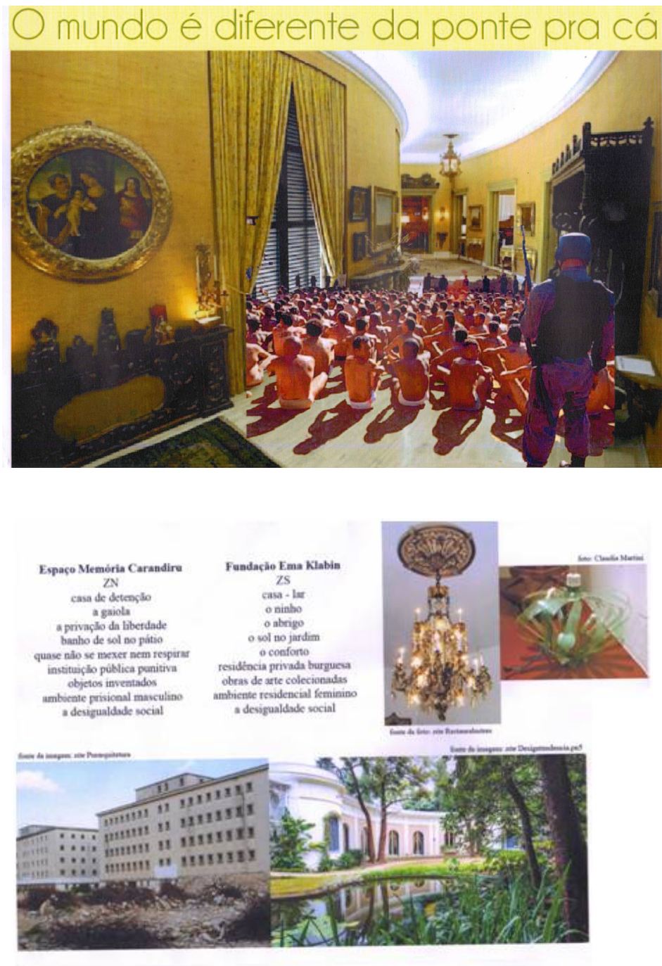
Fig. 14 e 15 - Trabalhos de alunos do curso, turma 5.

No encerramento deste item, ilustrarei essa feliz experiência com mais duas imagens de trabalhos plásticos, sínteses estéticas dessa parceria que, a meu ver, são muito representativos da potência dos encontros.