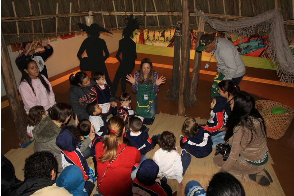
Fig.27 - Visita educativa com crianças 2/3 anos, Exposição Amazônia Mundi-SESC Itaquera, 2015.

E desse modo, ao mesmo tempo em que desperto, firmo meu caminhar pelo mundo, pois “me movo como educador porque, primeiro, me movo como gente”. (FREIRE, 2011, p. 92).