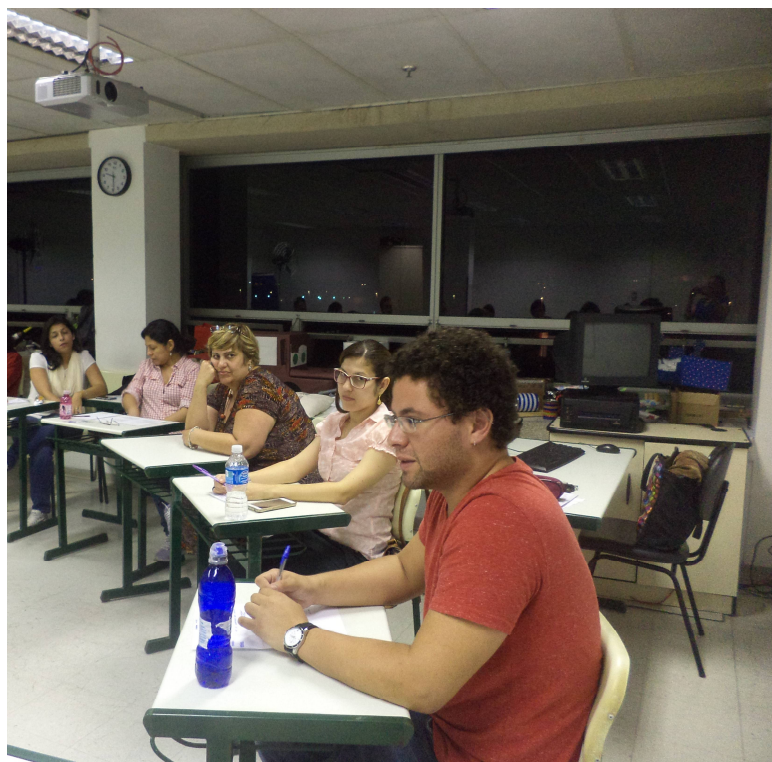
Fig. 23 - Encontro com educadores, 28/setembro/2015.

No dia do encontro os alunos entregaram uma cópia das perguntas elaboradas e combinamos que após seguirmos o roteiro das perguntas, caso ainda sobrasse tempo, eventuais novas questões poderiam ser feitas. Esse procedimento garantiu uma dinâmica diferenciada já que, em virtude das pesquisas e leituras, os alunos estavam com um domínio maior do assunto para formular questões pertinentes ao tema. Creio que essa ideia pode ser retomada, instituindo de forma regular esse debate, pois se mostrou como um momento de grande troca entre os alunos e os profissionais da área educativa de museus.