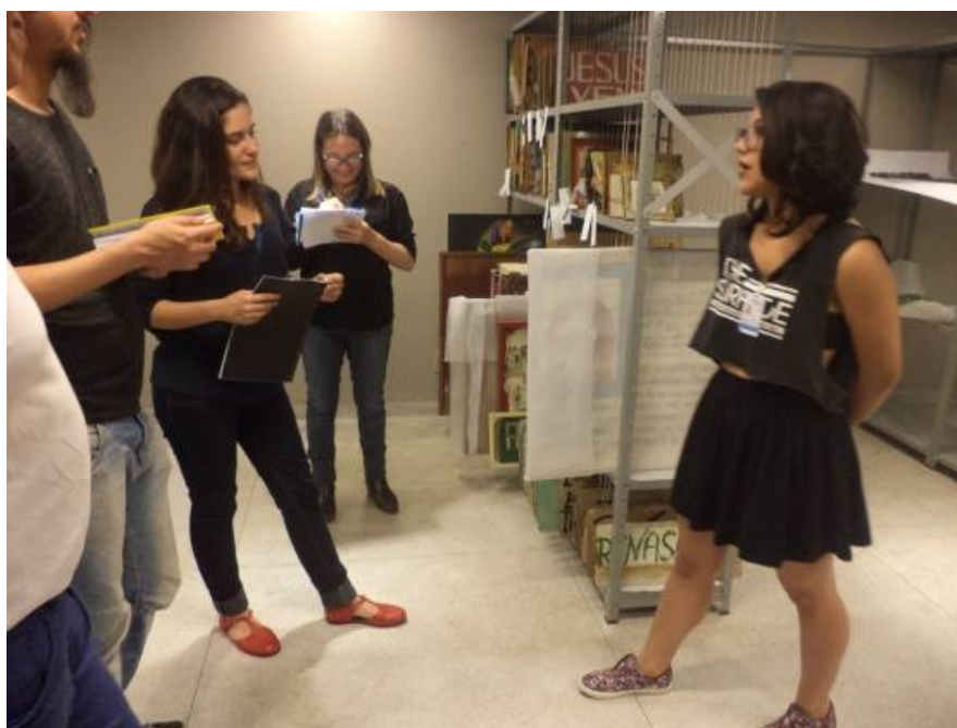
Fig. 12 - Atividade visita educativa dos alunos para educadores da FCEGK, Percurso no Espaço Memória do Carandiru, 16/setembro/2015.