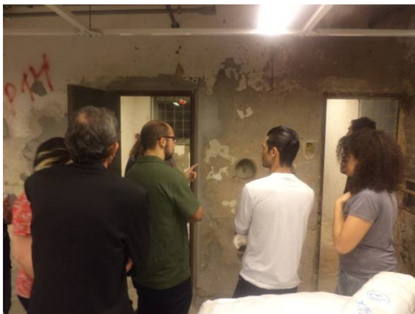
Fig. 11 - Atividade visita educativa dos alunos para educadores da FCEGK, Percurso no Espaço Memória do Carandiru, 16/setembro/2015.

No terceiro encontro, após a visita feita pelos alunos ao EMC, os educadores da FCEGK fizeram uma roda para saber a opinião da turma a respeito da experiência da mediação e, também, dos encontros, solicitando aos alunos que produzissem como fechamento uma síntese estética da experiência como um todo: as leituras, a visita acompanhada e a visita feita. O formato deste trabalho foi deixado em aberto, estimulando não apenas sínteses escritas, mas compostas em diferentes linguagens. Os trabalhos deveriam ser entregues para mim ou encaminhados diretamente ao educativo da Fundação.