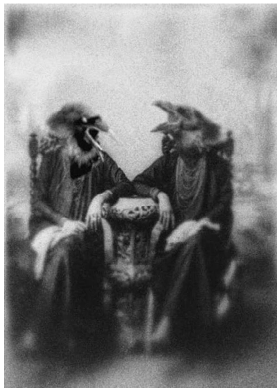
Fig. 48

Os momentos de maior crescimento foram aqueles em que elas se colocaram em confronto, a partir dos debates e das práticas!!!