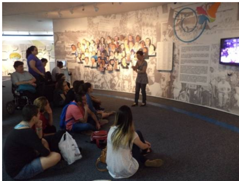
Fig. 4 - Visita Memorial da Inclusão, em 19/março/2014.