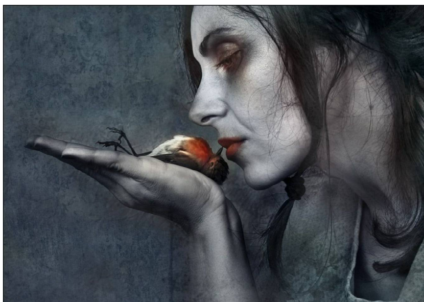
Fig. 41 - Fonte: https://transversos.files.wordpress.com/2013/04/mulher-e-passaro.jpg

Outras vezes, quando dava conta, já não se moviam mais... morriam. Simplesmente, morriam!