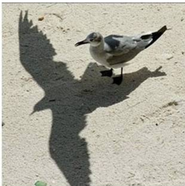
Fig. 34 – Fonte: Stéphane Rousseau – Disponível em http://www.upsocl.com/comunidad/estas-45-sombras-cuentan-una-historia-muy-diferente-a-lo-que-todos-esperarian-ver/

Logo se aborreciam e começavam a projetar novos vôos...imperceptíveis e mesmo, invisíveis para quem insistia em só vê-las paradas!!!