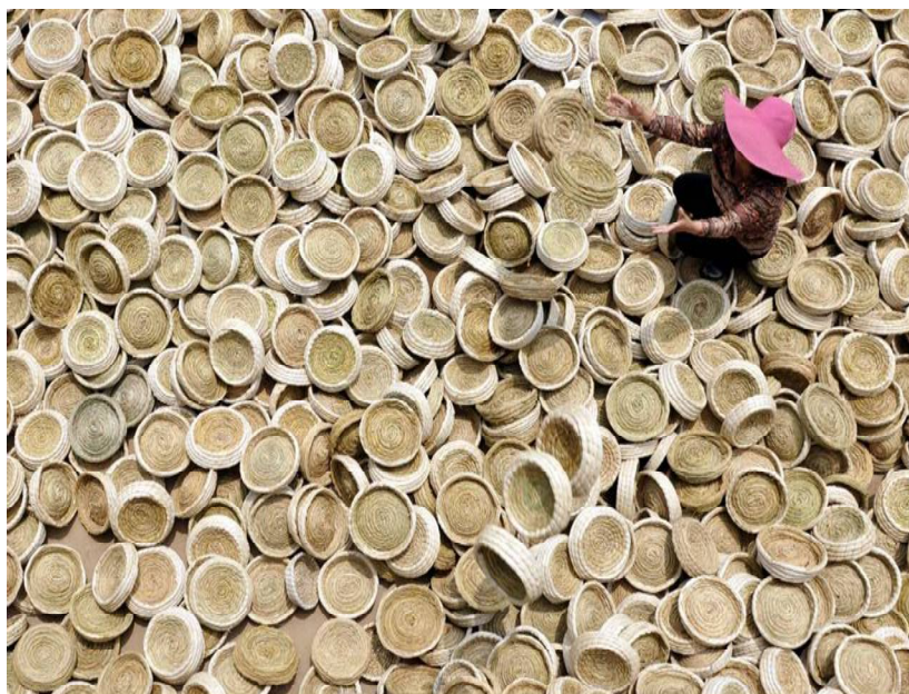
Fig. 49