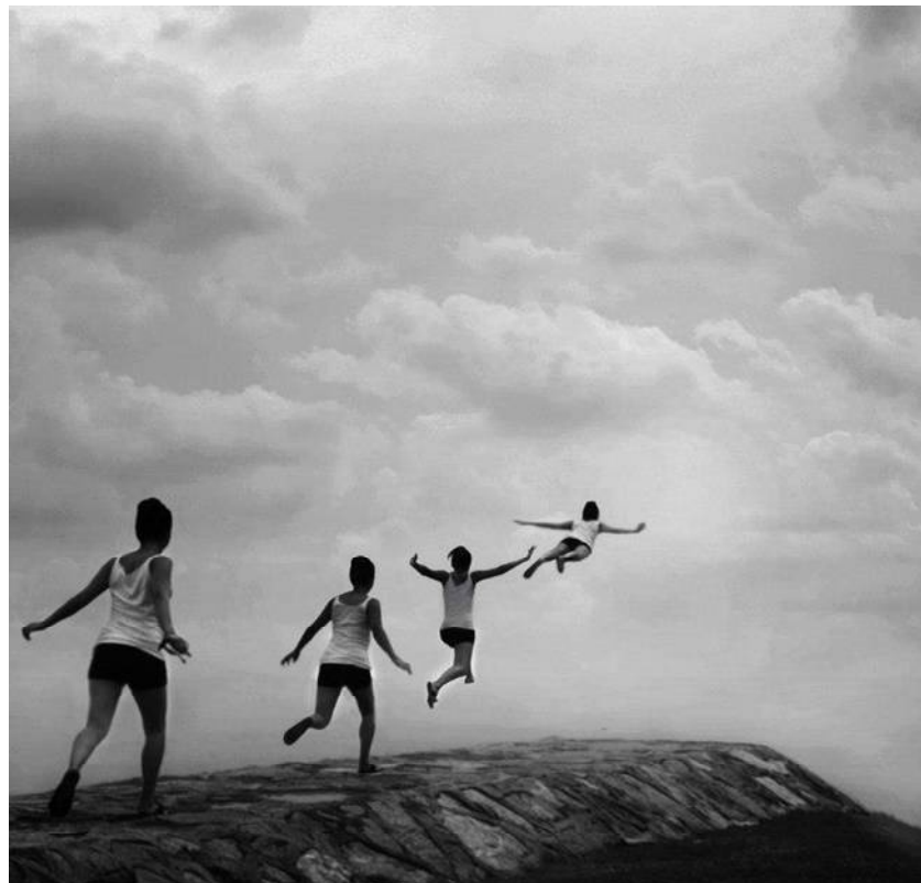
Fig. 52