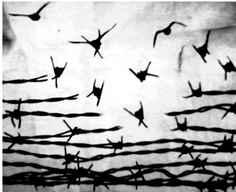
Fig. 38 - Fonte: https://atalmineira.files.wordpress.com/2014/11/passarinho.png

Criou "pontas" para se defender... Sofreu e machucou. Bateu e levou!