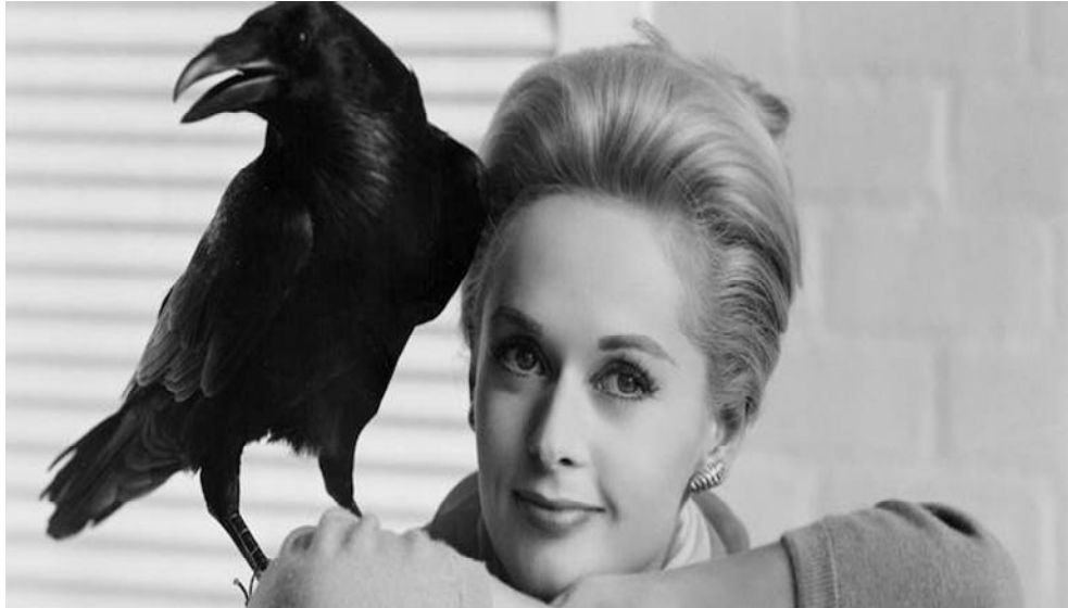
Fig. 42