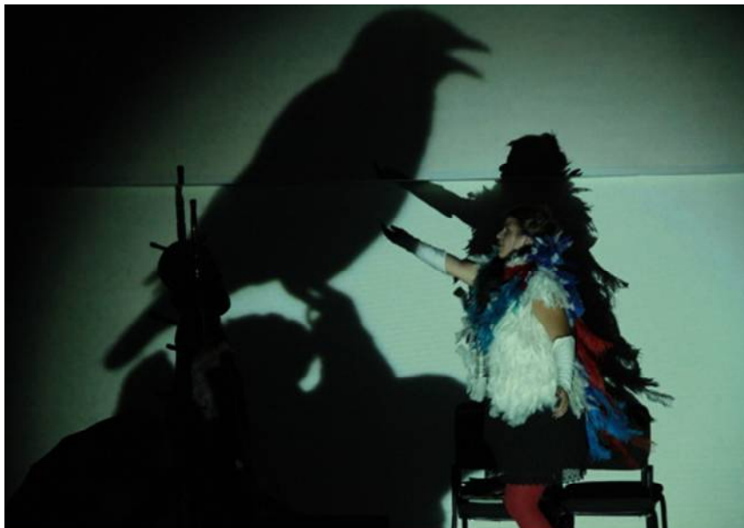
Fig. 40

Outras vezes, quando dava conta, já não se moviam mais... morriam. Simplesmente, morriam!