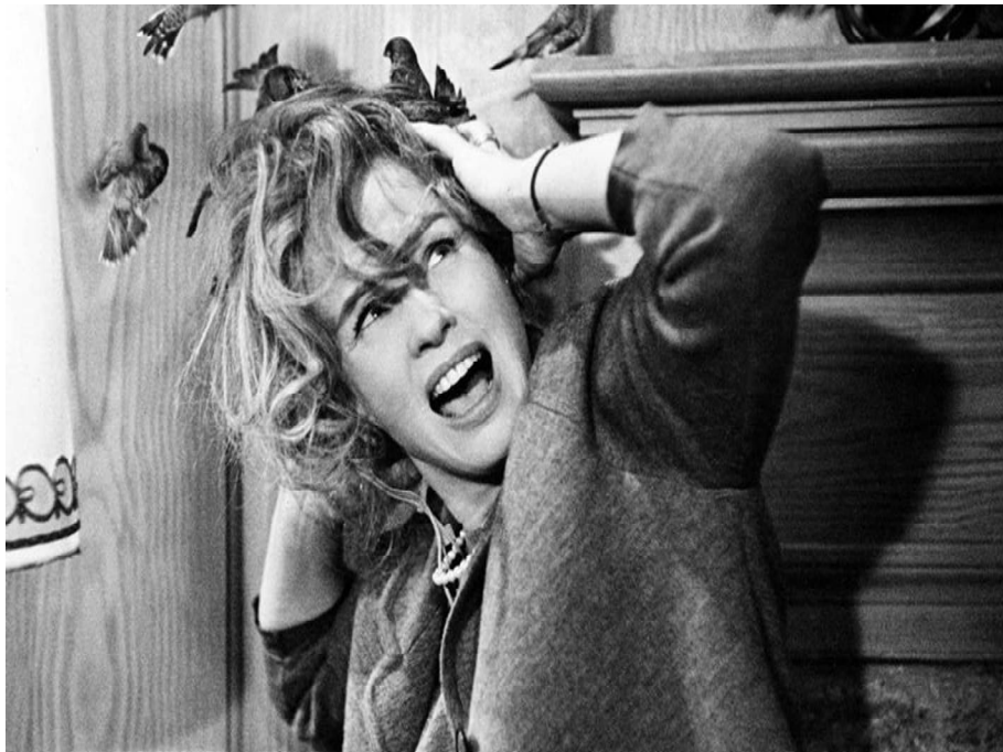
Fig. 44