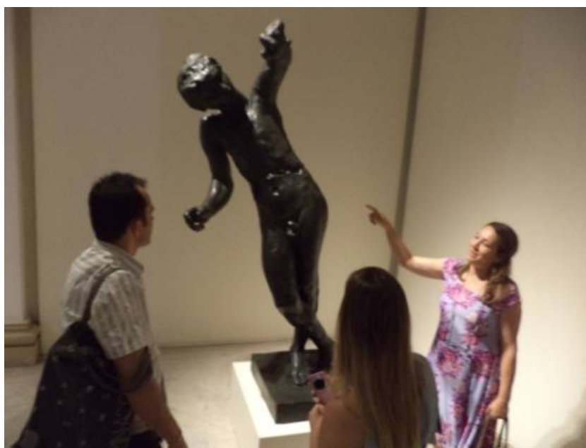
Fig. 5 - Visita Pinacoteca do Estado de São Paulo, 1.º semestre de 2014.