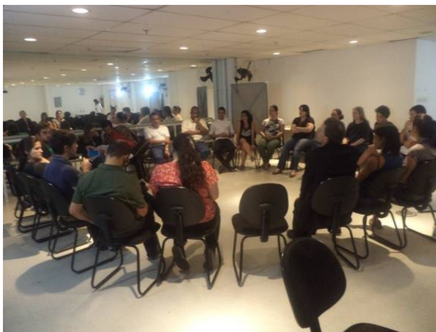
Fig. 13 - Atividade visita educativa dos alunos para educadores da FCEGK, fechamento da visita e encerramento da parceria: roda de conversa- auditório ETEC, 16/setembro/2015.