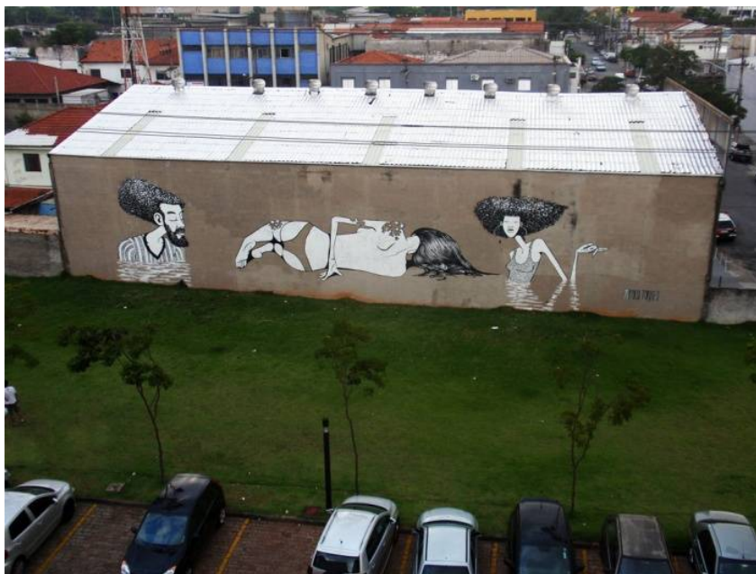
Fig.9 - Parque da Juventude II - 6 x 32 m (aprox. 19.6 x 105 ft). Parque da Juventude – Antigo presídio do Carandiru; São Paulo – Brasil, 2013.

muito bem recebida pelos alunos e que também considerei positiva pela possibilidade maior de exploração da mediação no encontro dos alunos com a obra. Novamente me senti bastante estimulada com o depoimento de alguns alunos no sentido de ter modificado sua relação com aquele trabalho que, avistado de forma displicente, diariamente na chegada à escola, agora se mostrava transformada, marcada indelevelmente pelo contato mediado e ativador de significâncias e sentidos na percepção atenta desse entorno.