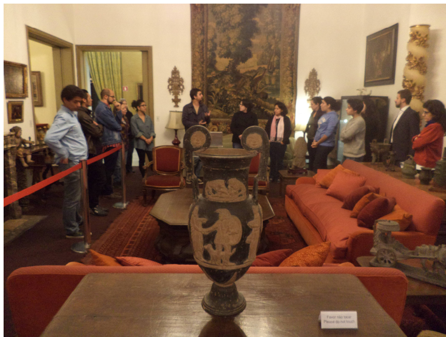
Fig. 10 - 2º Encontro parceria com educadores FCEGK – Visita mediada na Fundação Ema Klabin, 02/setembro/2015.