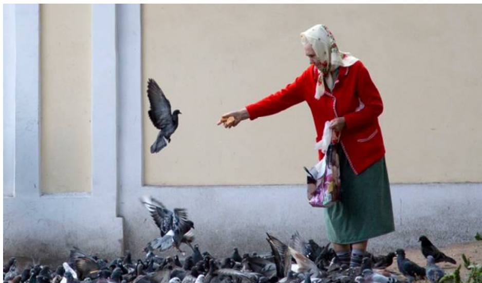
Fig. 50 - Fonte: http://omicronfotografia.com.br/blog/wp-content/uploads/2013/10/bp30.jpg

Alimentá-las e amá-las sempre, até o final dos meus dias!!