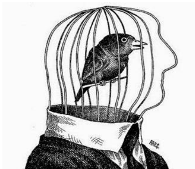
Fig. 29