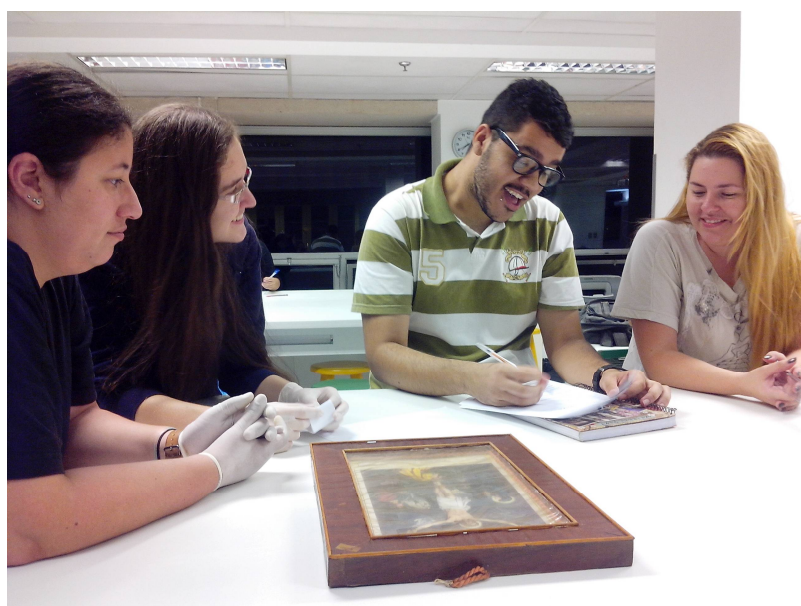
Fig. 8 - Exercício leitura de objetos com peças do acervo do EMC no laboratório da ETEC, 20/março/2015.