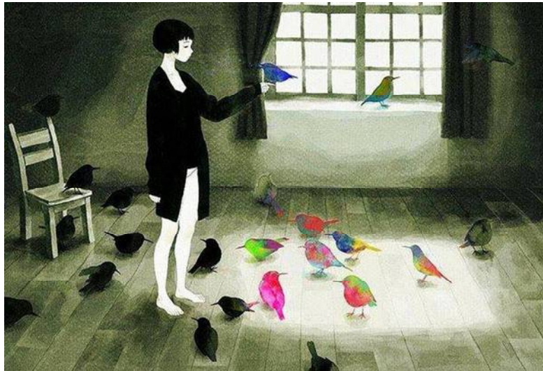
Fig. 28 - Fonte: https://wherevergs.files.wordpress.com/2014/06/tumblr_mdpgcloyax1qas1mto9_500.jpg

Me envolvi com a Educação...e comecei a “ver” idéias. Comecei a percebê-las a partir da luz que entrava pela minha janela.