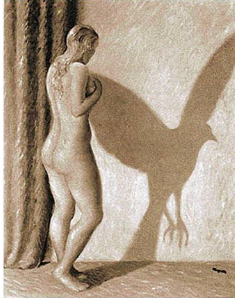
Fig. 32 - Fonte: https://namastibet.files.wordpress.com/2010/04/avesso.jpg?w=310&h=400