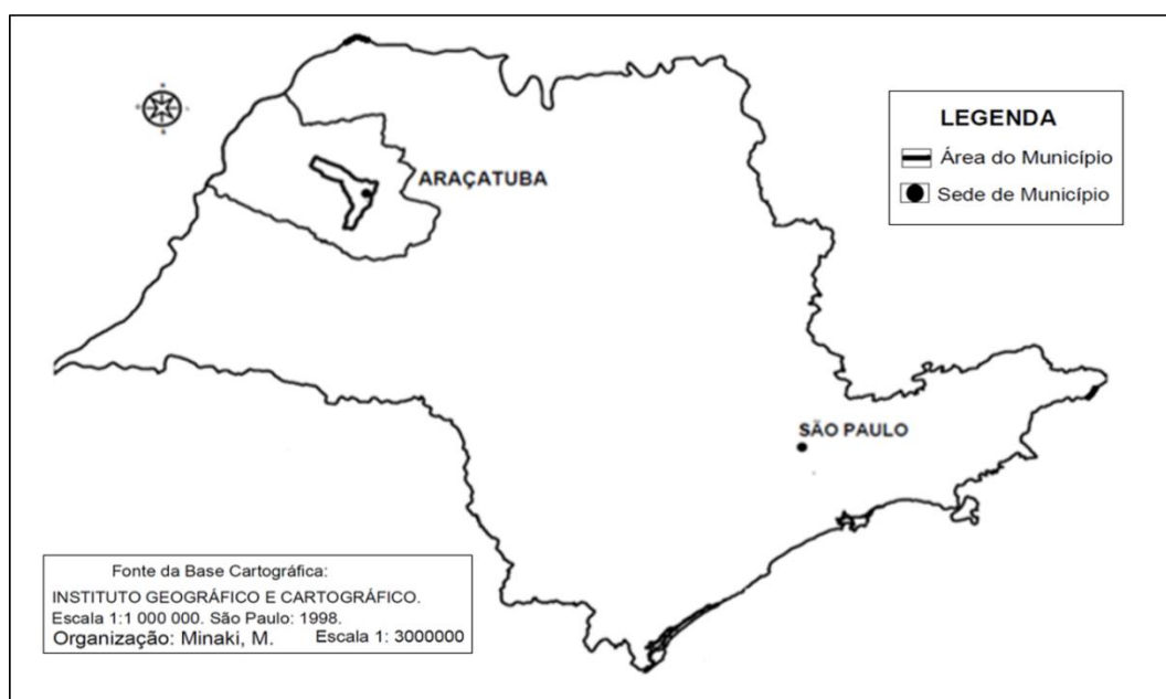
FIGURA 1 - Localização do município de Araçatuba, SP, na sua Região Administrativa.

Araçatuba está localizada na Região Noroeste, a uma distância aproximada de 530 Km da capital do Estado de São Paulo (Figura 1). O município possui uma área de 1.167,129 Km 2 e densidade populacional de 193.828 habitantes (IBGE, 2016). O mesmo possui 75 praças públicas distribuídas em 32 bairros (48 praças localizadas no centro e 27 na periferia).