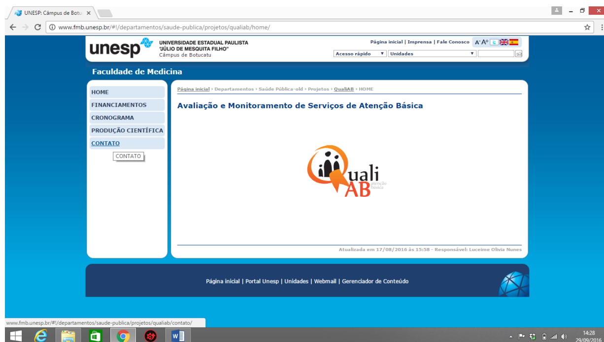
Figura 3 – Página da pesquisa “Avaliação e monitoramento de serviços de Atenção Básica: atualização e validação do instrumento QualiAB para nível nacional”, 2014.

A página do projeto continha o histórico da pesquisa QualiAB, nome dos membros da equipe, os meios de comunicação com a equipe, um texto explicativo sobre a importância da avaliação e da participação da unidade na pesquisa avaliativa, o questionário em versão PDF e a produção científica.