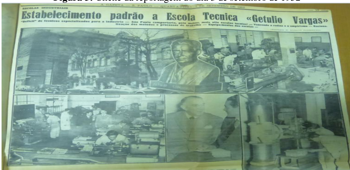
Figura 3: Clichê da reportagem do dia 3 de setembro de 1952