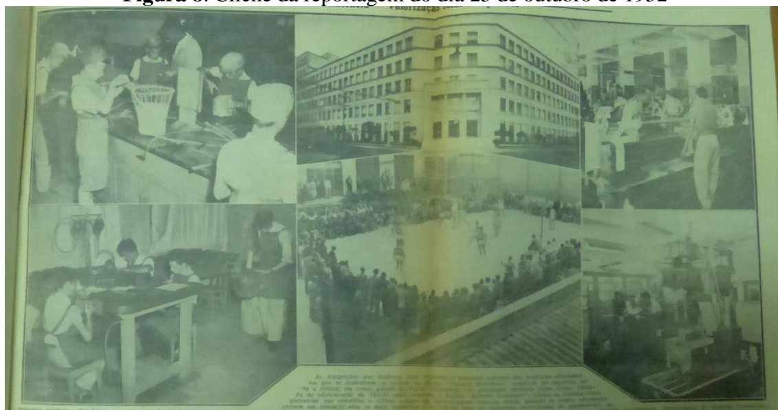
Figura 8: Clichê da reportagem do dia 25 de outubro de 1952