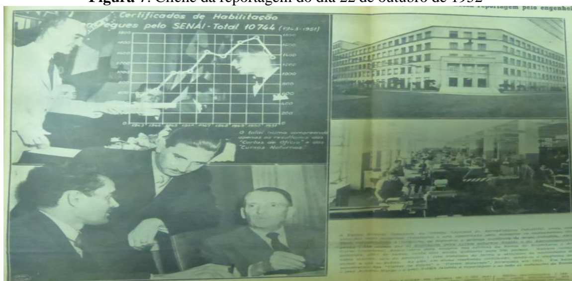
Figura 7: Clichê da reportagem do dia 22 de outubro de 1952