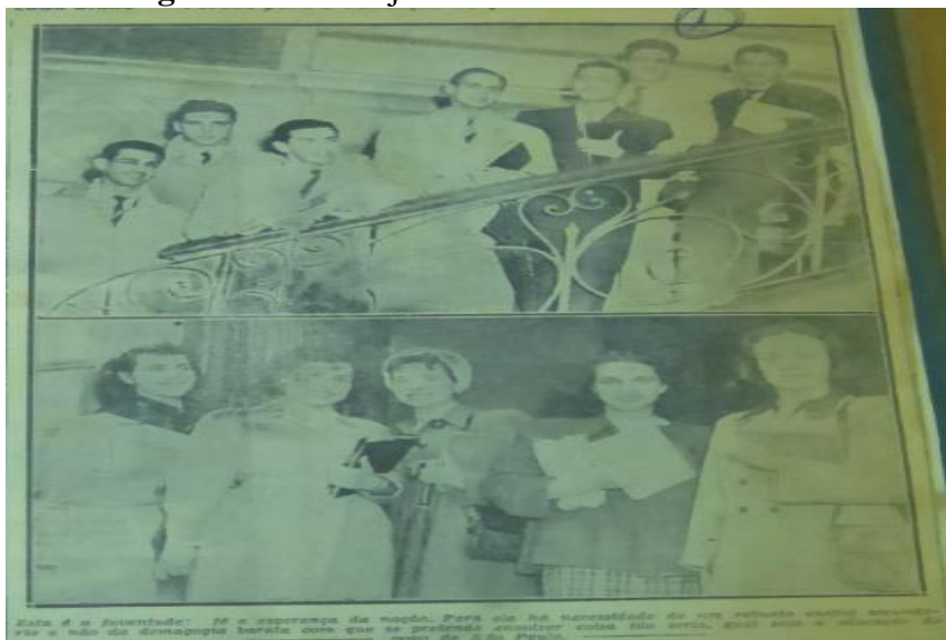
Figura 9: Foto de jovens estudantes secundaristas