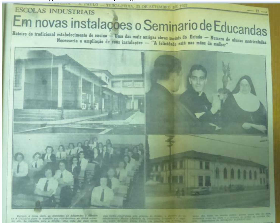
Figura 5: Clichê da reportagem do dia 23 de setembro de 1952