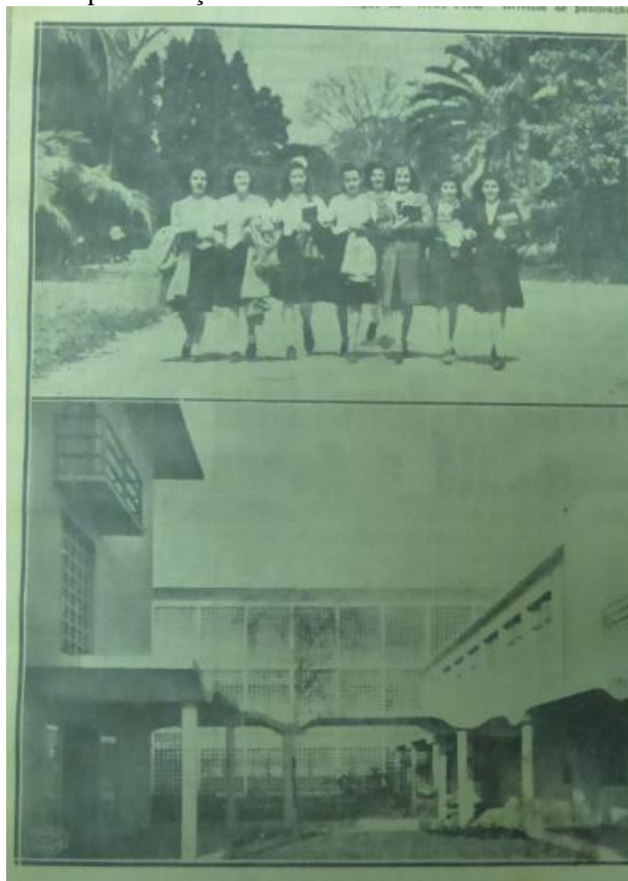
Figura 10: Grupo de moças e hall de entrada da Faculdade de Filosofia.