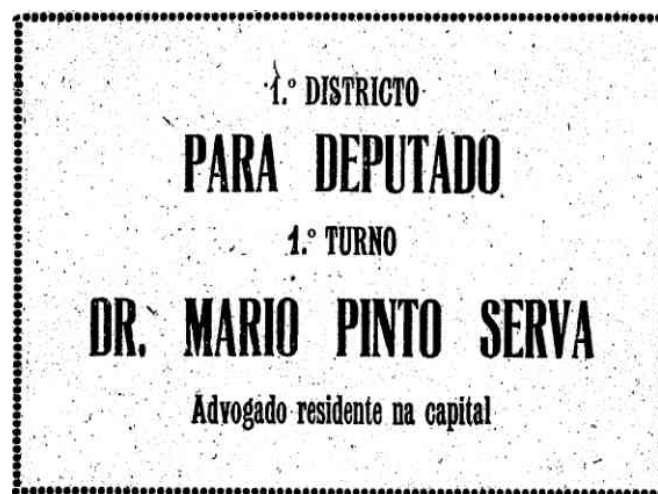
Figura 2 – Anúncio da candidatura de Mario Pinto Serva publicado nos classificados do jornal.

Mario Pinto Serva manifestou estar ciente desses fatores em 1919, quando se candidatou, pela primeira vez, ao cargo de Deputado Estadual.