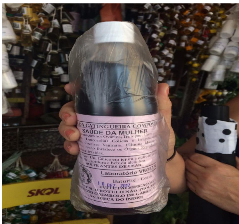
Foto 8 - Garrafada para questões ligadas ao útero comercializada na feira do Ver-o-peso Belém/PA.

O conhecimento popular está atrelado às múltiplas influências, como as da religiosidade em suas distintas manifestações e se desdobrou historicamente em