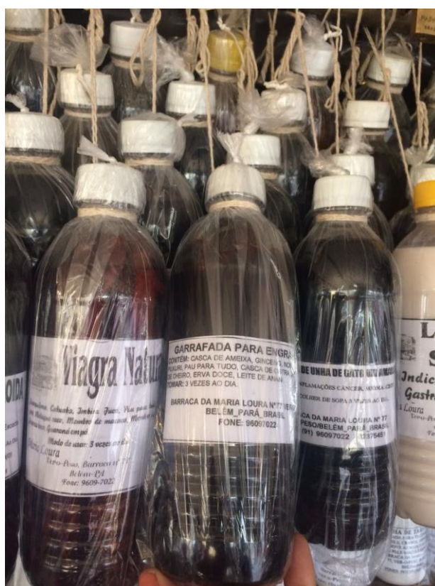
Foto 4 - Garrafadas para diversos fins, como para reprodução, miomas e cânceres no útero ou para impotência sexual, comercializadas na feira do Ver-o-peso em Belém/PA.