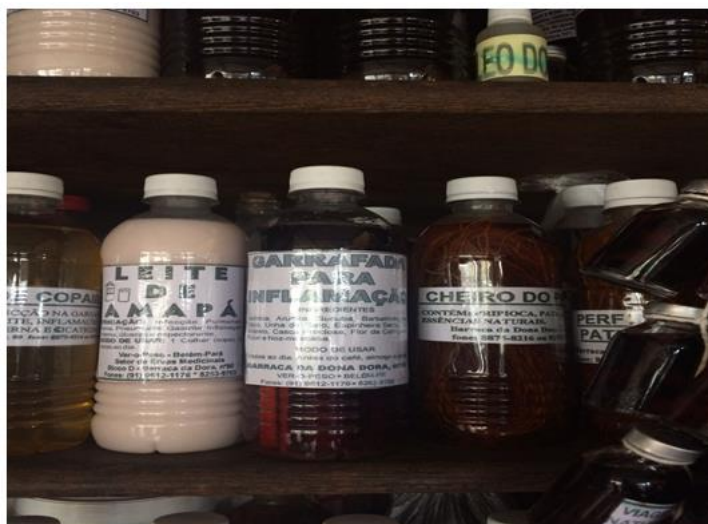
Foto 3 - Garrafadas para diversos fins comercializadas na feira do Ver-o-peso em Belém/PA.