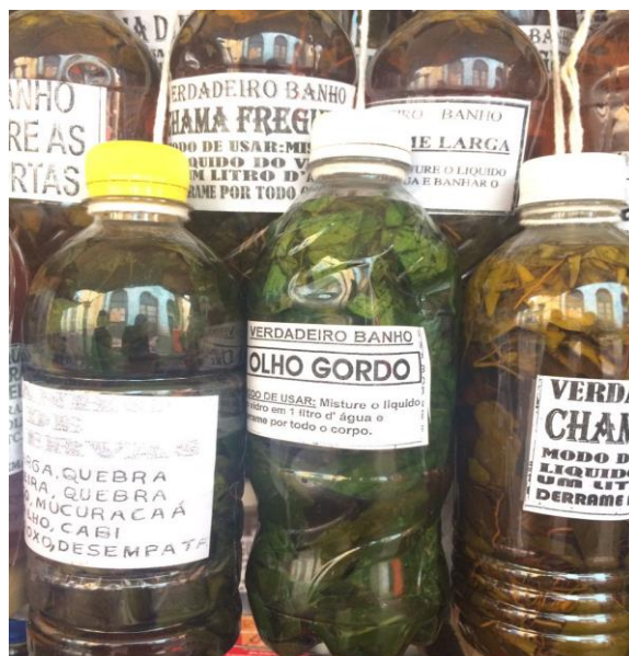
Foto 7 - “Banho de folhas” para afastar “males da alma” comercializado na feira do Ver-o-peso Belém/PA.