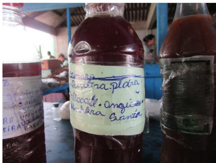
Foto 2 - Detalhe de uma garrafada para Cálculo Renal. Popular: pedra nos rins. Comercializada na Feira do Pacoval localizada na Zona Norte na área urbana da cidade de Macapá/AP.