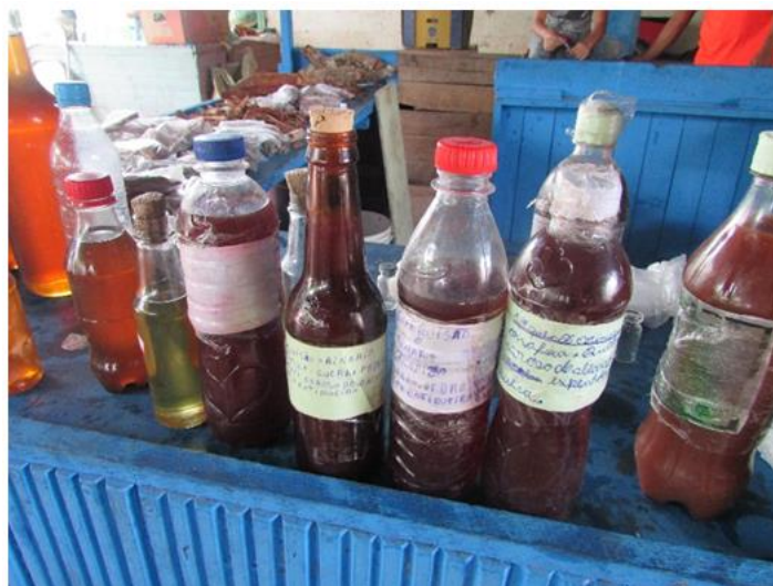
Foto 1 - Garrafadas para diversos fins, como infecção urinária, comercializadas na Feira do Pacoval, localizada na Zona Norte na área urbana da cidade de Macapá/AP.