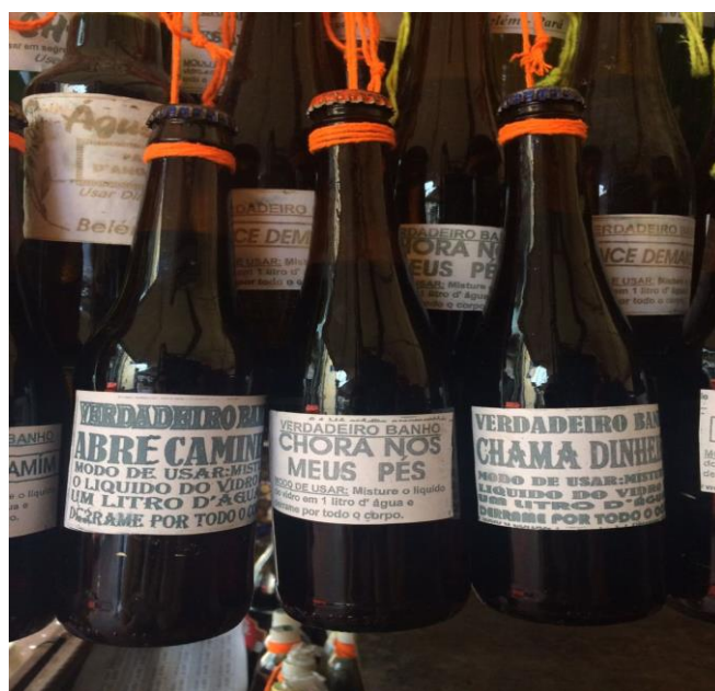
Foto 6 - Banhos de purificação e atrativos comercializados na feira do Ver-o-peso, Belém/PA.