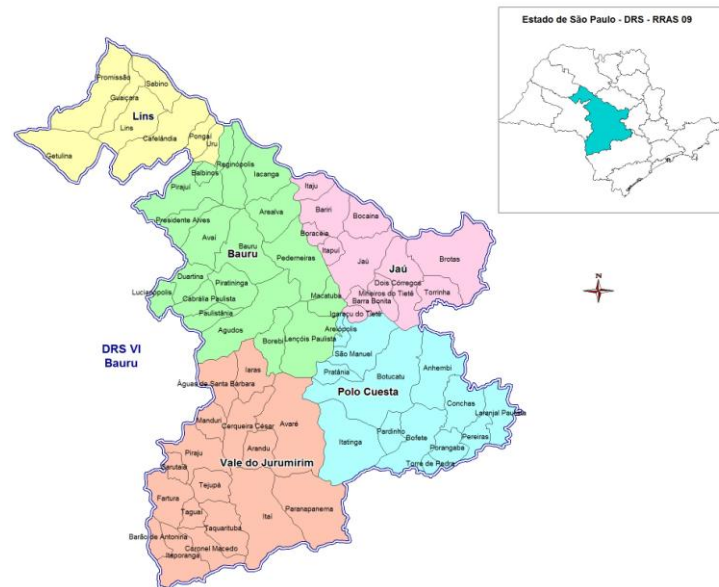
Figura 1. Mapa da área de abrangência da DRS-VI.

Fonte: Secretaria de Estado da Saúde – SP 42