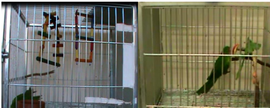
Figura 1 – Enriquecimentos ambientais introduzidos nos dias 1 e 2 de experimento.

Para a observação foi utilizado o método do animal focal (ALTMANN, 1974), quando foi analisado o comportamento expresso da ave por um período de um minuto a cada dez minutos, de acordo com o ensaio supradescrito. O etograma considerou a expressão de comportamentos nos momentos antes, durante e após, de acordo com cada categoria comportamental, como apresentado na Tabela 6.