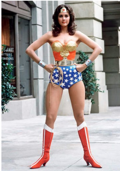
Figura 4 – Fotografia ilustrativa da posição wonder woman .

Por exemplo, há algumas posturas, que se ao se manter por algum tempo, a pessoa pode sair de um estado emocional para o outro. A posição de wonder woman (em pé, com pernas estendidas e afastadas, braços flexionados apoiados lateralmente na cintura com os punhos fechados, cabeça erguida e olhar para o horizonte) ao ser mantida por cinco minutos, dá a sensação de poder, domínio.