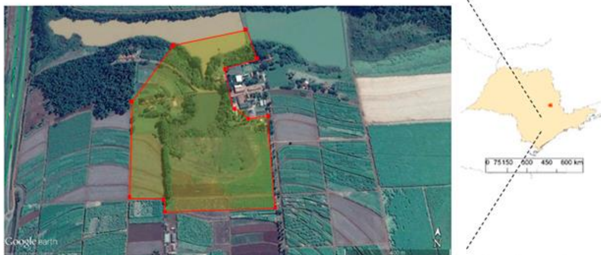
Figura 1. Vista parcial do campus UFSCar – Araras, com destaque para a área de uso das capivaras registrada com os pontos mais externos do polígono (método do MPC).

O estudo se concentrou em um grupo de capivaras que frequentava o lago menor, com 1,7 ha alimentados por cinco nascentes. No seu entorno existe uma vegetação herbácea com predomínio de capim marmelada ( Brachiaria plantaginea ), uma vez que no passado já houve criação de gado na área. Desde 2008, a área destinada à APP (área de preservação permanente) em torno do lago vem sendo enriquecida através de processo de restauração com espécies nativas, que formam atualmente arvoretas e até um pequeno bosque na margem esquerda do lago. Toda a área de APP é rodeada por plantios experimentais de cana-de-açúcar e por um pasto com capim colômbio ( Panicum maximum cv. Mombassa), onde as capivaras forrageiam.