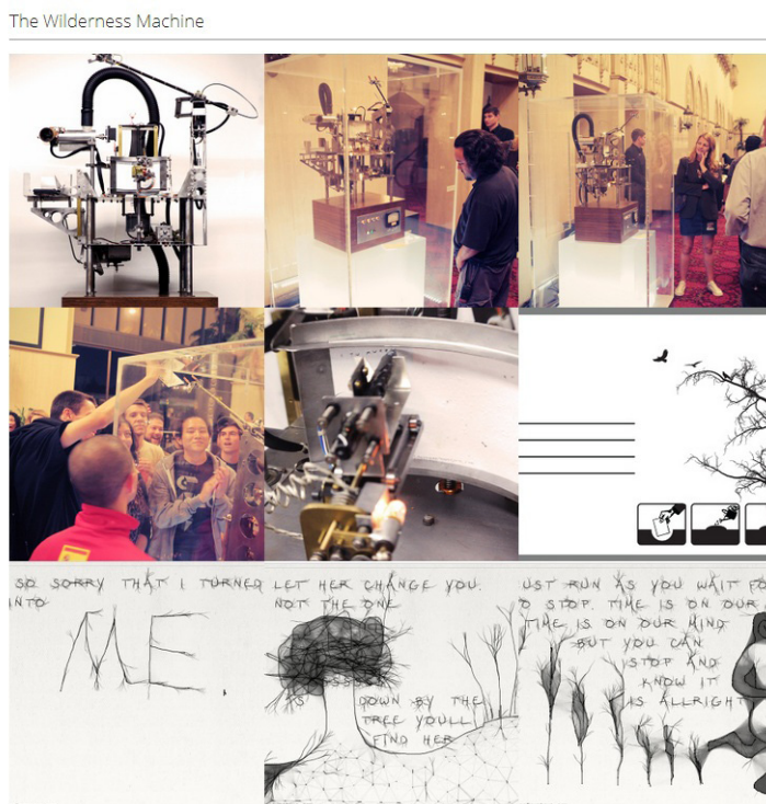
Fig. 3. Wilderness Machine e seu projeto desenvolvido por Chris Milk

Replay your film, Share your film, Send your postcard downtown e Respond to a postcard 18 . Dentro dessas opções, convém destacar a possibilidade de compartilhar o cartão desenhado durante o clipe e submetê-lo aos organizadores. Se houver uma resposta ao cartão, o usuário recebe um código para respondê-lo. Se for aceito, ele pode ser impresso pela Wilderness Machine (Figura 3), máquina criada por Chris Milk, e enviado ao usuário com uma semente de árvore para ser plantada. Fica evidente que, tanto no âmbito intertextual quanto extratextual, há um contrato enunciativo que possibilita efeitos de sentido de uma relação individualizada entre o enunciador e o enunciatário do videoclipe.