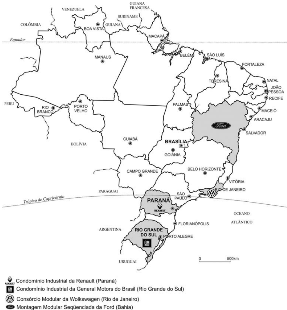
Fig. 1 – Novos espaços produtivos no Brasil. Exemplos de indústrias automobilísticas.

Fig. 1 – New Productive Spaces in Brazil: Examples of Automobile Industry.