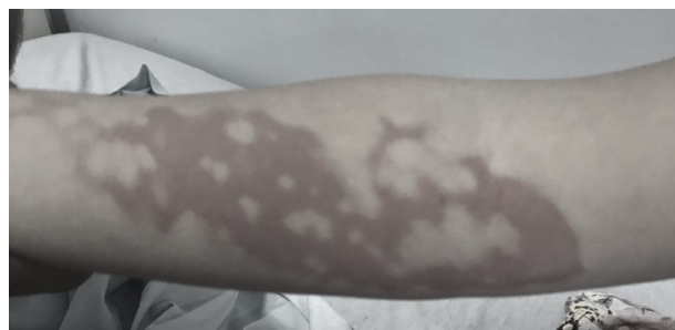
Figura 1 Lesões vermelho-arroxeadas na face ventromedial do antebraço direito no fim da anestesia.

a temperatura da paciente na região axilar esquerda atingiu 34,5°C. Devido à ausência de equipamento ativo para aquecimento corporal, foi providenciado contato corpóreo da paciente com frascos de solução fisiológica (SF 0,9%) aquecidos, envoltos em compressas, localizados embaixo do cobertor, entre o tórax e os braços estendidos ao lado do corpo, e nas regiões inguinais. Seguidos 60 minutos, a temperatura corporal atingiu 36°C, quando foram retirados os meios de aquecimento. Ao término do ato cirúrgico, paciente foi descuarizada e extubada acordada. Duração do procedimento 150 minutos. Ao serem retirados os envoltórios que cobriam a paciente, perceberam-se lesões vermelho-arroxeadas, de contornos irregulares, permeadas por áreas com palidez intensa, localizadas exclusivamente na face ventromedial do antebraço direito, estendiam-se do punho à prega antecubital (fig. 1). Nesse momento a paciente encontrava-se acordada, sem queixas álgicas. A primeira