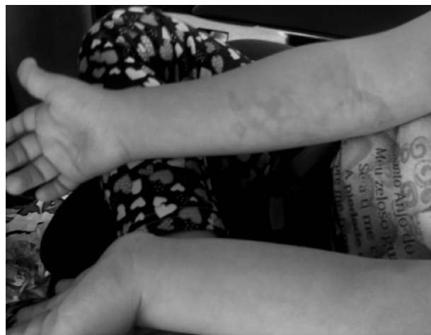
Figura 4 Ausência de lesões no antebraço esquerdo.

hipótese diagnóstica foi de queimadura por algum frasco de SF 0,9% aquecido acima do desejado. Após melhor análise das lesões e ausência de queixas de dor, esse diagnóstico foi excluído. O segundo diagnóstico se baseou em reação alérgica, porém devido à ausência de manifestações sistêmicas e às lesões serem restritas a um membro, esse também foi descartado. As lesões permaneceram inalteradas nas primeiras quatro horas e devido ao bom estado geral da paciente deu-se alta hospitalar nesse momento. Foi solicitado retorno ao hospital 12 horas após; ocorreu esmaecimento das lesões mais proeminentes na face ventromedial do antebraço direito (fig. 2), com aparecimento de lesões reticulares nessa mesma topografia e na face dorsal do antebraço direito, que chegaram a atingir o dorso da mão direita (fig. 3). Paciente mantinha bom estado geral e sem queixas alérgicas. Confirmada mais uma vez a ausência de lesões em outras topografias (fig. 4). Foi então firmado o diagnóstico de livedo reticularis (LR) e explicado aos pais que a manifestação cutânea se instalara secundariamente à hipotermia perioperatória. Após isso, a mãe relatou que a paciente já havia apresentado quadro de vermelhidão súbita nos membros inferiores quando se encontrava em ambiente climatizado e com sensação intensa de frio, com desaparecimento desse quadro cerca de uma hora após ter sido retirada do ambiente. Essa informação corroborou a