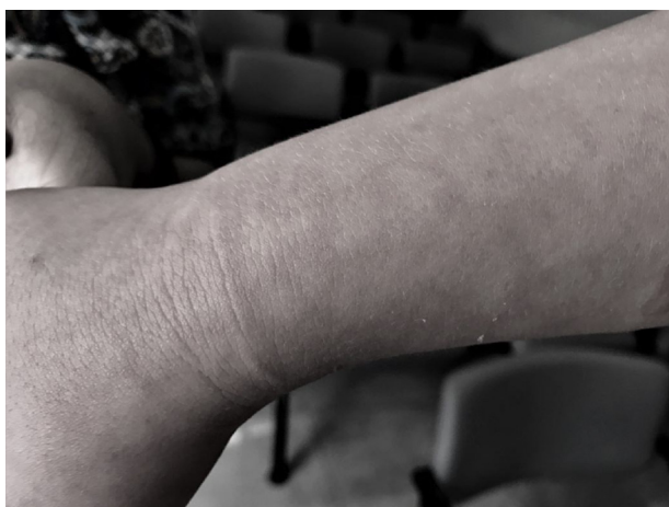
Figura 3 Lesões com padrão reticular na face dorsal do antebraço e mão direita, 12 horas após a alta hospitalar.

hipótese diagnóstica foi de queimadura por algum frasco de SF 0,9% aquecido acima do desejado. Após melhor análise das lesões e ausência de queixas de dor, esse diagnóstico foi excluído. O segundo diagnóstico se baseou em reação alérgica, porém devido à ausência de manifestações sistêmicas e às lesões serem restritas a um membro, esse também foi descartado. As lesões permaneceram inalteradas nas primeiras quatro horas e devido ao bom estado geral da paciente deu-se alta hospitalar nesse momento. Foi solicitado retorno ao hospital 12 horas após; ocorreu esmaecimento das lesões mais proeminentes na face ventromedial do antebraço direito (fig. 2), com aparecimento de lesões reticulares nessa mesma topografia e na face dorsal do antebraço direito, que chegaram a atingir o dorso da mão direita (fig. 3). Paciente mantinha bom estado geral e sem queixas alérgicas. Confirmada mais uma vez a ausência de lesões em outras topografias (fig. 4). Foi então firmado o diagnóstico de livedo reticularis (LR) e explicado aos pais que a manifestação cutânea se instalara secundariamente à hipotermia perioperatória. Após isso, a mãe relatou que a paciente já havia apresentado quadro de vermelhidão súbita nos membros inferiores quando se encontrava em ambiente climatizado e com sensação intensa de frio, com desaparecimento desse quadro cerca de uma hora após ter sido retirada do ambiente. Essa informação corroborou a